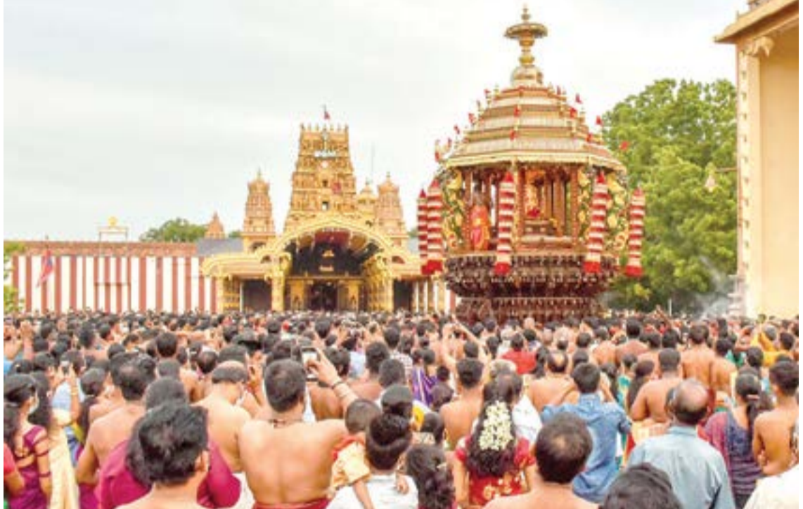
வரலாற்று பிரசித்திபெற்ற நல்லூர் கந்தசுவாமி ஆலயத்தின் தேர்த்திருவிழா நேற்று நடைபெற்றது. இதன்போது பக்தர்கள் படகூடி முருகப்பெருமான் தேரில் வலம் வர எழுந்தருளியிருப்பதை படத்தில் காணலாம்.