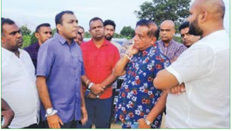
மற்றும் கால்நடை மருத்துவர்களை ஊக்குவிக்கும் வகையிலான பல சிறப்பு திட்டங்கள் அறிமுகப்படுத்த எதிர்பார்ப்பதாகவும் அமைச்சர் இதன்போது மேலும் தெரிவித்தார்.