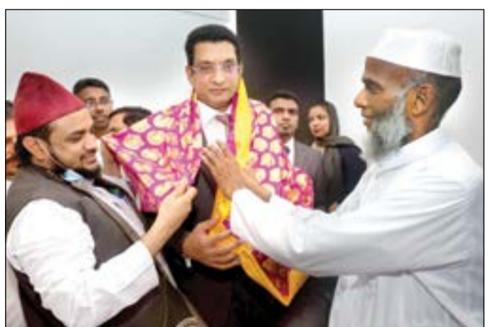
புதிய நீதியமைச்சராக நியமிக்கப்பட்டுள்ள ஜனாதிபதி சட்டத்தரணி அலி சப்ரி நேற்று (17) நீதியமைச்சின் தனது கடமைகளை பொறுப்பேற்றுக்கொண்டார். இந்நிகழ்வில் சர்வமத தலைவர்கள், அமைச்சர் நிமல் சிறிபால டி சில்வா உட்பட இராஜாங்க அமைச்சர்கள், பாராளுமன்ற உறுப்பினர்கள் உட்பட அமைச்சின் அதிகாரிகளும் கலந்துகொண்டுள்ளதை படத்தில் காணலாம்.

தினகரன் விளம்பரம் 0112429367 விற்பனை பிரிவு 0112429444, 0112429378 ஆசிரியபீடம் editor.tkn@lakehouse.lk