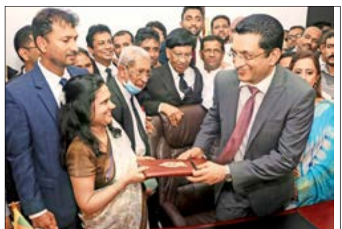
புதிய நீதியமைச்சராக நியமிக்கப்பட்டுள்ள ஜனாதிபதி சட்டத்தரணி அலி சப்ரி நேற்று (17) நீதியமைச்சின் தனது கடமைகளை பொறுப்பேற்றுக்கொண்டார். இந்நிகழ்வில் சர்வமத தலைவர்கள், அமைச்சர் நிமல் சிறிபால டி சில்வா உட்பட இராஜாங்க அமைச்சர்கள், பாராளுமன்ற உறுப்பினர்கள் உட்பட அமைச்சின் அதிகாரிகளும் கலந்துகொண்டுள்ளதை படத்தில் காணலாம்.