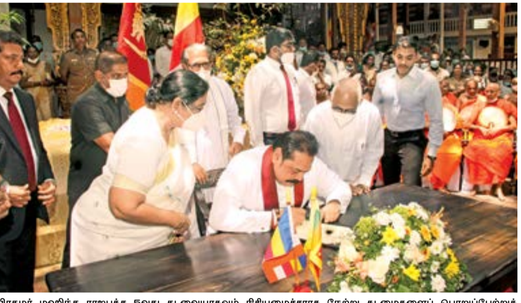
பிரதமர் மஹிந்த ராஜபக்ச 5வது தடவையாகவும் நிதியமைச்சராக நேற்று கடமைகளைப் பொறுப்பேற்றுக் கொண்டார். கொழும்பு கோட்டையிலுள்ள நிதி அமைச்சர் நடைபெற்ற விசேட நிகழ்வில் சர்வமத்த தலைவர்களின் ஆசீர்யுடன் அவர் நிதியமைச்சராகவும் புத்தசாண, சமய, கலாசார விவகார, நகர அபிவிருத்தி மற்றும் வீடமைப்பு அமைச்சராகவும் கடமைகளைப் பொறுப்பேற்றுக்கொண்டபோது...