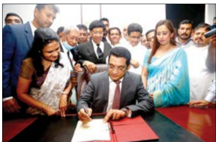
புதிய நீதியமைச்சராக நியமிக்கப்பட்டுள்ள ஜனாதிபதி சட்டத்தரணி அலி சப்ரி நேற்று (17) நீதியமைச்சின் தனது கடமைகளை பொறுப்பேற்றுக்கொண்டார். இந்நிகழ்வில் சர்வமத தலைவர்கள், அமைச்சர் நிமல் சிறிபால டி சில்வா உட்பட இராஜாங்க அமைச்சர்கள், பாராளுமன்ற உறுப்பினர்கள் உட்பட அமைச்சின் அதிகாரிகளும் கலந்துகொண்டுள்ளதை படத்தில் காணலாம்.