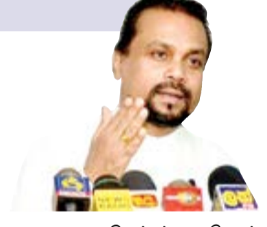
19 ஆவது திருத்தத்தை கொண்டுவந்தவர்கள் கூட இன்று அதனை எதிர்க்கின்றனர். நாட்டையும் நாட்டு மக்களையும் பலப்படுத்தும் வகையில் புதிய அரசியலமைப்பு உருவாக்கப்படும் என்றும் அவர் தெரிவித்தார்.

களை பொறுப்பேற்றார். இதன் போது கருத்துத் தெரிவித்த அவர், நல்லாட்சி அரசாங்கத்தில் 19 ஆவது திருத்தச் சட்டத்தின் ஊடாக முன்னெடுக்கப்பட்ட அனைத்து நடவடிக்கைகளும் மாற்றியமைக்கப்படும். மேலும் புதிய அரசியலமைப்புக்கு ஏற்றவாறு நாட்டை அபிவிருத்தியை நோக்கி கொண்டுச் செல்ல வேண்டும். இதற்கு பொதுத்தேரலில் மக்கள் வழங்கிய ஆணையை முறையாக பயன்படுத்திக்கொள்ள வேண்டும். அனைவருக்கும் ஒரே சட்டம் என்ற அடிப்படையில் சட்டம் உருவாக்கப்பட வேண்டும்.