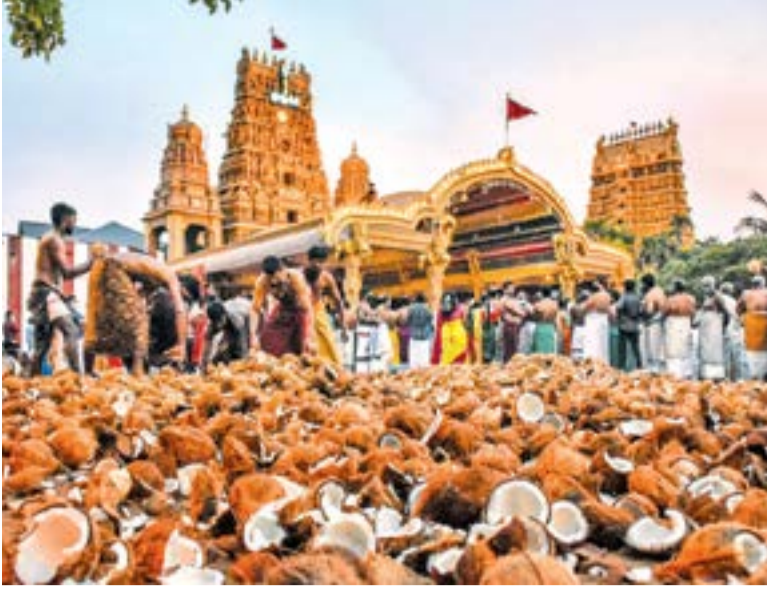
வரலாற்று சிறப்புமிக்க நல்லூர் கந்தசுவாமி ஆலயத்தின் தேர் திருவிழா நேற்று விமரிசையாக நடைபெற்ற போது எடுக்கப்பட்ட படங்கள்.