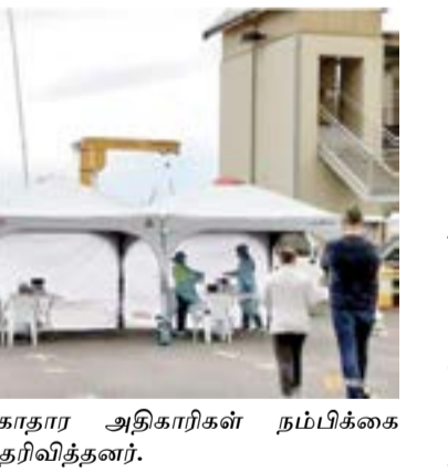
சுகாதார அதிகாரிகள் நம்பிக்கை தெரிவித்தனர்.

தினம், அந்த எண்ணிக்கை 279 ஆக இருந்தது. இம்மாத ஆரம்பத்தில் விக்டோரியா மாநிலத்தில் தினசரி 700 பேர் வரை பாதிக்கப்பட்டனர். கடுமையான முட்டக்க நடவடிக்கைகள் பலன் தருவதாகச்