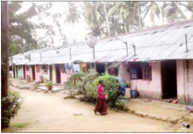
கனத்துறை சுழற்சி நிறுபர்

கனத்துறை மாவட்டம், புல்த்சிங்கள, கல்லுமலைத் தோட்டத்தில் அமைந்துள்ள இருபது காம்ப்ரா தோட்ட குடியிருப்புகளுக்கு கடந்த இருபது வருடங்களாக நிலவிவந்த குடிநீர் பிரச்சினைக்கு நிரந்தர தீர்வு பெற்றுக் கொடுக்கப்பட்டுள்ளது. தோட்ட நலன் விரும்பிகளின் வேண்டுகோள்களின் கீழ் கடந்த பொது தேர்தலின் போது