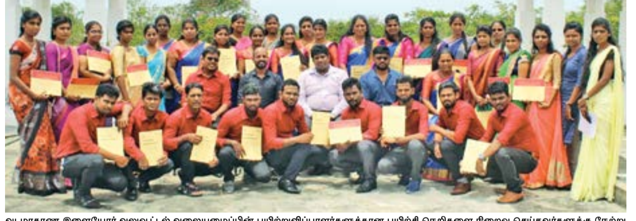
வடமாகாண இணையேர் வலுவூட்டல் வலையமைப்பின் பயிற்றுவிப்பாளர்களுக்கான பயிற்சி ஏற்றிகளை நிறைவு செய்தவர்களுக்கு நேற்று சான்றிதழ்கள் வழங்கப்பட்டன. அவர்களில் சான்றிதழ்களை பெற்றவர்களை படத்தில் காணலாம்.

www.slp.a.lk என்ற இணையதளத்தை மேலதிகமான விபரங்களுக்காக பார்க்கவும். பிரதான முகாமையாளர் (லொஜிஸ்டிக்ஸ்), 2020.08.19 இலங்கை துறைமுகங்கள் அதிகார சபை, இல.: 15, லோட்டஸ் வீதி, கொழும்பு-01.