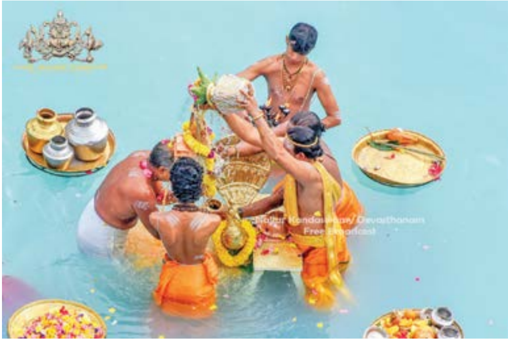
நல்லூர் கந்தசுவாமி ஆலயத்தின் தீர்த்தோற்சவம் நேற்று காலை வெகு விமரிசையாக நடைபெற்றது. விநாயகர், வள்ளி தேவசேனா சமேத வேற்பெருமான், சண்டிகேஸ்வரர் சண்டிகேஸ்வரர் புஷ்கரணிக்கு எழுந்தருளி தீர்த்தவாரி கண்டருளினார். திருக்குளத்தின் அபிஷேக ஆராதனைகள் நிகழ்த்தப்படுவதையும், சுவாமி வீதியுலா வருவதையும் படங்களில் காணலாம்.