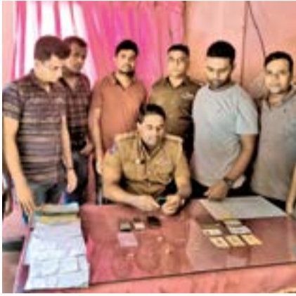
பகுதித்துறை விசேட நிருபர்

யாழ்ப்பாணம், சாவகச்சேரி, சுன்னாகம் பகுதிகளில் அண்மைய நாட்களில் இரவு வேளைகளில் வீட்டில் தனிமையில் இருந்த வயோதிபர்களை தாக்கி கொள்ளையில் ஈடுபட்ட மூவரை யாழ்ப்பாணம் குற்றத் தடுப்பு பிரிவு பொலிசார் கைது செய்துள்ளனர். கைது செய்யப்பட்டவர்களிடமிருந்து 7 பவுண் திருடப்பட்ட நகைகள், திருடப்பட்ட 20