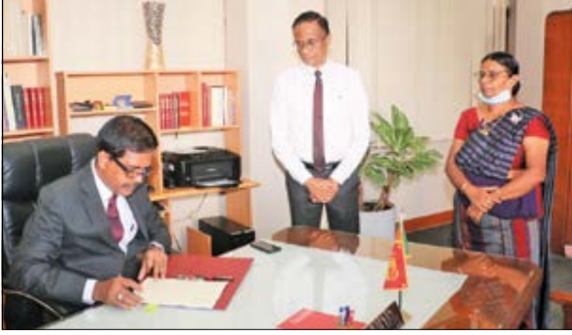
நீதி அமைச்சின் புதிய செயலாளராக நியமிக்கப்பட்டுள்ள சட்டத்தரணி பிரியந்த மாயா துன்னே, நேற்று நீதி அமைச்சின் தனது கடமையை பொறுப்பேற்றபோது..