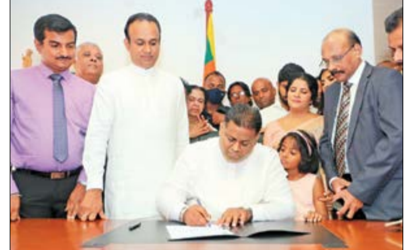
தென்னே, சித்துள், பணை மற்றும் இரப்பர் செய்கைகள் மேம்பாடு மற்றும் அவை சார்ந்த பொறிமுறை பண்டங்களின் உற்பத்தி மற்றும் ஏற்றுமதி பலவகைப்படுத்தல் இராஜாங்க அமைச்சர் அருந்திக்க பெர்னாண்டோ நேற்று அமைச்சு அலுவலகத்தில் கடமையை பொறுப்பேற்றபோது..