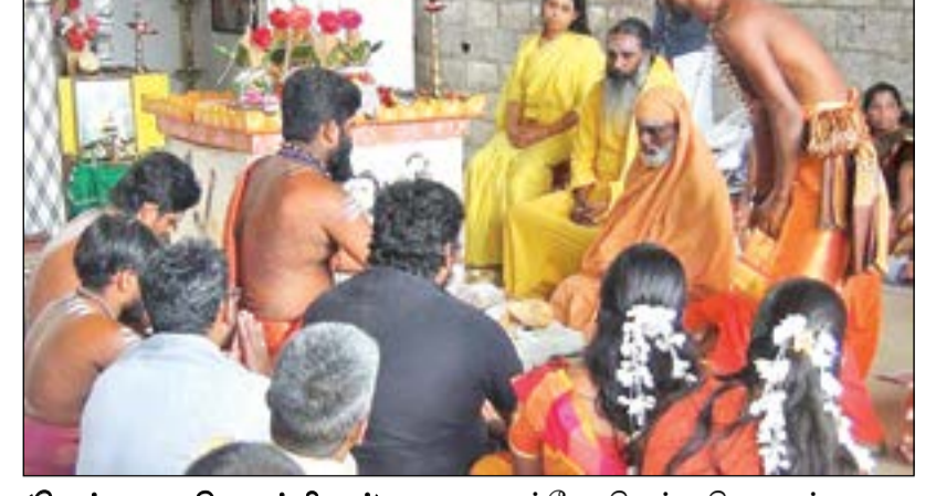
(கொட்டகலை தினகரன் நிருபர்)