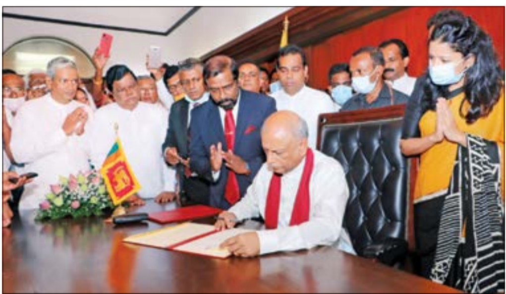
வெளிநாட்டினுடைய அமைச்சராக தினேஷ் குணவர்த்தன நேற்று முன்தினம் வெளி விவகார அமைச்சு அலுவலகத்தில் தனது கடமையை பொறுப்பேற்றபோது..