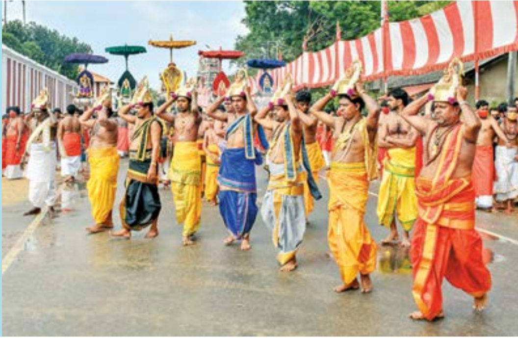
நல்லூர் கந்தசுவாமி ஆலயத்தின் தீர்த்தோற்சவம் நேற்று காலை வெகு விமரிசையாக நடைபெற்றது. விநாயகர், வள்ளி தேவசேனா சமேத வேற்பெருமான், சண்டிகேஸ்வரர் சண்டிகேஸ்வரர் புஷ்கரணிக்கு எழுந்தருளி தீர்த்தவாரி கண்டருளினார். திருக்குளத்தின் அபிஷேக ஆராதனைகள் நிகழ்த்தப்படுவதையும், சுவாமி வீதியுலா வருவதையும் படங்களில் காணலாம்.