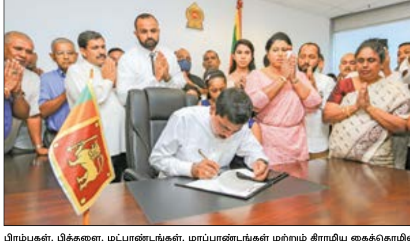
பிரம்புகள், பித்தளை, மட்பாண்டங்கள், மரப்பாண்டங்கள் மற்றும் கிராமிய கைத்தொழில் மேம்பாடு இராஜாங்க அமைச்சராக பிரசன்ன ரணவீர நேற்று கடமையை பொறுப்பேற்றபோது..