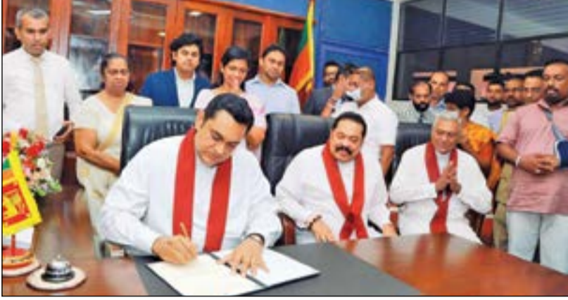
நெல் மற்றும் தானியங்கள், சேதன உணவுகள், மரக்கறிகள், பழவகைகள், மினகாய், வெங்காயம் மற்றும் உருளைக்கிழங்கு செய்கை மேம்பாடு, விதை உற்பத்திகள் மற்றும் உயர் தொழில்நுட்ப கமத்தொழில் இராஜாங்க அமைச்சராக ஷைந்திர ராஜபக்சே நேற்று கடமையை பொறுப்பேற்ற போதுபிடிக்கப்பட்ட படம். பிரதமர் மஹிந்த ராஜபக்சேவும் அமைச்சர் சமல் ராஜபக்சேவும் நிகழ்வில் கலந்துகொண்டனர்.