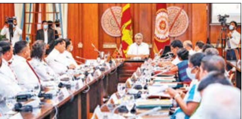
ஆடைக் கைத்தொழில் நாட்டின் மொத்த ஏற்றுமதியில் 43 வீதத்தை பிரதிநிதித்துவம் செய்கின்றது. இதன் மூலம் ஏற்றுமதி வருமானத்துக்கு வருடாந்தம் 05 பில்லியன்

பத்திக், கைத்தறித்துறைக்கு முதலிடம் பத்திக் கைத்தொழிலை மேம்படுத்த திட்டம் இராஜாங்க அமைச்சு விடயத்தான்கள் குறித்து ஜனாதிபதி விளக்கம்