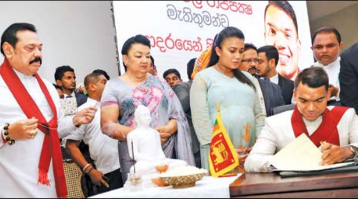
விளையாட்டுத்துறை, இளைஞர் விவகார அமைச்சரக நாமல் ராஜபக்ஷ நேற்று அமைச்சு அலுவலகத்தில் கடமைகளை பொறுப்பேற்றார். பிரதமர் மஹிந்த ராஜபக்ஷவும் தனது பாரியார் சகிதம் இந்நிகழ்வில் கலந்துகொண்டதையும் படத்தில் காண்க.

ஜோர்தான், கட்டாரிலிருந்து 305 இலங்கையர்கள் நேற்று நாடு திரும்பினர்