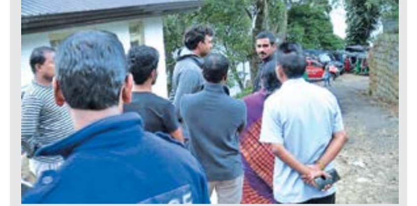
கொத்தமலை, வேவண்டனில் உள்ள மறைந்த அமைச்சர் ஆறுமுகன் தொண்டமானின் பூர்வீக இல்லத்தில் நேற்று அதிகாலை ஏற்பட்ட தீயீர்த் தீ விபத்து காரணமாக வீட்டின் கூரை முழுமையாக சேதமடைந்துள்ளது. இதனெதொடர்ந்து நுவரெலியா தீயணைப்பு படைப்பிரிவின் தீயை கட்டுப்பாட்டுக்குள் கொண்டுவர நடவடிக்கை எடுப்பதையும், மறைந்த அமைச்சர் ஆறுமுகன் தொண்டமானின் புதல்வரான, இராஜாங்க அமைச்சர் ஜீவன் தொண்டமான் உட்பட இலங்கை தொழிலாளர் காங்கிரஸின் முக்கியஸ்தர்கள் மற்றும் கட்சியின் ஆதரவாளர்கள் சம்பவ இடத்தில் காணப்படுவதை படங்களில் காணலாம்.