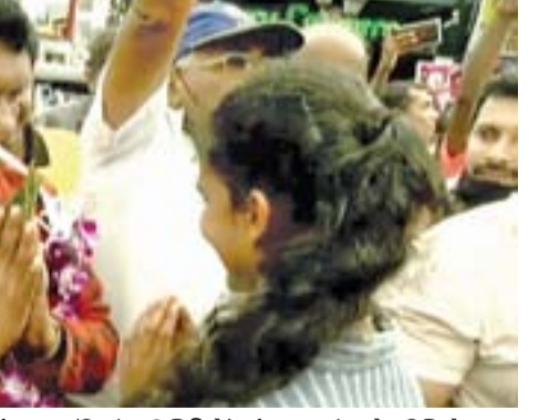
ගම්පහ දිස්ත්‍රික්කයෙන් ශ්‍රී ලංකා පොදුජන පෙරමුණේ අති විශිෂ්ට රජයේ සේවකයන් ලබමින් ගම්පහ දිසාවෙන් වැඩිම මනාප තුන් ලක්ෂ පයින් පන්දහස් හාරදහස් හැත්තෑ තමයක් ලබා ගත් නාගරික සංවර්ධන, වෙරළ සංරක්ෂණ අපරාධ නිලධාරී හා පුරා පවුල කටයුතු රාජ්‍ය අමාත්‍ය ආචාර්ය නාලක ගොඩහේවා මහතා පිළිගැනීමේ උත්සවයක් ගම්පහ නගරයේදී පැවැත්විණි.