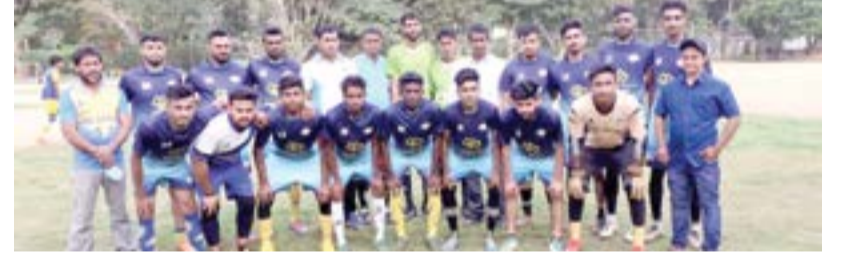
உக்குவளை விசேட நிருபர்

மாத்தளை ஜொலி போய்ஸ் விளையாட்டுக்கழகம் மற்றும் உக்குவளை கோல்ட்மூன் விளையாட்டுக் கழகங்களுக்கிடையில் இடம்பெற்ற உதைப்பந்தாட்ட போட்டியில் 4:3 என்ற கோல் அடிப்படையில் உக்குவளை கோல்ட்மூன் விளையாட்டுக்கழகத்தை தோல்வியடையச் செய்த மாத்தளை ஜொலி போய்ஸ் விளையாட்டுக்கழகம் மாத்தளை மாவட்ட கிராம சேவகர் பிரிவுக்கான சம்பியன் கிண்ணத்தை கவிக்கரித்துக் கொண்டது.