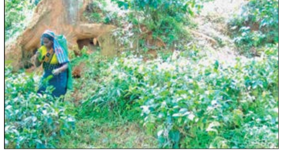
வேண்டுகோள் விடுத்து வருகின்ற போதும், இதுதொடர்பாக தோட்டநிர்வாகமோ அனர்த்த முகாமைத்துவ திணைக்களமோ இதுவரையில் எதுவித

கண்டி-கலஹா குறுந்தார பிரதான பாதையில் இந்தத் தோட்டம் அமைந்துள்ளது. இப்பாதையே தேயிலை மலைகளிலும் பெரிய மரங்கள் நூற்றுக்கணக்கில் உள்ளன. மரங்கள் வேரூள் சரிந்து வீழ்ந்தும், பெரும் மரக்கிளைகள் உடைந்து வீழ்ந்தும் அடிக்கடி பாதையில் போக்குவரத்து தடைப்படுகின்றது.