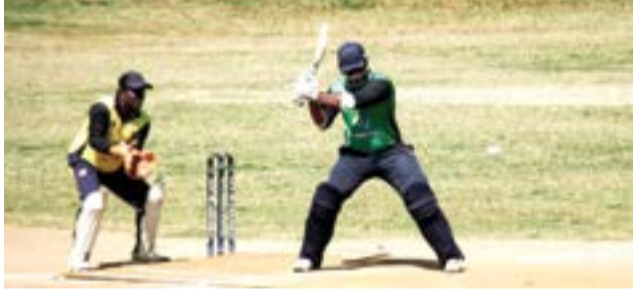
(அக்குறை குறாப் நிருபர்)

கெலியா விளையாட்டுக் கழகம் ஒழுங்கு செய்துள்ள 'கிரிக்கெட் பிலாஸ்டர் 2020' கண்டி மாவட்ட கடின பந்து கிரிக்கெட் சுற்றுப் போட்டியில் மடவளை ஓஸ்ட் மதீனியன்ஸ் விளையாட்டுக் கழகம் இறுதிப் போட்டிக்கு தகுதி பெற்றுள்ளது. (22.8.2020)