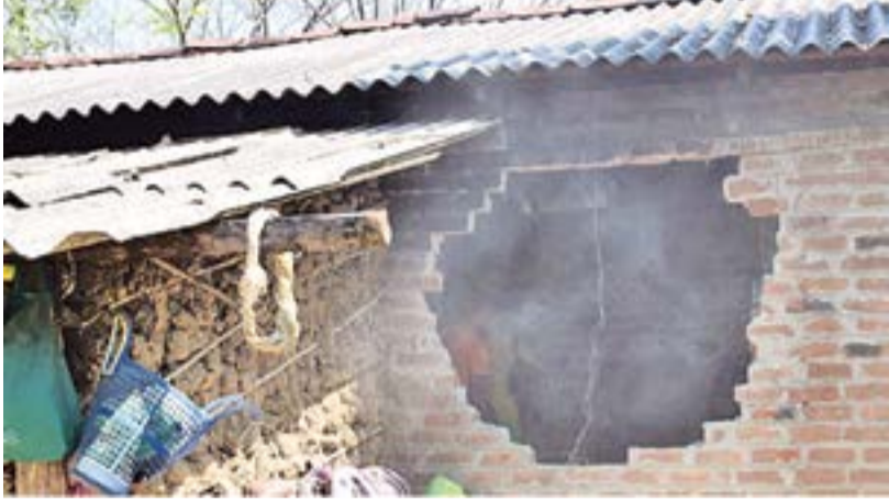
மங்களில் காட்டு யானைகளின் தொல்லை அதிகரித்துள்ளதாகவும் இவ்வாறு சுமார் 30 கிராமங்கள்

மாத்தளை மாவட்டத்தில் எல்லைக் கிராமங்களில் காட்டு யானைகளின் அட்டகாசம் அதிகரித்து வருவதாக பிரதேச மக்கள் விசயம் தெரிவிக்கின்றனர். கடந்த காலங்களில் இது விடயமாக ஆட்சியாளர்கள் கவனமெடுக்காத காரணத்தால் தாம் தொடர்ந்தும் பாதிக்கப்பட்டு வந்துள்ளதாகவும் புதிய அரசாங்க இடம் ஏற்ற நடவடிக்கை எடுக்க வேண்டும் என்றும் பிரதேச மக்கள் வேண்டுகோள் விடுக்கின்றனர்.