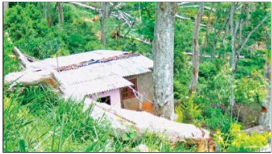
பிரிவுகளிலேயே அதிகமான மரங்கள் காணப்படுகின்றன. இந்த மரங்களை தறித்து அகற்றி தமக்கு பாதுகாப்பை பெற்றுத் தரும்படி தொழிலாளர்கள்

தொழிலாளர்களது குடியிருப்புகளுக்கு அருகில் அதிகமாக இந்த மரங்கள் உள்ளன. வெஸ்ட் டிவிசன், மூன்றாம் கட்டை டொப்பிவிசன் ஆகிய தோட்டப்