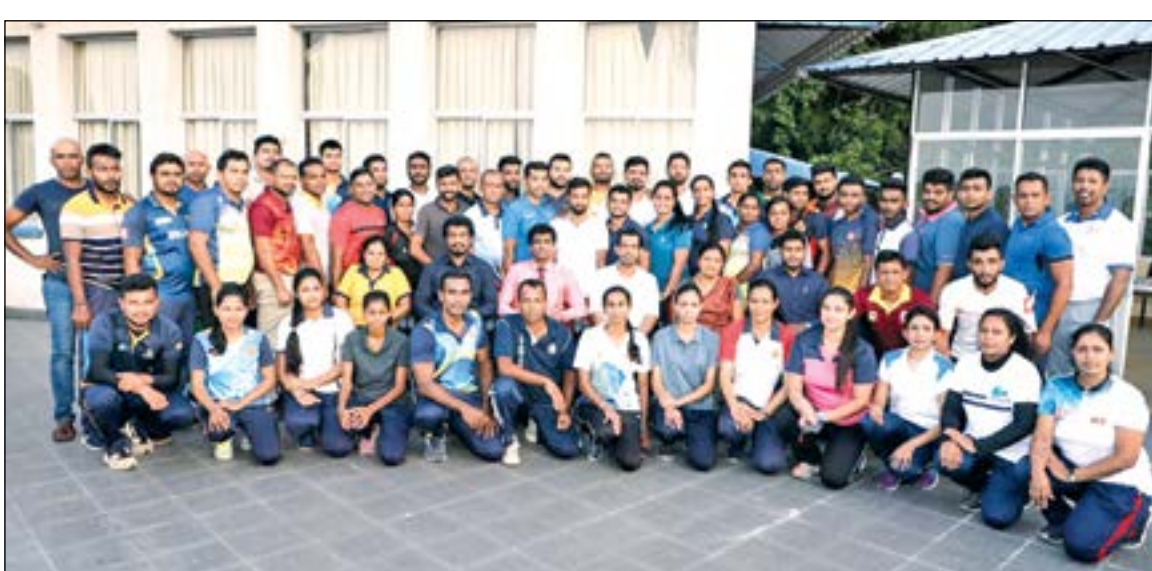
மத்திய மாணாத்தின் விளையாட்டு பயிற்சிப்பாளர்களின் அறிவை மேம்படுத்துவதற்காக வகையில் மத்திய மாணாத்தின் விளையாட்டுத்துறையினால் ஏற்பாடு செய்யப்பட்ட பயிற்சிக் கருத்தரங்கு கண்டி குருவிட்டைய மேம்பாட்டு கல்வி நிலையத்தில் நடைபெற்றது. இதில் கலந்துகொண்ட பயிற்றுவிப்பாளர்களை படத்தில் காணலாம்.

இலங்கையில் முதற் தடவையாக கஞ்சா தோட்டங்களை தேடும் முற்றுகை முயற்சிக்கு வான், தரைப்படகை பயன்படுத்தப்பட்டு பாரிய நிலப்பரப்பில் 8 கஞ்சா தோட்டங்களில் பயிர் செய்யப்பட்டிருந்த 159,530 கஞ்சா செடிகள் நேற்று முன்தினம் கண்டுபிடிக்கப்பட்டன.