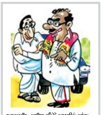
தலைவரே, யாரே வீட்டு வாசலில் வந்து நின்று பணம் கேட்கிறார்... எதுக்கு எண்டு கேட்பா, தலைவருக்கு தெரியும் பொத்திக்கிட்டு வாங்கிட்டு வா என்று தெனாவட்டா சொல்லுறார்...

ஓ, அதுவா நேற்றைக்கு நூற்று வருஷம் விழாவுக்கு யானை, பொன்னாடை வாங்கி சனத்தை வெச்சு போடச் செய்து கொடுத்தாருங்கார... பேசாம இந்த காச கொடுத்துட்டு வா