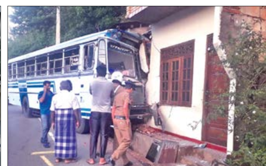
கொழும்பிலிருந்து பதுளை நோக்கி சென்றுகொண்டிருந்த தனியார் பேருந்து பாதையை விட்டு விலகி வீடான்றுடன் மோதி விபத்துக்குள்ளாகியுள்ளதை படத்தில் காணலாம்.