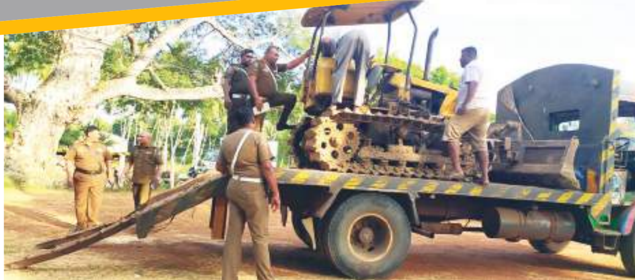
අත්අඩංගුවට ගත් බැරකෝරටය

■ ගෙවී යමින් පවතින්නේ පරිසරයේ විරහාකම සහ පරිසර සුරැකීම සම්බන්ධයෙන් සමාජයේ දැඩි අවධානයක් යොමු වූ කාල පරිච්ඡේදයකි. සිංහරාජ විනාශකරයට මායිම්ව පිහිටි ලංකාගමට යන මාර්ගයේ ප්‍රතිසංස්කරණ කටයුතු ආරම්භ වීමත් සමඟ ආරම්භ වූ මෙම කනාවක අද වන විට කේන්ද්‍රගතව ඇත්තේ ආනවිච්ඡාදන වටාය. මීට දින කිහිපයකට ප්‍රථම මෙරට පරිසරලලවුන් අතර පමණක් ප්‍රචලිතව තිබුණු ආනවිච්ඡාදන අද වන විට පැතික මර්ධමින් කනාවකට ක්‍රම වන මානකාවක් බවට පත්ව තිබේ.