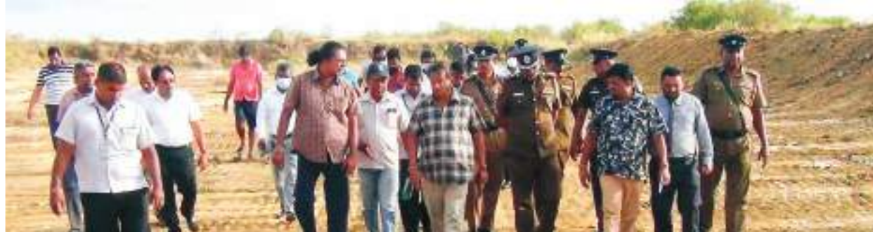
ආනවිච්ඡාදන ඇමැතිවරයාගේ අධීක්ෂණයට

රැමියා තෙත් බිමක් මෙන්ම අහස භූමියක් ලෙස ආනවිච්ඡාදනට අයත් අක්කර දෙකක පමණ බිම් කොටසක් ඩෝසර් කිරීමත් සමග මෙම කනාවක ආරම්භ විය. මෙවැනි මිල කළ නොහැකි පරිසර පද්ධතියක් මෙරට කිබෙන බවක්වත් නොදන සිටි බොහෝදෙනා අද ආනවිච්ඡාදන ගැන කතා කරති. පුත්තලම දිස්ත්‍රික්කයේ පිහිටා තිබෙන ආනවිච්ඡාදන හෙක්ටයාර් 1397කින් සමන්විතය.