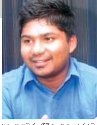
අය සැපවත් ජීවිත ගත කරනවා. එහෙම ගත කරන ගමන් උතුරේ තරුණ තරුණියන්ගෙන් ඒ අයිතීන් උදුරා ගන්නවා. හැබැයි විශේෂවරම් මහත්මියවරයා එක් දෙයක් මතක තිබෙන යුතුයි. ඒ නමයි අද මේ රට පාල-නය කරන්නේ ගෝඨාභය රාජපක්ෂ, මහින්ද රාජපක්ෂ මහත්මියවරයන් මියත් යහපාලන ආණ්ඩුව පාලනය කළ දැණින් වැටෙන නායකයන් නොවේ. ඒ නිසා එක එක කළ පණුවන් මින විදියට මේ රට කන්න දෙන්නේ නැහැ.

රාජ්‍ය ඇමැති ඩී. වි වානක දුන්න ගෙනාට යෝජනාවට අත මස-වලා ජනදය ලබාදුන්නාමේ අයට ප්‍රජාතන්ත්‍රවාදය මිනේ නැහැ, සාමය මිනේ නැහැ, මේ අයට අවශ්‍ය එකම දේ මවුන්ගේ ගිලිහිලා ගිය මන්ත්‍රීවරු සංඛ්‍යාව නව නවත් ගිලිහෙලා යන එකෙන් ආරක්ෂා කරගැනීම විතරයි. දෙමළ ජාතික සන්ධානය පාර්ලිමේන්ටයේ දෙමළ ජනතාව වෙනුවෙන් ඉන්දු එකම නියෝජිතයෝ ඒ අය කියලා. එතෙක් අද වන විට ඒ තත්ත්වය වෙනස් වෙලා. ශ්‍රී ලංකා පොදුජන පෙරමුණේ එක්ක පසුගිය මහ මැති-වරණයට තරග කළ පිරිසගෙන් 11 දෙනෙක් ජයග්‍රහණය කරලා මන්ත්‍රී-වරු දිනාගත්තා. ඒ මැතිවරණයෙන් දෙමළ ජාතික සන්ධානයට දිනාගන්න පුළුවන් වූයේ මන්ත්‍රීවරු දහයයි. මේ අයට අපේ මන්ත්‍රීවරු 11 දෙනෙක් කොට දැමූවත් ඔවුන් වෙලා තිබෙනවා. දුන්න ඉස්සරට එන්න ක්‍රමවේද ගොඩ-නවා. අන්ත එකකොට දුන්න එකම ගමන් අතින් පැතිනෙන් යහපාලන ආණ්ඩුව කාලේ පලාත් සභා කල්