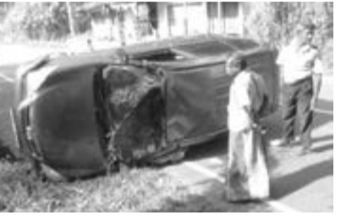
லொரியை இயக்கிய நிலையில் ஏற்பட்ட தூக்க மயக்கதின் காரணமாகவே இவ் விபத்து ஏற்பட்டதாக பொலிஸ் விசாரணையில் தெரியவந்துள்ளது. புல்திங்கள பொலிஸார் விபத்து பற்றிய மேலதிக விசாரணைகளை மேற்கொண்டு வருகின்றனர்.

புல்திங்கள பொலிஸ் பிரிவுக்கு உட்பட்ட கொபவக்க பகுதிகளில் நடுத்தர ஆடை தொழிற்சாலை ஒன்றுக்கு நூல் மற்றும் துணிவகைகளுடன் மாகம், தெல்பவத்தை ரோக்கி வீதியில் பயணித்துக் கொண்டிருந்த கார் ஒன்று வீதியை விட்டு விலகி நேற்று முன்தினம் (30) விபத்துக்குள்ளானது. இதில் சாரதி படுகாயமடைந்துள்ளார். மேற்படி வயது முதிர்ந்த லொரிச் சாரதி நேற்று காலை முதல் முழு நாள் கொழும்பு நகரில்