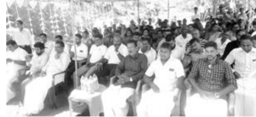
கலாசார நிகழ்ச்சிகளும் இடம்பெற்றன. கனத்தறை மாவட்டத்தில் பத்து வருடங்களுக்கு மேலாக அறநெறி பாடசாலைகளில் பணியாற்றிவரும் ஆசிரியர், ஆசிரியர்கள் மற்றும் பிரதேச தமிழ் சமூகத்தின்