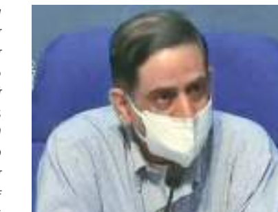
அமல்படுத்திய மிக தீவிர ஊரடங்கால் அத்தகைய பாதிப்பு ஏற்படாமல் தடுக்க முடிந்ததாக கூறிய

கையில், 'கொரோனா பாதிப்பை பொறுத்தவரை, நீங்கள் அமெரிக்கா அல்லது ஐரோப்பிய நாடுகளை பார்த்தால், அங்கேல்லாம் கொரோனா உச்சம் தொட்டு, பின்னர் குறைந்தது. அதுவும் தொற்று உச்சத்தில் இருந்தபோது டெயிள், இங்கிலாந்து, இத்தாலி போன்ற நாடுகளில் அதிக எண்ணிக்கையில் மரணங்கள் நிகழ்ந்தன. ஆனால் அதிர்ஷ்டவசமாக அந்த நாடுகளின் அனுபவங்களில் இருந்து நாம் பாடம் கற்றோம்' என்று கூறினார். மார்க், ஏப்ரல், மே மாதங்களில்