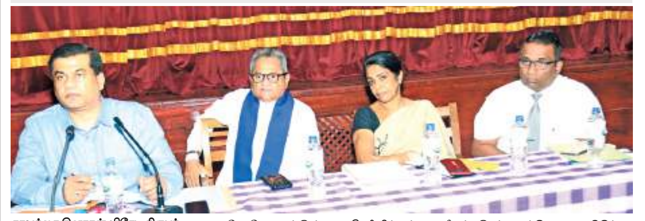
காவத்தை தினகரன் விசேட நிருபர்

இரத்தினபுரி மாவட்டத்தில் 6150 இலட்சம் ரூபா செலவில் 22 வைத்தியசாலைகள் அபிவிருத்தி செய்யப்படவுள்ளதாக சர்க்குமல மாகாண ஆளுநர் டிக்கிரி கொப்பேகடுவ தெரிவித்தார். வைத்தியசாலைகள் அபிவிருத்தி தொடர்பாக கடந்த திங்கட்கிழமை (14) இடம்பெற்ற கலந்துரையாடலின்