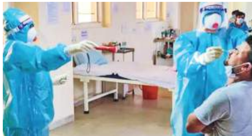
துள்ளது. கடந்த 24 மணி நேரத்தில் 90,123 பேருக்கு கொரோனா தொற்று உறுதி செய்யப்பட்டுள்ளது. 1,290 பேர் மரணம் அடைந்துள்ளனர். இதன்மூலம் கொரோனா வைரசால் உயிரிழந்தோர் எண்ணிக்கை 82,066 ஆக உயர்ந்துள்ளது. கொரோனா பாதிப்பில் இருந்து குணமடைந்தவர்களின் எண்

இந்தியாவில் கொரோனாவால் பாதிக்கப்பட்டோரின் மொத்த எண்ணிக்கை 50 இலட்சத்தை கடந்துள்ள நிலையில், உயிரிழந்தோர் எண்ணிக்கை 82,066 ஆக உயர்ந்துள்ளது. இந்தியாவில் கொரோனா வரைய வேகமாக பரவி வருகிறது. புதிய நோயாளிகள் மற்றும் மரணங்கள் நாளுக்கு நாள் அதிகரித்து வருகின்றன. பரிசோதனைகள் தொடர்ந்து அதிகரிக்கப்படும் நிலையில், பாதிப்பு எண்ணிக்கை தற்போது மிக அதிக அளவில் உள்ளது. தினசரி நோய்த்தொற்று ஒரு இலட்சத்தை எட்டி உள்ளது. அதேசமயம் குணமடைந்தவர்களின் எண்ணிக்கை கணிசமாக உயர்ந்து வருவது ஆறுதல் அளிப்பதாக உள்ளது. இந்தநிலையில், நேற்றுக் காலை மத்திய சுகாதாரத்துறை வெளியிட்ட தகவலின்படி இந்தியாவில் கொரோனாவால் பாதிக்கப்பட்டவர்களின் எண்ணிக்கை 50 இலட்சத்தை கடந்துள்ளது. மொத்த கொரோனா பாதிப்பு 50,20,360 ஆக உயர்ந்த