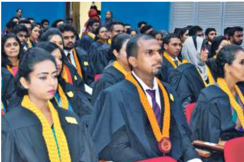
ஒலுவில் விசேட நிருபர்