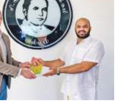
இதன்போது கனேடிய தூதரிடம் பாராளுமன்ற உறுப்பினர் கையளித்தார்.

ரத்தில் பின்தங்கியுள்ள குடும்பங்களுக்கான வாழ்வாதாரத்தை மேம்படுத்துவதற்குரிய நடவடிக்கை எடுக்கப்பட வேண்டும் என உள்ளிட்ட மூன்று கோரிக்கைகள் முன்வைக்கப்பட்டன. அத்துடன், பெண் தலைமை தாங்கும் பொருளாதாரத்தில் பின்தங்கியுள்ள குடும்பங்களுக்கான வாழ்வாதாரத்தை மேம்படுத்துதல், அவர்களுக்கான ஆலோசனைகளை பெற்றுக்கொள்வதற்கான திட்ட ஆவணங்களும்