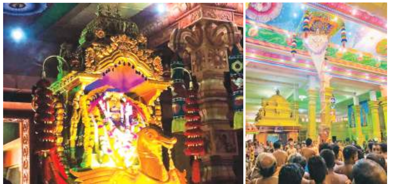
30ஆம் திகதி 15ஆம் திருவிழாவாக தேர்த் திருவிழா, ஒக்டோபர் முதலாம் திகதி சமுத்திரத் தீர்த்தத் திருவிழா மற்றும் ஒக்டோபர் 2ஆம் திகதி கேணித் தீர்த்தம் முற்பகல் 10

துன்னாலை வல்லிபுரம் ஆழ்வார் சுவாமி ஆலய வருடாந்தத் திருவிழா நேற்று முற்பகல் 9 மணிக்கு கொடியேற்றத்துடன் ஆரம்பமானது. தொடர்ந்து 17 நாட்கள் இடம்பெறும் திருவிழாவில் பகல் திருவிழா வசந்த மண்டபப் பூஜை, மாலைத் திருவிழா, வசந்த மண்டபப் பூஜை என்பன நடைபெறும். அதேவேளை எதிர்வரும் 23ஆம் திகதி 8ஆம் திருவிழாவாக குருக்கட்டு விநாயகர் தரிசனம், 24ஆம் திகதி 9ஆம் திருவிழாவாக வெண்ணைத் திருவிழா, 25ஆம் திகதி 10ஆம் திருவிழாவாக துகில் திருவிழா, 26ஆம் திகதி 11ஆம் திருவிழா பாம்புத் திருவிழா, 27ஆம் திகதி 12ஆம் திருவிழா வாக கம்சன் போர்த் திருவிழா, 28ஆம் திகதி 13ஆம் திருவிழா வாக வேட்டைத் திருவிழா, 29ஆம் திகதி 14ஆம் திருவிழாவாக சப்பரத் திருவிழா (இரவு 8 மணிக்கு)