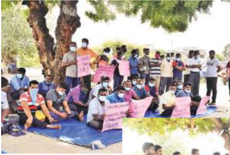
மன்னார் குழுப் நிருபர்

இலங்கை அரசு போக்குவரத்துச் சேவையின் மன்னார் சாலை பணியாளர்கள் பணி நிறுத்தத்தோடு கண்டன போராட்டமும் செய்தனர். நேற்று முன்தினம் இரவோடு இரவாக மன்னார் நகர சபை, இலங்கை போக்குவரத்து சபை பல் வண்டிகளை நிறுத்தும் இடத்தை மூடியதால் நேற்று காலை இ.போ.ச மன்னார் சாலை பணியாளர்கள் பணிப்புகிற்ப்பை மேற்கொண்டதோடு, மன்னார் பலர பகுதியில் கண்டன போராட்டம் ஒன்றையும் முன்னெடுத்தனர். மன்னாரில் இருந்து அரசு போக்குவரத்துச் சேவையினை மேற்கொள்ள