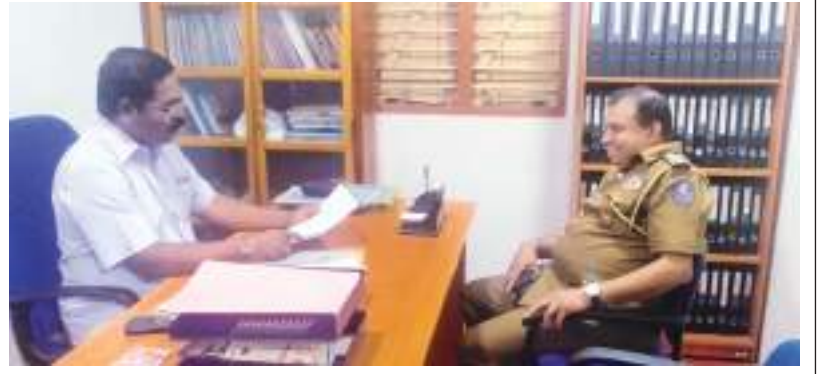
தியாகி திலீபனின் நினைவு வேந்தலுக்கு நீதிமன்றத்தால் விதிக்கப்பட்டுள்ள தடையத் தரவை கிளிநொச்சி பொலிஸ் நிலையத்தின் தலைமைப் பொலிஸ் பரிசோதகர் ஜீவகல்த பாராளுமன்ற உறுப்பினர் சிவஞானம் சிறிதரனிமீட நேற்று பகல் 11.30 மணியளவில் வழங்கிய போது.

கிளிநொச்சியில் அமைந்துள்ள தமிழ் தேசிய கூட்டமைப்பின் அலுவலகத்திலோ அல்லது ஏனைய பிரதேசங்களிலும் தியாகி திலீபனின் நினைவு நிகழ்வுகளை நடத்தக் கூடாது என தடை உத்தரவு கிளிநொச்சி மாவட்ட நீதவான் நீதிமன்றத்தினால் பிறப்பிக்கப்பட்டுள்ளது. தியாகி திலீபனின் நினைவு நிகழ்வு ஆரம்பமாகியுள்ள நிலையில் இந்த நிகழ்வுகளை நேற்று யாழ்ப்பாணத்தில் நடத்துவதற்கு நீதிமன்றத்தினால் தடை உத்தரவு பிறப்பிக்கப்பட்டுள்ளது இதேபோன்று நேற்று கிளிநொச்சியில் அமைந்துள்ள தமிழ் தேசிய கூட்டமைப்பு மாவட்ட அலுவலகமான அறிவகத்திற்கு வருகை தந்த கிளிநொச்சி பொலிஸ் நிலையத்தின் தலைமைப் பொலிஸ் நிலைய பொறுப்பதிகாரி பாராளுமன்ற உறுப்பினர் சிவஞானம் சிறிதரனி