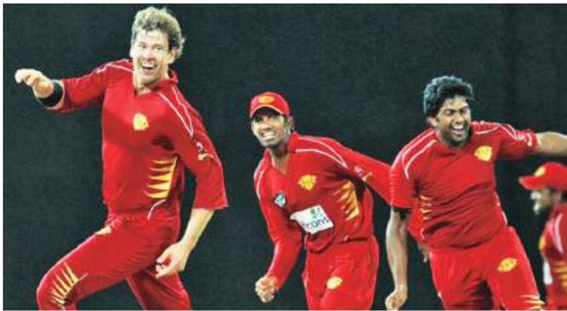
நடைபெறமாட்டாது என அறிவிக்கப்பட்டுள்ளது. IPG குழுமம் என்பன உத்தியோகபூர்வமாக அணியின் உரிமையாளர்கள் மற்றும் அணியின் பெயர்களை அறிவிக்கவில்லை என்பது குறிப்பிடத்தக்கது.

இலங்கையின் கிரிக்கெட் ரசிகர்கள் மிக ஆவலுடன் எதிர்பார்த்துக் காத்திருந்த லங்கா ப்ரீமியர் லீக் கிரிக்கெட் தொடரின் போட்டி அட்டவணை மற்றும் தொடரில் பங்கேற்கும் அணிகளின் பெயர்கள் வெளியிடப்பட்டுள்ளன. நவம்பர் 14ம் திகதி லங்கா ப்ரீமியர் லீக் தொடர் ஹம்பாந்தோட்டை சூரியவெவ மைதானத்தில் ஆரம்பிக்கவுள்ளதுடன், நொக்கவுட்டில் போட்டிகள் மற்றும் இறுதிப் போட்டி என்பன பல்வேகலையில் நடைபெறவுள்ளன. இதற்கிடையில் குழுநிலை போட்டிகள் சூரியவெவ, பல்வேகலை ஆகிய மைதானங்களில் நடைபெற்று, இறுதிக்கட்ட குழுநிலை போட்டிகள் தம்புள்ளை ரங்கிரி சர்வதேச கிரிக்கெட் மைதானத்தில் நடைபெறவுள்ளன. லங்கா ப்ரீமியர் லீக் தொடரின் ஆரம்ப நிகழ்வு 14ம் திகதி ஹம்பாந்தோட்டை சூரியவெவ மைதானத்தில் 5 அணிகளின் பங்கேற்புக்கு மத்தியில் நடைபெறவுள்ளது. இதில், கொழும்பு லயன்ஸ், தம்புள்ளை ஹோகல், காலி க்ளோடியேட்டர்ஸ், யாழ்ப்பாணம் கோப்ரால் மற்றும் கண்டி டல்கர்ஸ் என அணிகள் பெயரிடப்பட்டுள்ளன. முக்கியமாக லங்கா ப்ரீமியர் லீக் தொடரானது இலங்கையில் மிகவும் புகழ்பெற்ற மைதானமான ஆர்.பி.ரேமோதல சர்வதேச கிரிக்கெட் மைதானத்தின் புனமைப்பு பணிகள் காரணமாக போட்டிகள் அங்கு