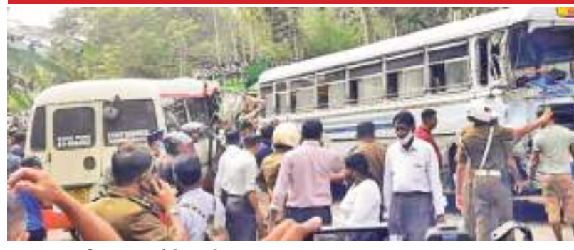
காவத்தை தினகரன் விசேட நிருபர்

18 பேர் காயம், 4 பேர் அவசரசிகிச்சை பிரிவில்