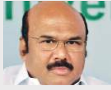
வக்கு பயந்து 100 நாட்கள் உள்ளே இருந்தார் கமல்ஹாசன். அறிக்கை மூலம் மட்டுமே பேசும் கமல்ஹாசன் அடுத்த பிக்பாஸ்க்கு தயாராகி விட்டார்.