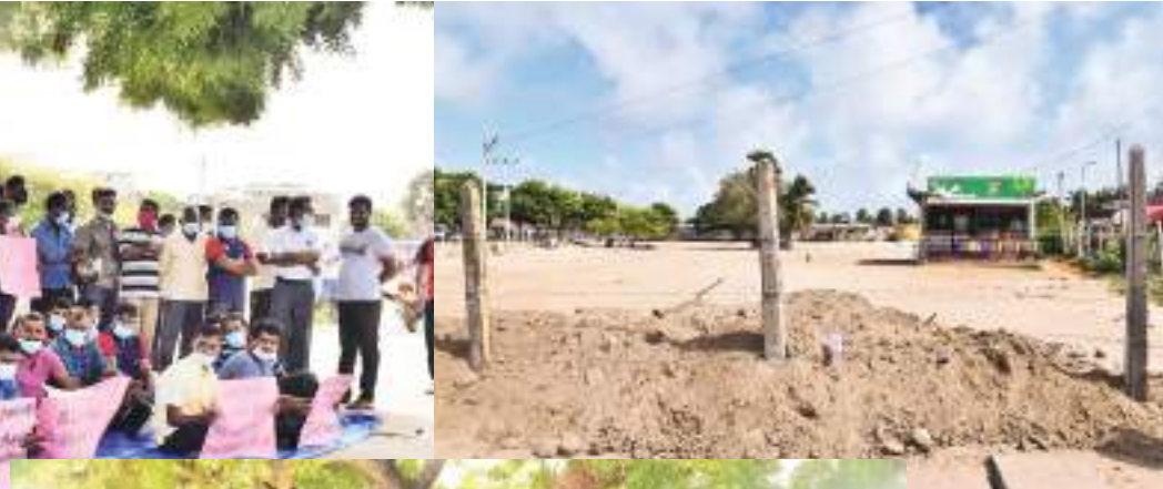
மன்னார் நகர சபையினால் தற்காலிக இடம் வழங்கப்பட்டிருந்தது.

இலங்கை அரசு போக்குவரத்துச் சேவையின் மன்னார் சாலை பணியாளர்கள் பணி நிறுத்தத்தோடு கண்டன போராட்டமும் செய்தனர். நேற்று முன்தினம் இரவோடு இரவாக மன்னார் நகர சபை, இலங்கை போக்குவரத்து சபை பல் வண்டிகளை நிறுத்தும் இடத்தை மூடியதால் நேற்று காலை இ.போ.ச மன்னார் சாலை பணியாளர்கள் பணிப்புகிற்ப்பை மேற்கொண்டதோடு, மன்னார் பலர பகுதியில் கண்டன போராட்டம் ஒன்றையும் முன்னெடுத்தனர். மன்னாரில் இருந்து அரசு போக்குவரத்துச் சேவையினை மேற்கொள்ள