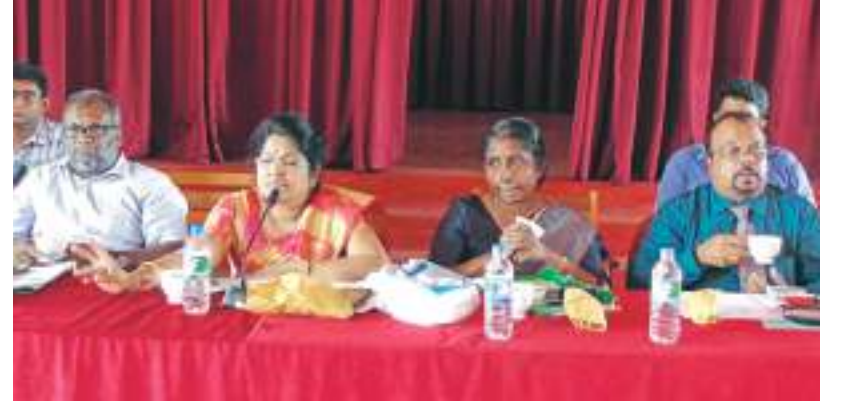
மட்டக்களப்பு சுழற்சி நிருபர்