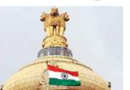
மகாராஷ்டிரா, கர்நாடகா, ஆந்திரா, உத்தரபிரதேச மாநிலங்களில் சராசரியாக 50 ஆயிரத்துக்கும் அதிகமானோர் கொரோனாவால் பாதிக்கப்பட்டுள்ளனர் 18 மாநிலங்களில் 5 ஆயிரம் முதல் 50 ஆயிரம் பேருக்கு கொரோனா பாதிப்புகள் உள்ளது. 14 மாநிலங்களில் சராசரியாக 5 ஆயிரம் பேருக்கு பாதிப்பு உள்ளது. மகாராஷ்டிரா, உத்தரபிரதேசம், கர்நாடகா மாநிலங்களில் இறப்பு எண்ணிக்கை அதிகமாக உள்ளது. தமிழ்நாட்டில் தினசரி பாதிப்பு படிப்படியாக குறைந்து வருகிறது.

மத்திய அரசு வற்புறுத்தி வருகிறது. இதையடுத்து உத்தரபிரதேசத்திலும் கொரோனா பாதிப்பு அதிகம் இருப்பது தெரிய வந்துள்ளது. தமிழ்நாட்டில் அதிக எண்ணிக்கையில் சோதனைகள் நடத்தப்பட்டன. தற்போது தமிழ்நாட்டில் கொரோனா பாதிப்பு குறைந்து வருவதாக மத்திய அரசு தெரிவித்துள்ளது. இந்தியா முழுவதும் 5.8 கோடி சோதனைகள் நடந்துள்ளது. இதில் 50 லட்சம் பேருக்கு கொரோனா பாதிப்பு இருந்து கண்டு பிடிக்கப்பட்டது. இதுவரை 81 ஆயிரத்து 331 பேர் கொரோனாவால் மரணம் அடைந்துள்ளனர். மகாராஷ்டிரா, கர்நாடகா, ஆந்திரா, உத்தர பிரதேசம், தமிழ்நாடு ஆகிய மாநிலங்களில்தான் இந்தியாவின் மொத்த கொரோனா பாதிப்பில் 60 சதவீதம் பேர் உள்ளனர்.