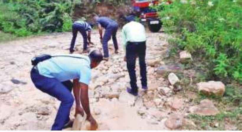
ஊவா சுழற்சி நிருபர்

கற்களை தற்காலிகமாக நிரப்பியே பயணத்தை மேற்கொள்ள வேண்டிய அவலநிலை