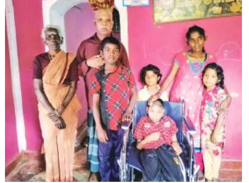
"பதுளை தோழமை கப்பல்" அமைப்பின் ஏற்பாட்டில் மாற்றுத்திறனாளி ஏழைச் சிறுவனொருவனுக்கு பெறுமதி மிக்க "சக்கர நாற்காலி"யொன்று அன்பளிப்பாக வழங்கி வைக்கப்பட்டுள்ளது. இந் நிகழ்வு "பெரன்ட்லிஷிப்" அமைப்பின் குழுவினரின் பங்களிப்பில் புகழ்பெற்ற - மலங்குமுவனில் வசிக்கும் சிறுவனின் இல்லத்தில் நேற்று முன்தினம் நடைபெற்றது. இதன்போது எடுக்கப்பட்ட படத்தை இங்கு காணவும்.

தற்காலிகமாக நிரப்பியே பயணத்தை மேற்கொள்கின்றனர். அதேவேளை பாதை கரடு முரடாகவுள்ளதால் சிலசமயங்களில் தமது பயணத்தை தொடர முடியாமல் பல மணி நேரம் வீதியில் கழிப்பதாகவும் மக்கள் தெரிவிக்கின்றனர். எனவே தமது இந்த துர்ப்பாக்கிய நிலைமைக்கு உடனடியாக தீர்வினை பெற்றுத்தருமாறு மக்கள் கோரிக்கை விடுகின்றனர்.