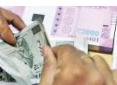
மீதி தவணைத்தொகைகளை முன் கூட்டியே கொடுக்கும் திட்டமோ, நிதியை உயர்த்தும் திட்டமோ இல்லை என்றும் அவர் கூறினார். இந்திட்டுத்தல், தமிழ்நாட்டில் போலி பயனாளிகள் சேர்க்கப்பட்டது கண்டுபிடிக்கப்பட்டு இருப்பதாகவும், ரூ.47 கோடி மீட்கப்பட்டுள்ளதாகவும் நரேந்திரசிங் தோமர் தெரிவித்தார். தகுதியான பயனாளிகளை அடையாளம் காண்பது மாநில அரசுகளில் பொறுப்பு என்றும் அவர் தெளிவுப

நன்கொடை பெற்றுள்ளதாக மத்திய உள்துறை இணை மந்திரி நிதியாந்தர் ராய் மக்களவையில் தெரிவித்தார். கொரோனாவுக்கு இதுவரை 100 துணை இராணுவப்படை மினர் பலியாகி இருப்பதாக மத்திய உள்துறை இணை மந்திரி நிதியாந்தர் ராய் மக்களவையில் தெரிவித்தார். கொரோனாவுக்கு பலியான மாநில பொலிசார் பற்றிய தகவல்கள், மத்திய அரசால் பராமரிக்கப்படவில்லை என்றும் அவர் கூறினார். பிரதமர் விவசாயிகள் நிதி உதவி திட்டத்தில், கடந்த ஏப்ரல் முதல் ஆகஸ்ட் மாதம் வரை, விவசாயிகளின் வங்கி கணக்குகளில் ரூ.38 ஆயிரத்து 282 கோடி செலுத்தப்பட்டுள்ளதாக மத்திய வேளாண்மை அமைச்சர் நரேந்திரசிங் தோமர் மக்களவையில் கூறினார்.