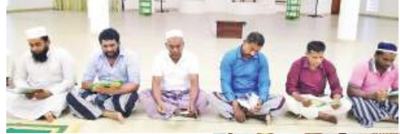
ஒலுவில் கிழக்கு தினகரன் நிருபர்