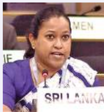
பாராளுமன்றத்தில் சமர்ப்பிக்கப்பட்டவுள்ள 20ஆவது திருத்தச் சட்டம் முழுமையான ஜனநாயக முறையைப் பின்பற்றி கலந்து

ஐ. நா. மனித உரிமை பேரவையில் இலங்கை அறிவிப்பு