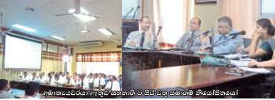
අමාත්‍යවරයා ඇතුළුව සහභාගි වී සිටි වතු සමාගම් නියෝජිතයෝ

සමාගම් වතු ප්‍රතිසංස්කරණ, තේවතු ආශ්‍රිත බෝග, තේ කට්ටානිත කාලා නවීකරණ හා තේ අපනයන බෝග ප්‍රවර්ධන රාජ්‍ය අමාත්‍යාංශයක තේරුම් ගන්නා ලද ප්‍රධානීන්ගේ සාමාන්‍ය වශයෙන් කැඟලි දැක්වීමකදී වතු සමාගම්වල පාලන අධිකාරියේ සහභාගිත්වයෙන් පසුගියදා කැඟලි දැක්වීමක් කාර්යාලයේ දී වතු සමාගම් හා අමාත්‍යවරයා අතර සාකච්ඡාවක් පැවැත්විණි. එහිදී වතු ජනතාවගේ නිවාස ප්‍රශ්නය හා වතු සමාගම්වල කටු-පොල් වගාව සිදු කිරීම යන මූලික කරුණු සාකච්ඡා කෙරිණි. වතු පාලන අධිකාරිය විසින් කියා සිටියේ පේළි නිවාස වෙනුවට වෙනත් වැඩසිටුවෙකට යාමට