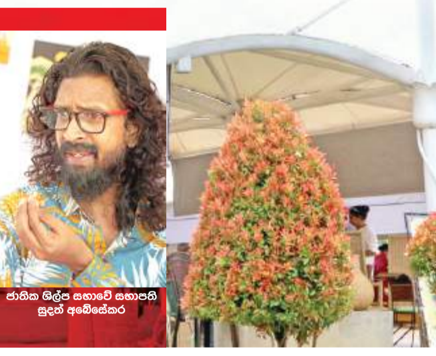
ජාතික ශිල්ප සභාවේ සභාපති සුදන් අබේසේකර

ඒ අපේ අතිතව සුඛ නිමිත්තයි. මෙතැන් පටන් දිවයින පුරා විවිධ විසිරී සිටින සාම්ප්‍රදායික අත්කම් නිර්මාණකරුවන් රැසක් ඒ නිර්මාණ ද රැගෙන දිගට උයනට පැමිණේ. ඒ සොබාදහමෙන් පලා ගත් ස්වභාවිකත්වයේ ඉණ සුවිදාදට පරිසරයෙන් සපයා ගත් වර්ණ, හැඩතල සහ සොබාවක සුවිදා මුසු කරමිනි. ඒ අපුර්වත්වය කොළොම්නොටට කැන්දාගෙන එන්නෝ රැසකි. අපේ මේ සුදානම මුදුන්ගෙන් ඇතමෙක් ඔබට හඳුන්වා දෙන්නටය. සාම්ප්‍රදායික හස්ත කර්මාන්ත නිර්මාණකරුවන් පණ සේ සලකා ඇප කැප වී නිර්මාණය කරන ස්වභාවික නිෂ්පාදනවල රූව ඉණ කියා පාන්නටය.