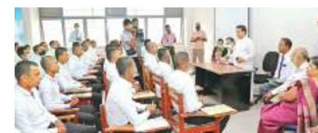
ඇමැති නිමල් සිරිපාල ද සිල්වා මහතා පුහුණුව ලබන පිරිසක් සමඟ කතා කළ අයුරු

කාන්තාවන් ගාස්පේවිකාවන් ලෙස රැකියාවලට විදේශගත කිරීමට පෞද්ගලිකව තමා විරුද්ධ බවත්, ඔවුන්ට ගෞරවාන්විත රැකියා ලබා දීම රජයේ අරමුණ බවත්, කමිකර ඇමැති නිමල් සිරිපාල ද සිල්වා මහතා ප්‍රකාශ කරයි. ඒ අනුව, ඉහළ වැටුප් සහිත රැකියා සඳහා කාන්තාවන් මෙන්ම පිරිමි ශ්‍රමිකයන් යොමු කිරීමට ජාතික වැඩපිළිවෙළක් සකස් කරන බව තෙහෙට් සඳහන් කළේය. ඒ මහතා මේ බව සඳහන් කළේ, ඉකුත්දා (13) ශ්‍රී ලංකා විදේශ සේවා නියුක්ති කාර්යාලයේ හාලිඇල පිහිටි ජපන් රැකියා පුහුණු මධ්‍යස්ථානයේ නිරීක්ෂණ වාර්තාවකට එක්වෙමිනි. මේ අවස්ථාවට ජපන් රැකියා වැඩසටහනේ සම්බන්ධී-