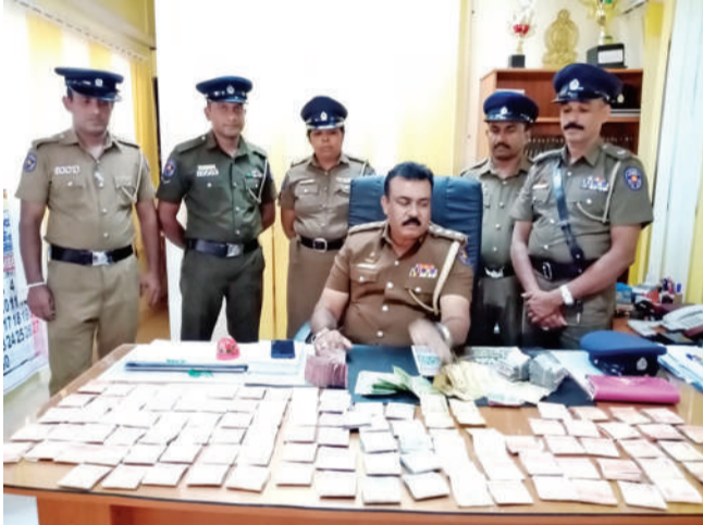
ඇතුළු වී අල්මාර්ගේ කිබු රුපියල් ලක්ෂ හයහමාරක මුදල රැගෙන නැවත ත්‍රිවිල් රථයෙන්ම තම නිවෙසට ගොස් නිවෙසේ මුළුතැන්ගෙඩි පොරොත්තු වූ පවුලේ භාර වල දඹා මුදල් දඹා තිබූ පරස් එක ඇළකට විසි

ව්‍යාපාරිකයන්ගේ නිවෙස් අලුත්වැඩිපාටකට ගිය මේසන් බාස් කෙනෙකු පසු දින පැමිණි දොර කඩා නිවෙසට ඇතුළු වී රුපියල් ලක්ෂ හයහමාරක මුදලක් සොරාගෙන ගොස් පැය විඩි හතරක් ගත වීමට පෙර සැකකරු සහ මුදල් (19) දින පස්වරුදීමේදී අන්අඩංගුවට ගැනීමට පොලොන්නරුව පොලීසිය සමත් වී ඇත.