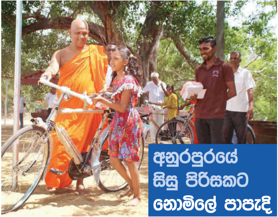
අනුරාධපුරයේ සිසු පිරිසකට හොම්ලේ ආසැදි