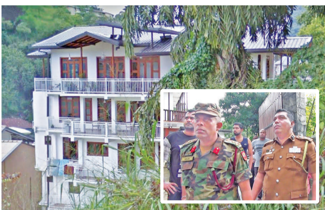
කඩා වැටුණු මහල් පහතින් සමන්විත නිවස