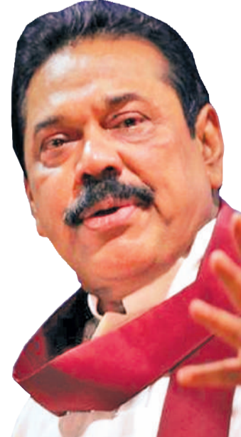
ආයතනික ඉහළ නැංවීමට අප රජයක් ලෙස කටයුතු සැලසුම් කර ඇති බව මෙවර සංචාරක දිනයේදී ප්‍රකාශ කිරීමට කැමැත්තේ.

මෙන්ම සොබාව සෞන්දර්යය පවතින අපූර්වත්වය සුවසසක් ලෝකවාසී සංචාරකයන් ශී ලංකාවට ඇදී එමට ප්‍රමුඛතම සාධකයකි. සොබාව සෞන්දර්යය මෙන්ම ආගන්තුක සන්තකයෙන් අනුනර්ථයක් ලෙස අපට ලොව හමුවේ ඇත්තේ සාඩ්මර අභිමානයකි. වත්මන් ලෝකය දෙස බලන විට ලෝක ආර්ථිකයට සාදුරු බලපෑමක්