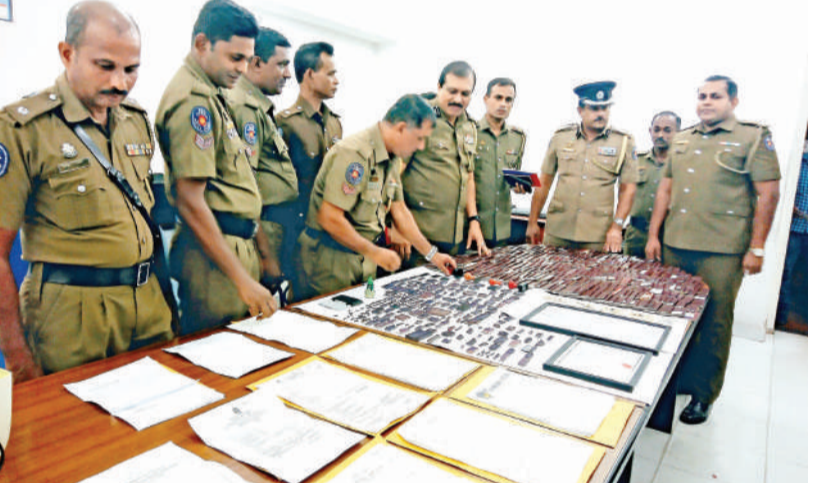
වරු ප්‍රාදේශීය ලේකම් විවෘත රෝස්ටරුවක් මුද්‍රණය කිරීමට අදාළ ලිපිලේඛයක් පරික්ෂා කිරීමට අදාළ ආරක්ෂක නිලධාරීන්.

සහතිකපත් ව්‍යාප්ත අන්දමින් මුද්‍රණය කිරීමට යොදාගන්නා මුද්‍රණ යන්ත්‍රයක් ඇතුළු භාණ්ඩ සමඟ බලපත්‍ර නොමැතිව පවත්වාගෙන ගිය ව්‍යාප්ත මුද්‍රණාලයක් වැරදි කාලයේ කොට්ඨාස අපරාධ විමර්ශන කාර්යාංශය එම ස්ථානයේ සිටි එක් සැකකරුවකු අත් අඩංගුවට ගෙන ඇත.