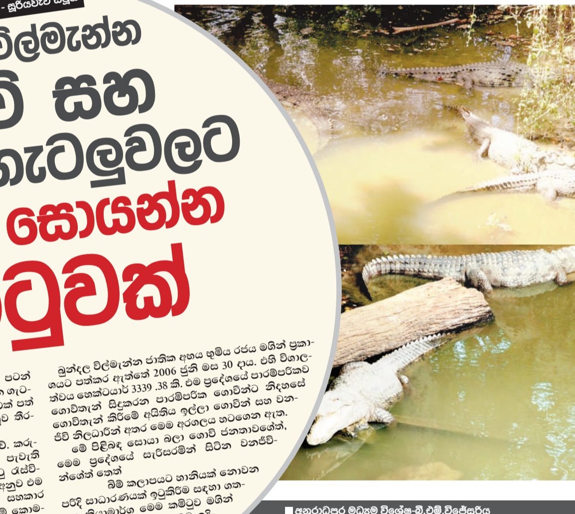
■ විශේෂ රුසුල් පිල්ලාර ගමේ - උතුරු පළාත්

මෙහිදී ආණ්ඩුකාරවරයා කියා සිටියේ වෙරළබඩ කලාපය වඩාත්ම ආර්ථික වශයෙන් වටිනාකමක් ඇති බවට සලකන සේකයයි එහි සුන්දරත්වය හා පිරිසිදුකම සම්බන්ධයෙන් මෙහි ජීවත්වන සෑම පුද්ගලයෙක්ම තුළම හැඟීමක් තිබිය යුතු බවයි.