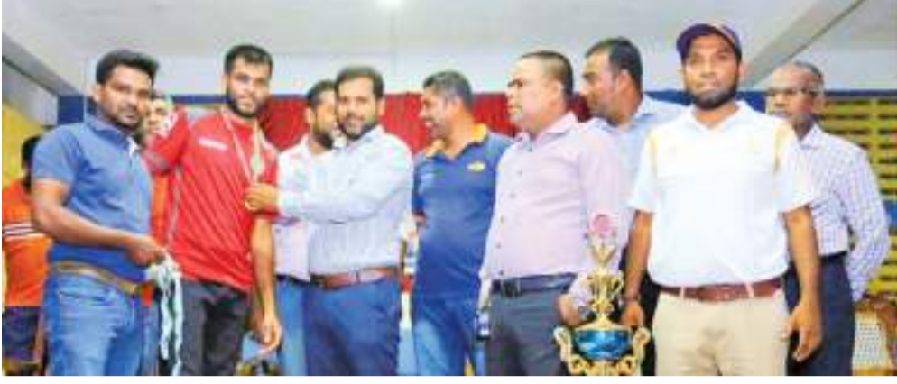
(கல்முனை சுழற்சி நிருபர்)

கல்முனை பிரிவியன்ட் விளையாட்டுக்கழகம் வெற்றி