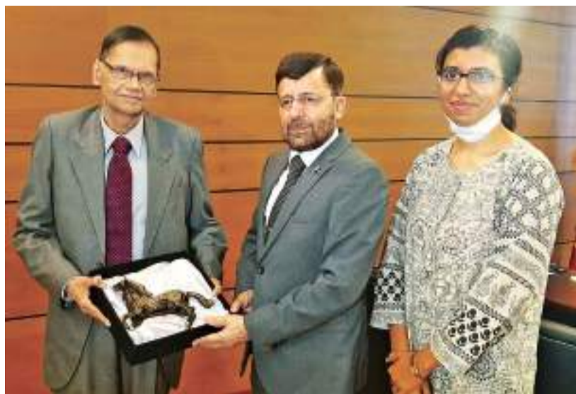
பாதிஸ்தான் உயர்ஸ்தானிகர் மேஜர் ஜெனரல் (ஓய்வு பெற்ற) முஹம்மது சாத் கட்டாக், கல்வி அமைச்சர், பேராசிரியர் ஜி. எஸ். பீரிஸை (28) அவரது அலுவலகத்தில் சந்தித்துக் கலந்துரையாடினார். இச்சந்திப்பின் போது, இரு நாடுகளுக்கிடையிலான கல்வித்துறை சார் ஒத்துழைப்பு மற்றும் பொதுவான பல விடயங்கள் கலந்துரையாடப்பட்டன. உயர் மற்றும் தொழில்நுட்பக் கல்வியின் பல்வேறு துறைகளில் இருதரப்பு ஒத்துழைப்பை மேலும் வலுப்படுத்துவதன் அவசியத்தை அமைச்சர் மற்றும் உயர்ஸ்தானிகர் இருவரும் சுட்டிக்காட்டினர்.