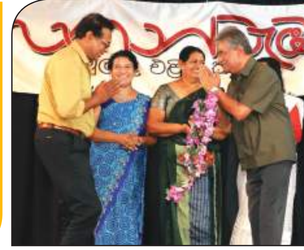
රත්න ශ්‍රී උපහාර