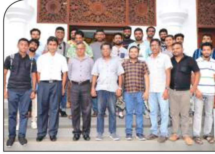
ජායාරූප වැඩමුළුවේ පිරිස