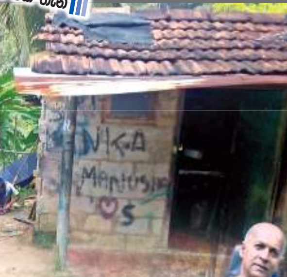
මහානාම විතානගේ - මල්වාන සමුහ