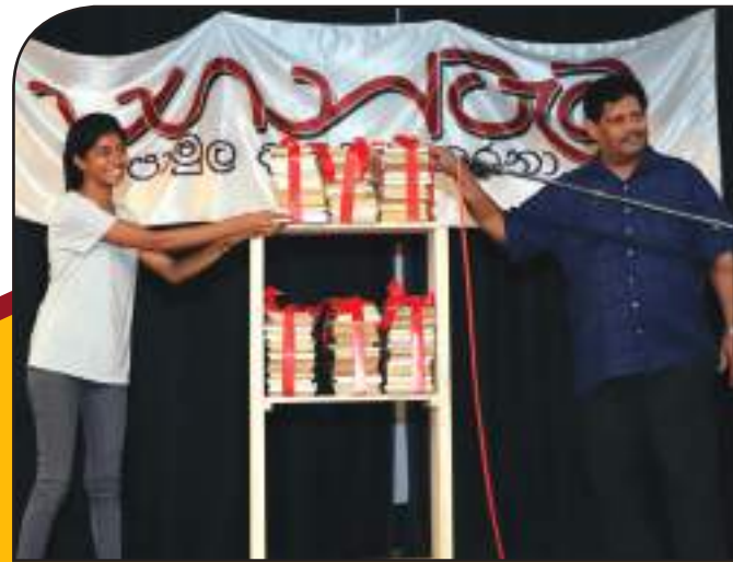
ජයග්‍රාහකයන්ට පොත් සහ පොත් රාක්ක