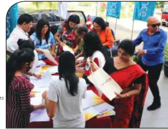
පහන්ටැම් සාමූහිකය වෙනුවෙන් ලියාපදිංචිය