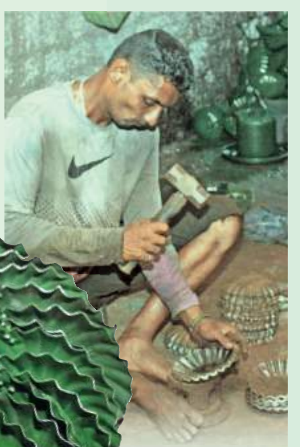
බොහෝ නිවෙස් තුළ මෙන්ම ආයතන, කඩ සාප්පු ආදී බොහෝ ස්ථානවලට නැතිවම බැරි දෙයක් තමයි දුම් කබල. උදේට කහ දියර ඉහලා දුම් අල්ලලා තමයි බොහෝ ව්‍යාපාරිකයන් තමන්ගේ ව්‍යාපාර කටයුතු අරඹන්නේ. ශ්‍රී ලංකාව දැන් නව තාක්ෂණය අතින් ඉතා ඉහල මට්ටමක සිටිනවා. නමුත් මේ මිනිසුන් පරිසරයෙන් සොයා ගත් ආම්පන්න කිහිපයකින් ඉතා දුක සේ මෙම දුම් කබල් රස්සාව කරගෙන යනවා.