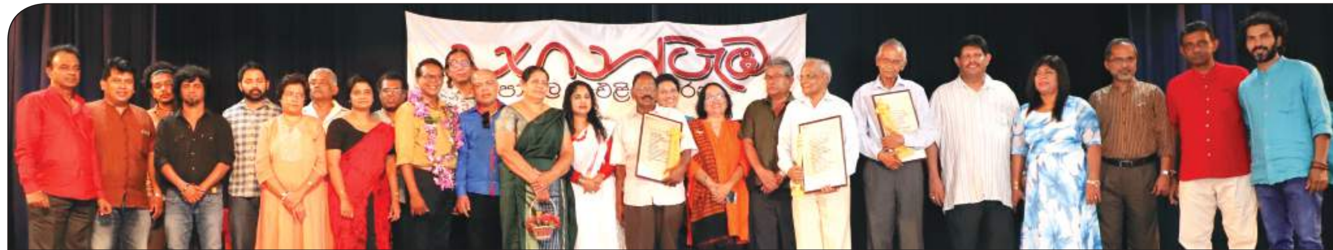
ආරාධිතයින්, සංවිධායකයින් සහ ගෞරව සම්මානලාභීන්