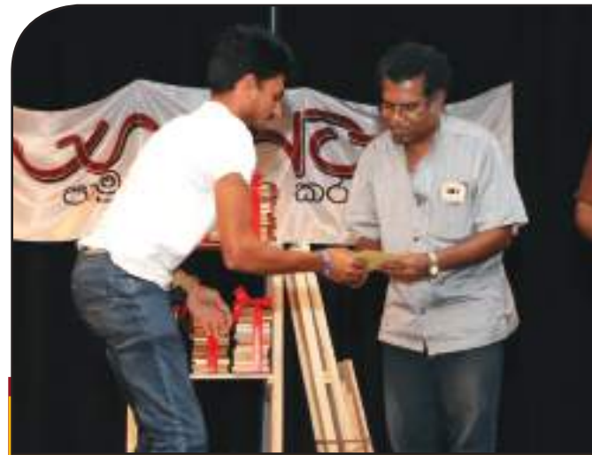
ජායාරූප වැඩමුළුවේ සහතිකපත් ප්‍රදානය