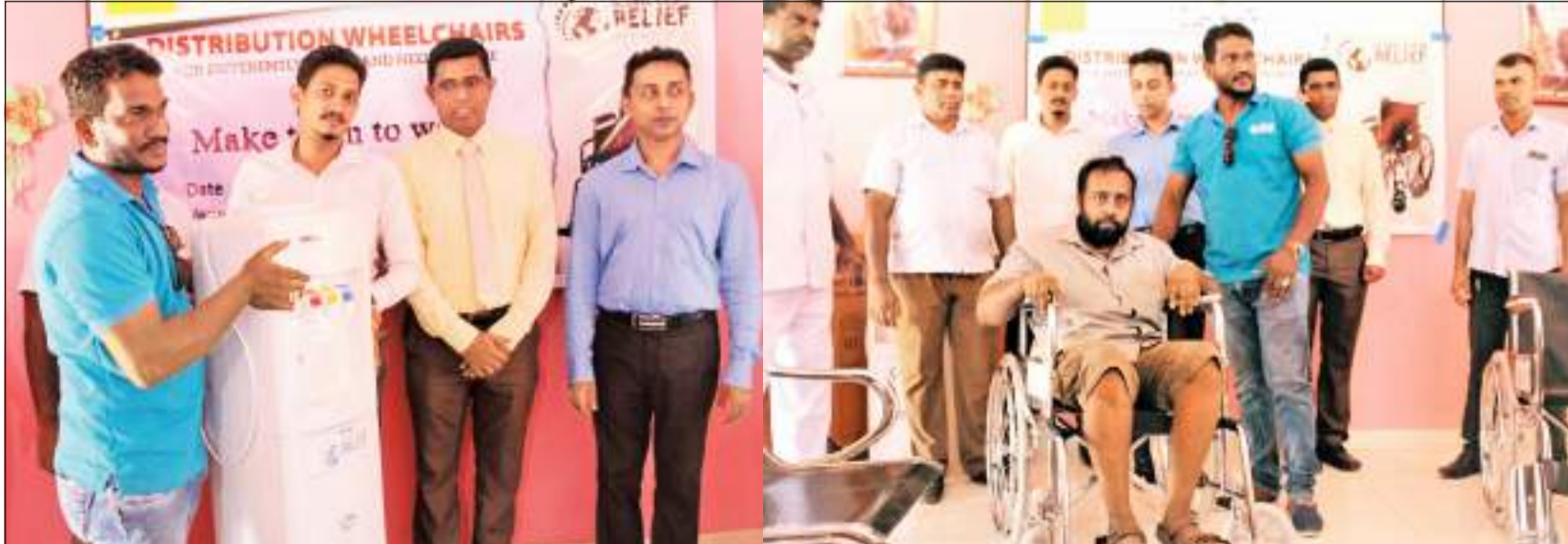
தம்பலகாமம் வைத்திய சாலைக்கு இலங்கை குளோப் இஹ்ரான் ரிஸ்ட் நிறுவனத்தினால் சக்கர நாற்கலி மற்றும் நீர் சுத்திகரிப்பு கியந்திரம் என்பன நேற்றுமுன்தினம் (05) வழங்கப்பட்டன. இந்நிகழ்விற்கு இலங்கை குளோப் இஹ்ரான் ரிஸ்ட் நிறுவனத்தின் பணிப்பாளர் சபை மற்றும் ஊழியர்கள் உட்பட பலர் கலந்து கொண்டனர்.

வீதியில் பயணித்த கார் மோட்டார் சைக்கிளில் மோதியதால் பலத்த காயங்களுக்கு உள்ளான நிலையில், மட்டக்களப்பு போதனை வைத்திய சாலையில் அனுமதித்து சிகிச்சை பலனின்றி உயிரிழந்துள்ளார். சம்பவ இடத்திற்கு சென்ற மன்னூர் பிரதேச திடீர் மரண விசாரணை அதிகாரி பிரதேசத்தை பார்வையிட்ட பின்னர் பிரதேச பரிசோதனைக்குட்படுத்தும் படி உத்தரவிட்டுள்ளார்.