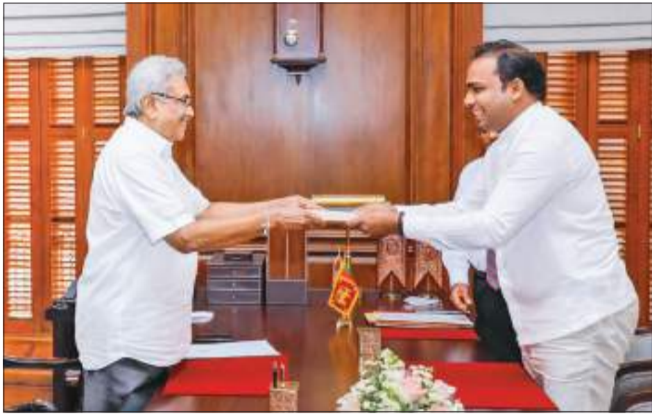
தபால் சேவைகள் மற்றும் வெகுசன ஊடக, தொழில் அபிவிருத்தி இராஜாங்க அமைச்சர் சதாசிவம் விபாழேந்திரன், பின்தங்கிய கிராமிய பிரதேச அபிவிருத்தி மற்றும் மனைசார் கால்நடை பராமரிப்பு மற்றும் சிறு வந்தக பயிற்சி செய்கை மேம்பாட்டு இராஜாங்க அமைச்சரகவும் நேற்று (06) ஜனாதிபதி அலுவலகத்தில், ஜனாதிபதி கோட்பாபய ராஜபக்சே முன்னிலையில் பதவிப்பிரமாணம் செய்து கொண்ட போது...