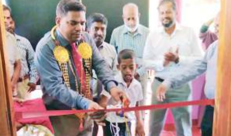
பிக்கின்ற வாரமாக இருக்கின்றது. அடுத்து மருதமுனையில் விசேட தேவையுடையவர்களுக்கான நிலையம் ஒன்று இயங்கி மாணவர்களுக்கான வளப்படுத்தல் செயற்பாட்டினை ஆற்றுதல் என்பது ஒரு முக்கிய செயற்பாடாக பார்க்கப்பட வேண்டி உள்ளது.

மருதமுனை ஹியூமன்லிவ்ஸ் நிறுவனத்தின் வளாகத்தில் 20 இலட்சம் ரூபா செலவில் விசேட தேவையுடையவர்களுக்கான சுகாதார பராமரிப்பு நிலையம் திறந்து வைக்கும் நிகழ்வு அண்மையில் நடைபெற்றது. நிகழ்வில் பிரதம அதிதியாக கலந்து கொண்ட அம்பாறை மாவட்ட மேலதிக அரசாங்க அதிபர் உரையாற்றும் போது, எமது சமூகத்தின் ஒரு அடித்தளமாக விசேட தேவையுடையோர் காணப்படுகின்றார்கள். அவர்களை வளப்படுத்துவது நமது இன்றியமையாத கடமையாகும். இரண்டு விடயங்கள் நான் குறிப்பிட வேண்டும். ஒன்று இந்த வாரம் என்பது சிறுவர்கள் மற்றும் முதியவர்களை சிறப்ப