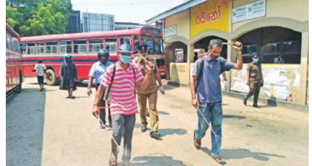
யாழ்ப்பாண மத்திய பேருந்து நிலையத்தில் கிடுமித் தொற்று நீக்கும் நடவடிக்கையில் சுகாதாரப் பிரிவினர் ஈடுபட்டிருந்த போது...

இங்கு மேலும் கூறுகையில், புதிய அரசாங்கம் புதிய தொரு அரசியலமைப்பை நிறைவேற்றுவதற்கு சிந்தித்துக் கொண்டிருக்கின்றனர். புதிய அரசியலமைப்பினை நிறைவேற்ற முன்னர் அவசரமாக அரசியலமைப்பிற்கு திருத்தம் ஒன்றினை ஏற்படுத்தும் நோக்கோடு 20ஆவது திருத்தம் என்ற பெயரிலே ஒருசில திருத்தங்களை இந்த அரசியலமைப்பிற்கு கொண்டுவர உத்தேசித்திருக்கிறார்கள். இந்த அரசியலமைப்பு ஒன்றையாட்சி அரசியலமைப்பு, தமிழ் மக்களாகிய நாம் கடந்த 72ஆண்டுகளாக ஒன்றையாட்சி அரசியலமைப்பினை நிராகரித்து வருகிறோம். ஏனென்றால் ஒன்றையாட்சி அரசியலமைப்பில் சிங்கள பெளத்த மக்களுக்கு மட்டும் தான் இடம் இருக்கிறது. எண்ணிக்கையில் சிறியவர்களாக இருக்கும் தமிழர்களை மட்டுமல்ல சிங்கள தேசத்திற்கு உள்ளேயே பெரும்பான்மை இருக்கும் வகையில் ஏனையவர்களுடைய கருத்தை கருத்திலேயே எடுக்காமல் ஆட்சி செய்யக்கூடிய ஒரு மோசமான ஒரு அரசியலமைப்பு பாகத் தான் இந்த ஒன்றையாட்சி அரசியலமைப்பின் விதிமுறைகள் அமைந்துள்ளன என்றார்.