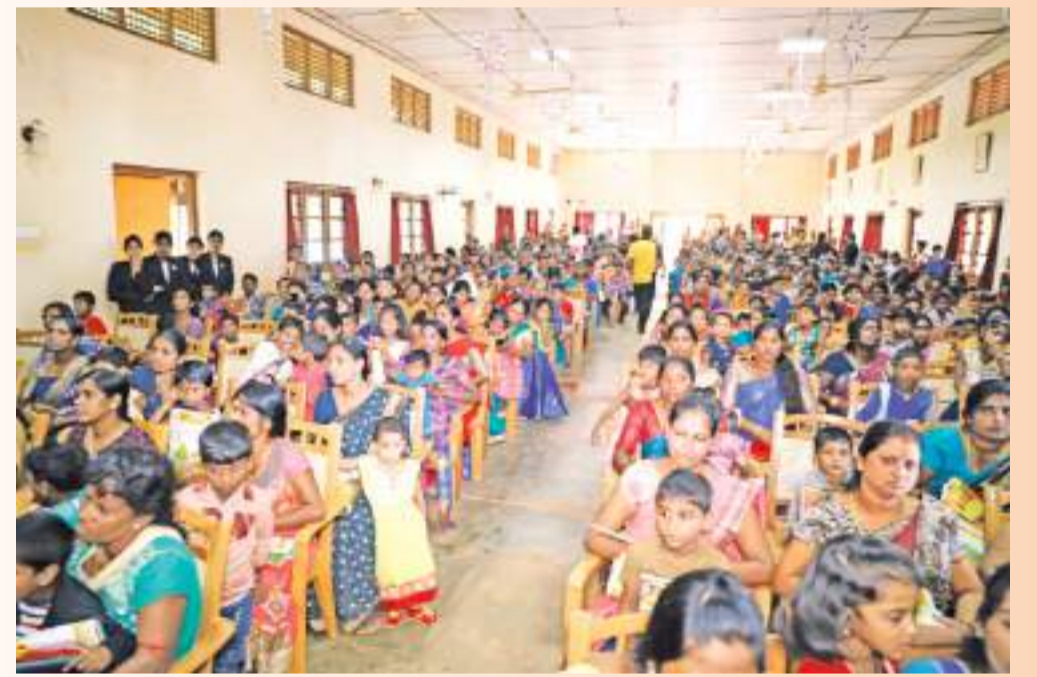
சர்வதேச சிறுவர் தினத்தை முன்னிட்டு லேக்ஹவுஸ் நிறுவனம் ஏற்பாடு செய்திருந்த சிறுவர் தின நிகழ்வும் சிறுவர்களுக்கான வெளியிடான 'குட்டி சுட்டி' அறிமுக விழாவும் யாழ்.இராமநாதன் மகளிர் கல்லூரியில் ஓக்டோபர் 02ஆம் திகதி நடைபெற்ற போது...