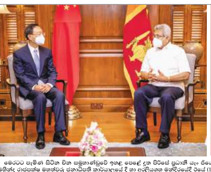
මෙරටට පැමිණ සිටින චිත සමූහාණ්ඩුවේ ඉහළ පෙළේ දැන පිරිසේ ප්‍රධානි යෑං ජියෙචි මහතා ජනාධිපති ගෝඨාභය රාජපක්ෂ සහ අගමැති මහින්ද රාජපක්ෂ මහත්වරු ජනාධිපති කාර්යාලයේ දී හා අරලියගහ මන්දිරයේදී රජයේ (10) හමු වූ අයුරු.

මිනුවන්ගොඩ පොකුරේ කොවිඩ් ආසාදිතයෝ 1069ක් 8,000ක් නිරෝධායනයට