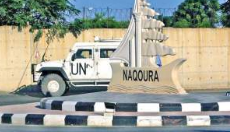
தாக லெபனான் பாதுகாப்பு வட்டாரம் லெபனான் மற்றும் இஸ்ரேலுக்கு இடையே எல்லைகள் தொடர்பில் உடன்பாடு ஒன்று எட்டப்படவில்லை என்பது குறிப்பிடத்தக்கது. 1948-49 இஸ்ரேல்-அரபு யுத்தம் தொடக்கம் போர் சூழலில் இருக்கும்

தொடர்ந்து போர் சூழலில் இருக்கும் இஸ்ரேல் மற்றும் லெபனான் நீண்ட காலமாக நீடிக்கும் கடல் எல்லை பிரச்சினைக்கு தீர்வு காண்பதற்கு முதல் சுற்று பேச்சுவார்த்தையை நடத்தியுள்ளது. அமெரிக்காவின் மத்தியஸ்தத்தில் நடைபெற்ற இந்தப் பேச்சுவார்த்தை லெபனான் நகரான நகுராவில் ஐ.நா அமைதிக்காப்பு படைத் தளத்தில் இடம்பெற்றுள்ளது. எனினும் இதன்மூலம் உறவுகளை மேம்படுத்துவதற்கான வாய்ப்பு ஏதும் இல்லை என்று இதுதரப்படும் வலியுறுத்தியுள்ளன. நேற்று ஒரு மணி நேரம் மாத்திரமே இடம்பெற்ற இந்தப் பேச்சுவார்த்தை முடிவில் வரும் ஒக்டோபர் 28 ஆம் திகதி மீண்டும் சந்திப்புக்கு இரு தர்ப்பும் இணங்கியது.