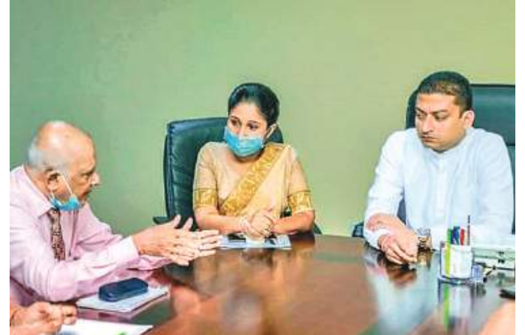
இலங்கை - ஜெர்மன் தொழில்நுட்ப கல்லூரியில் பயிலும் மாணவர்களின் கற்றல் அபிவிருத்திக்கென, இலங்கை போக்குவரத்து சபையின் ஒத்துழைப்புகளைப் பெற்றுக் கொள்வது தொடர்பில் திறன்கள் அபிவிருத்தி, தொழில் கல்வி மற்றும் ஆராய்ச்சி மற்றும் புத்தாக்க இராஜாங்க அமைச்சர் டாக்டர் சீதா அரம்பேரொல தலைமையில் விசேட கூட்டம் இடம்பெற்றது. இதில் போக்குவரத்து இராஜாங்க அமைச்சர் தீழும் அமுலுமகம், தொழில் நுட்ப கல்லூரி அதிகாரிகள் பலரும் கலந்துகொண்டனர்.

லோரன்ஸ் செல்வநாயகம் கொழும்பில் கொரோனா வைரஸ் தொற்று நோயாளிகள் 11 பேர் புதிதாக இனங்காணப்பட்டுள்ளனர். இந்நிலையில் வைரஸ் தொற்று பரவலைத் தடுக்கும் வகையில் 06 விசேட குழுக்கள் செயற்படுத்தப்பட்டுள்ளன. கொழும்பு மாநகர சபையினால் இதற்கான செயற்குறிப்பிடும் மேற்கொள்ளப்பட்டுள்ளது. இக் குழு கொழும்பு நகரின் அனைத்துப் பகுதிகளிலும் வைரஸ் தொற்றாளர்களை இனங்காணும் செயற்பாடுகளில் ஈடுபட்டுள்ளது. கடந்த 06ஆம் திகதியிலிருந்து இதுவரை கொழும்பு நகருக்குள் 2,884 பி.சி.ஆர் பரிசோதனைகள் மேற்கொள்ளப்பட்டுள்ளன. இதன் மூலம் வைரஸ் தொற்று நோயாளிகள் 10 பேர் இனங்காணப்பட்டதாக