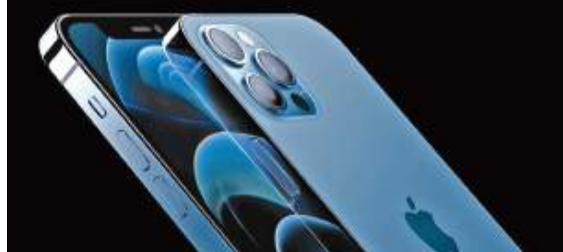
இருப்பினும், முதன்முறையாக இந்த வகை ஐபோன் திறன்பேசிகளோடு இலவசமாகக் காத்தோலிக் கருவியும் மின்னோற்றக் கருவியும் வழங்கப்பட்டாடாது கட்டுக்கடங்காமல் பெருகிவரும் மின்சுப்பையைக் குறைத்து கற்றுக்கு முலைப் பாதுகாப்பதே அதன் நோக்கம் என்று ஆப்பிள் நிறுவனம் தெரிவித்தது. வாடிக்கையாளர்கள், திறன்பேசிகளை மின்னோற்றம் செய்வதற்குரிய யு.எஸ்.பி-சி வடங்களைத் தனியே விலை கொடுத்து வாங்கிக்கொள்ள வேண்டும். அது, வாடிக்கையாளர்கள் சிலருக்கு ஏமாற்றமளித்துள்ளது.

ஆப்பிள் நிறுவனம் அடுத்த தலைமுறை ஐபோன் 12 ரக திறன்பேசிகளை அறிமுகம் செய்துள்ளது. வேகமான ஐந்தாம் தலைமுறை (5ஜி) கட்டமைப்பில் செயல்படும் அந்தத் திறன்பேசிகள் சில வண்ணங்களில் அறிமுகம் செய்யப்பட்டுள்ளன. ஹோம்ப்ரேட் மினி ஸ்மார்ட் ஸ்பீக்கர், ஐபோன் 12 மினி, ஐபோன் 12, ஐபோன் 12 ப்ரோ மற்றும் ஐபோன் 12 ப்ரோ மேக்ஸ் ஆகியவையே அறிமுகம் செய்யப்பட்டுள்ளன.