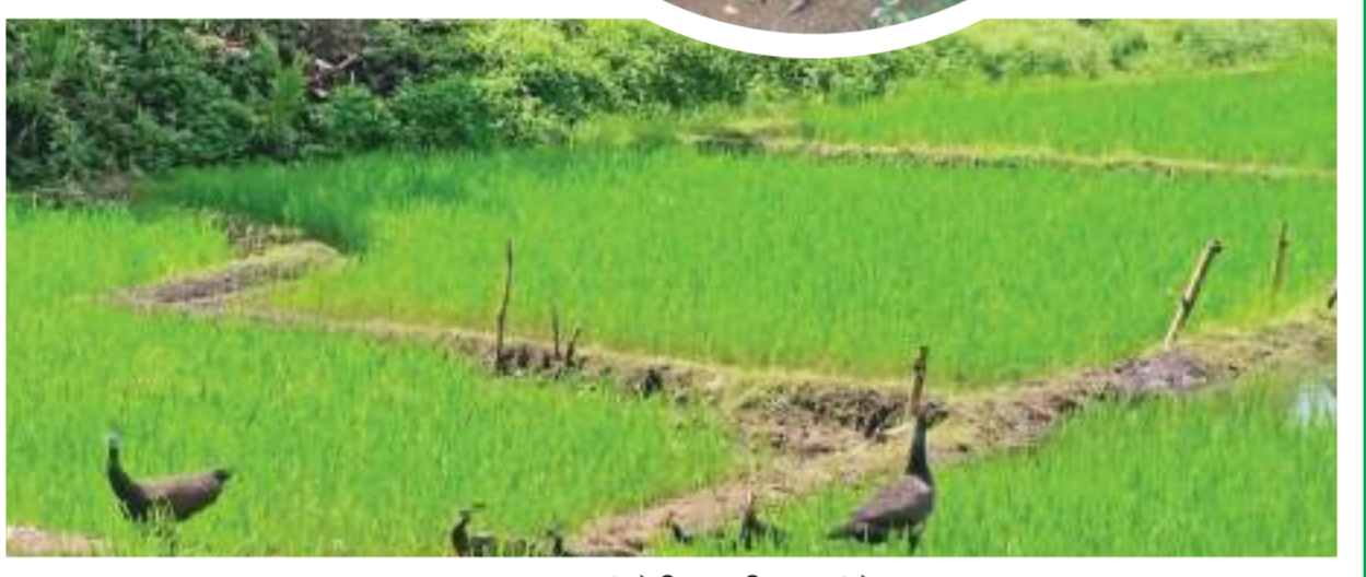
මොනරුන් නිසා හානි වූ කුඹුරක්

ශ්‍රේෂ්ඨ රජකුමනි, නුබ ගැබ සියොතුන්ට සහ මිනිසුන්ට ඔවුන්ගේ මෙන්ම මේ දේශයේ ඔහුම ඉසවුවක ජීවත් වීමට සහ ඇවිදීමට සමාන අයිතියක් ඇත. මිනිසුන්ට අයත් භූමිය අනෙක් සියලු සතුන්ට ද අයත්ය. ඔබ ඒවායේ ආරක්ෂකයා පමණි. මහින්ද මහ රහතන් වහන්සේ විසින් දේවානම්පියතිස්ස රජතුමාට වදාළේ මෙම පාඩමයි. අපේ මුතුන්මිත්තන් ලෝකය මිනිසුන්ගේ වාසයට පමණක් නොවන බැවුණොත් වටහාගෙන සිටියත්, එය අපේ නාගරිකරණය කෙරෙහි කරගත් තාක්ෂණය අවධාරණය කරන සංස්කෘතිය විසින් වේදනාත්මක වුව ද නැවත ඉගෙන ගත යුතු තත්ත්වයකට පත්ව ඇත. මීට සියවස් කීපයකට ඉහත මිනිසුන් හා සත්ත්වයන් අතර පැවතියේ ගැටලු කිහිපයකි. එහෙත් වර්තමානය වන විට මිනිසා හා සතුන් අතර ගැටුම් ලෝකයේ වසඳුම් සෙවිය යුතු තේමාවක් බවට පත්ව ඇත. මිනිස් වන සත්ත්ව ගැටුම මෙහි දී විශේෂ වේ. ඒ යටතේ ලෝකයේ මිනිස් සර්ප ගැටුම, මිනිස් වාක ගැටුම, මිනිස් කිඹුල් ගැටුම, මිනිස් හිම වලස් ගැටුම, මිනිස් අලි ගැටුම, මිනිස් රළා ගැටුම, මිනිස් මොනර ගැටුම වැනි තේමාවන් පදනම් කරගත් ගැටුම් නිර්මාණය වී ඇත. කෙසේ වෙතත් එකිනෙකට වෙනස් ජීවිත විශේෂ දෙකක වාසභූමි පේදනය වන තැන ගැටුමක් ඇති වේ. අපේ රටේ වියළි කලාපය ආශ්‍රිතව වර්තමානය වන විට බහුලව අසන්නට ලැබෙන අලි මිනිස් ගැටුම එයට ආසන්නතම උදාහරණය ලෙස දැක්විය හැකිය. රටක් වඩා බරපහල වාසනකයක් ලෙස වර්ධනය වී පවතින මිනිස් මොනර ගැටුම, අලි මිනිස් ගැටුම තරමටම සමීප නොවන්නේ ශ්‍රී ලංකාවේ මොනරුන් හෝ මොනර හානිය පිළිබඳව සංගණනයක් හෝ සමීක්ෂණයක් මෙතෙක් සිදු වී නැති හෙයිනි. අතීතයේ වියළි කලාපයේ වනපෙන් ළඳු කැළෑ ආශ්‍රිතව පමණක් දක්නට ලැබුණු මොනර ගහනයෙන් කොටසක් දැන් මෙරට ග්‍රාමීය ප්‍රදේශවල සුලභව දැක ගත හැකි අතර නොසිතූ ලෙස හිඳූ වූ මෙම සත්ත්වයා නාගරික ප්‍රදේශ තුළ දක්නට ලැබීම තවදුරටත් දුලබ දසුනක් නොවේ.