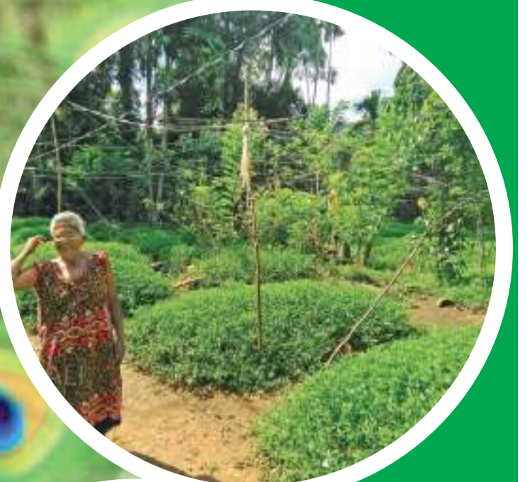
මොනරුන්ගෙන් ආරක්ෂා වන ලෙස සකසාගත් වගාවක් සහ කොරවුවක්