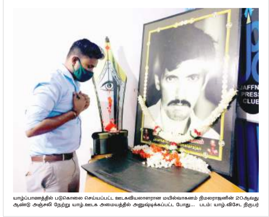
யாழ்ப்பாணத்தில் படுகொலை செய்யப்பட்ட ஊடகவியலாளரான மயில்வாகனம் நிமலராஜனின் 20ஆவது ஆண்டு அஞ்சலி நேற்று யாழ்ப்பாணம் அமைந்த இலங்கை அமைதிக்கழகம் போது...

இந்நிலையில் வவுனியா வைத்தியசாலையின் பிரதான வாயில் காலை மூடப்பட்டு, வெளிநோயாளர் பகுதி உட்பட பல்வேறு பகுதிகள் தொற்று நீக்கம் செய்யப்பட்டதுடன் ஊழியர்கள் செல்லும் வாயிலினூடாக பொதுமக்கள் உட்செல்ல அனுமதிக்கப்பட்டனர்.