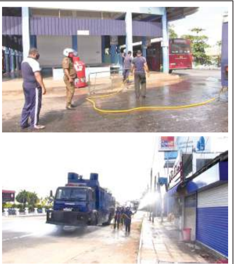
சுகாதார அமைச்சின் வழிகாட்டலில் மட்டக்களப்பு நகரில் கொரோனா வைரஸ் கட்டுப்பாட்டு நடவடிக்கைகளை மேற்கொள்ளப்பட்டன. இராணுவத்தினரும் பொலிசாரும் இணைந்து தொற்றுநீக்கி தீரவும் விசுறும் நடவடிக்கைகள் நேற்று மட்டக்களப்பில் முன்னெடுக்கப்பட்ட போது...