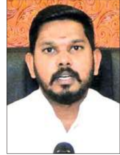
உரிய நடைமுறைகளைப் பின்பற்றி, வைரலை கட்டுப்படுத்தும் நடவடிக்கைக்கு ஒத்துழைப்பு வழங்குமாறு கேட்டுக்கொள்கின்றேன் என்றார்.

சுகாதார நடைமுறைகளை முழுமையாக பின்பற்றி செயற்படுமாறு கோருகின்றேன். கொட்டகலை பிரதேசத்தில் விளையாட்டு நிகழ்வுகளை இடைநிறுத்தியுள்ளோம். எவராவது திருமணம் உள்ளிட்ட நிகழ்வுகளை நடத்தினால் அது சுகாதார நடைமுறைகளைப் பின்பற்றி மட்டுப்படுத்தப்பட்ட நபர்களின் எண்ணிக்கையுடனேயே (25 50) நடைபெற வேண்டும். அதேவேளை, வெளி மாவட்டங்களில் இருந்து எவராவது வந்தால் அது தொடர்பில் பிரதேச சபைக்கு தகவல் வழங்குமாறு மக்களிடம் கேட்டுக்கொள்கின்றேன், ஏனெனில் வைரஸ் என்பது கண்ணுக்கு தெரியாது. ஆனால் ஏதாவொரு விதத்தில் பரவக்கூடும். எனவேதான் பொது மக்கள்