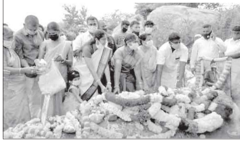
சந்தனக் கடத்தல் வீரப்பனின் சமாதியில் அஞ்சலி செலுத்தும் மனைவி, மகள்கள் உட்பட 100 பேர் மீது பொலிஸார் வழக்குப் பதிவு செய்துள்ளனர்.

சேலம் மாவட்டம், மேட்டூர் அருகே உள்ள மூலக்காட்டில் உள்ள சந்தனக் கடத்தல் வீரப்பனின் சமாதியில் கூட்டம் கூட விதித்திருந்த தடையை மீறி, அஞ்சலி செலுத்திச் சென்ற வீரப்பனின் மனைவி, மகள்கள் உட்பட 100 பேர் மீது கொள்தூர் பொலிஸார் வழக்குப் பதிவு செய்துள்ளனர். தமிழக, கர்நாடக வனப்பகுதியில் சந்தனக் கடத்தல் வீரப்பன் பதுங்கி, யானைத் தந்தம், சந்தன மரங்களை வெட்டி, கடத்தி அதிரடிப் படை வீரர்களுக்குச் சவாலாக விளங்கி வந்தார். இந்நிலையில் கடந்த 2004 ம் ஆண்டு ஓக்டோபர் 18ம் திகதி தருமபுரி மாவட்டம், பாப்பிரெட்