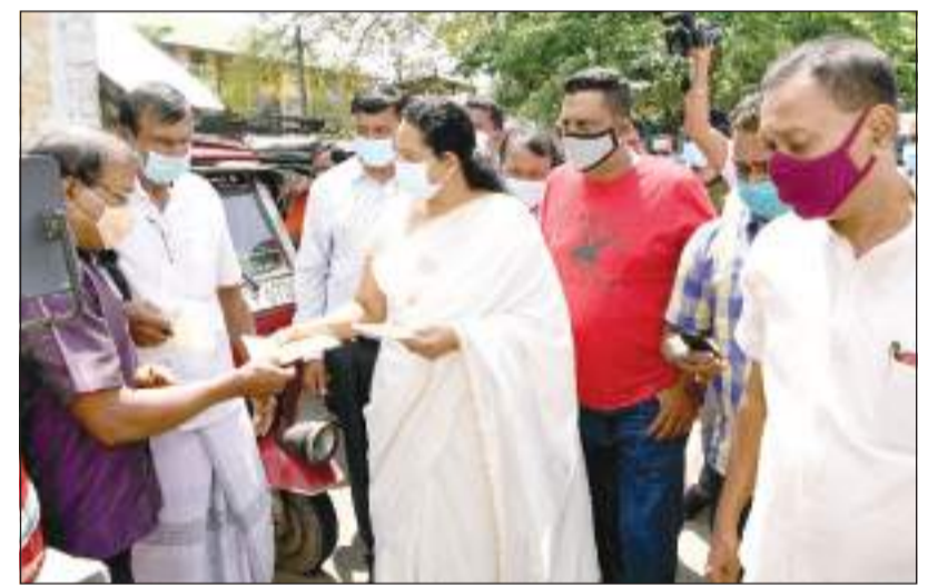
டெங்கு ஒழிப்பு தொடர்பில் மக்களை அறிவுடும் துண்டுபிரசுரங்களை விநியோகிக்கும் நிகழ்வு சுகாதார அமைச்சர் பவித்ரா வன்னியாரச்சியின் தலைமையில் இரத்தினபுரி பகுதியில் இடம்பெற்ற போது பிடிக்கப்பட்ட படம்.

தேசிய பட்டியல் வழங்காவிடின் அரசியலிலிருந்து ஓய்வு ஐக்கிய தேசியக் கட்சியின் தேசியப் பட்டியல் பாராளுமன்ற உறுப்பினர் பதவி வழங்கப்படவில்லை என்றால் அரசியலிலிருந்து ஓய்வு பெற முன்னாள் அமைச்சர் ஜேர்ன் அமரதுங்க 06