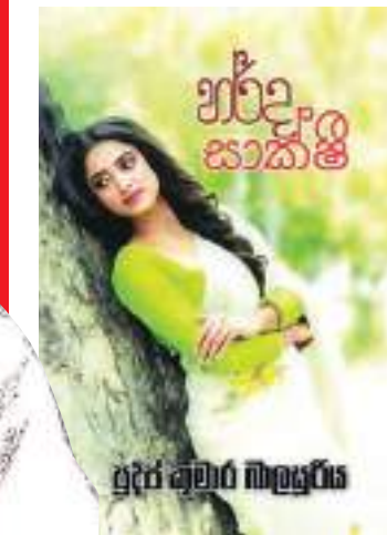
පවුල් ජීවිතයකට සහ නම ප්‍රකාශ බෙහෙවින් ආදරය කරන තේමා, ඔබ අවසානයේ මරා දමනවා? ඔබ, නවකතාවක් නොසි-නා ආකාරයෙන් අවසන් වීම වැදගත්. තේමාගේ මරණය මුල් දී අපේක්ෂා නොකළත්, එසේ අවසන් කරන්නට මට සිදුවුණා. එයට හේතු වුණේ හැම ගැහැනියක්ම තම පළමු ආදරය හමුවේ ඕනෑම සසල වන බව පැවසීම මට වුවමනා වුණා. එසේ පළමු වරට ආදරය කළ තැනැත්තා නැවත පැමිණීමෙන්, තමා වෙනුවෙන් බොහෝ කැපවීම් කළ උද්‍යානට සියුම් අසාධාරණයක් ඇය වෙතින් සිදු වෙනවා. එය නිවැරදි කර ගැනීමට ඇය උත්සාහ කළත්, එම උත්සාහ අසාර්ථක වෙනවා. සැමියා විසින් ඇය එම තත්ත්වයට පත් කරනවා. ඒ නිසා ඇයට නැවත බොහෝ සෙයින් තමා වෙනුවෙන් කැපවූ උද්‍යාන වෙත යෑම හෝ පළමු සැමියා කෙරෙහිම අප්‍රියත්වය මත නැවත ඔහු ළඟ රැඳී සිටීමට සිදු වෙනවා. එවැනි පසු-බිමක එවැනි ගැහැනියකට මරණය හැර අන් විකල්පයක් නැති විය හැකියි.

දේශපාලන ලෝකයේ සැරිසරණ ගැහැනියක නිසා තුරුණු, තම බිරිය තේමා හැර යන්නේ ඇයට දරුවකු ලැබෙන්න සිටියදීයි. දරුවාගේ පියා ලෙසින් නම් කරන්නකු ඇයට අවශ්‍ය වෙනවා. ඒ සඳහා ඉදිරිපත් වන උද්‍යානට ඇය මුළු හදවතින් ම ආදරය කරන්නා වගේම, හද කරනවා. ඒ සියල්ල වෙනස් වෙන්නේ, හැරියිය සියල්ල විනාශ කරගත් සැමියා දේශ-පාලන බලයක් සමඟ නැවත පැමිණීමෙනි.