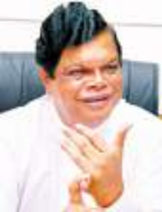
තුළ රාජ්‍ය තාන්ත්‍රික වශයෙන් මෙරටට නිෂ්පාදනයන් හා අපනයන කරුවන්ට සිදුව ඇති අලාභ සහ ඒ තුළින් මෙරටින් ගිලිහුණු වෙළෙඳ අවකාශයන් සම්බන්ධව මෙහිදී දීර්ඝ වශයෙන් සාකච්ඡා විය.

විශ්ව ආදර්ශ සමග ජාතික වෙළෙඳ ප්‍රතිපත්තිය කඩිනමින් සාකච්ඡාවට වෙළෙඳ අමාත්‍යාංශය පියවර ගෙන තිබේ.