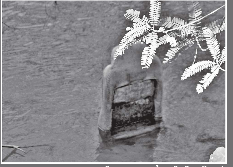
වාහනයක අසුනක් ගඟට දමා ඇති අයුරු