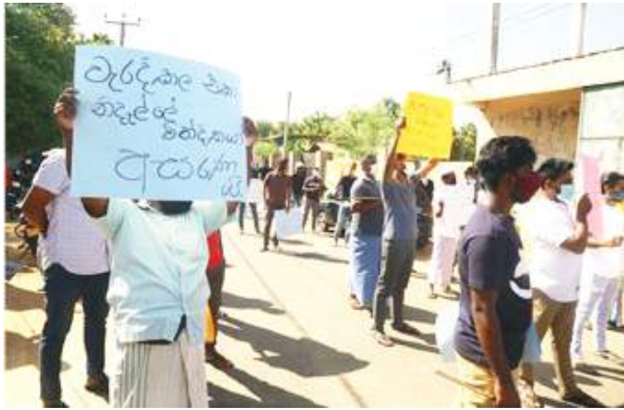
ලේකම් කාර්යාලයටම පැමිණ වැඩ බාර ගැනීමේ හේතුවෙන් ජනතාව මෙසේ විරෝධතාව දක්වා තිබේ.

ප්‍රාදේශීය ලේකම්වරයාට විරුද්ධව පැමිණිල්ලක් සිදු කර මහ අධිකරණය වෙත ඉදිරිපත් කර ඇති අවස්ථාවක මහුට විරුද්ධව එල්ල වූ වේදනා සම්බන්ධයෙන් ආයතනික මට්ටමින් විනය පරීක්ෂණයක් සිදු කළ යුතු බවයි. කෙසේ වෙතත් හරිකාලය අතරතුර ආගමික නායකයන් හා ජනතාව ප්‍රාදේශීය ලේකම් කාර්යාලය දක්වා පෙළපාලියකින් ගමන් කිරීමට ගත් උත්සාහය පොලීසිය හා සොබා අංශ එක්ව වැළැක්වීමට පියවර ගෙන ඇත.