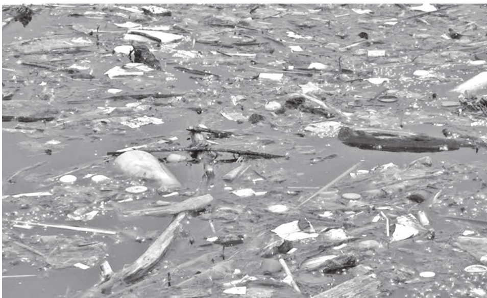
ගං ඉවුරේ පාවෙන අපද්‍රව්‍ය