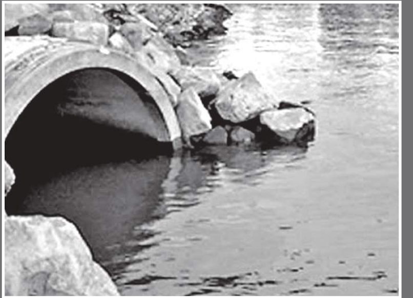
තල මඟින් විවිධ අපද්‍රව්‍ය ගඟට හරවා ඇති අයුරු