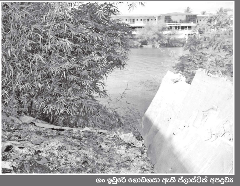
ගං ඉවුරේ ගොඩගසා ඇති ප්ලාස්ටික් අපද්‍රව්‍ය

මේ උඩුගම බලා යෑමකි. මෝදර කැලණි ගං මෝය අද්දරින් අප ඒ ගමන අරඹමු. අපේ ගමනාන්තය ගඟ ඉහත්තාවට වෙහිත් සිතාවකපුරටය. එතෙක් මෙතෙක් විසිතුරු දසුන් අපමණකි. එතෙක් අද අපේ සෝදිසිය ඒ පිළිබඳ නොවේ. කොළොම්නොට, මෝදර පටන් සිතාවකපුර අවිස්සාවේල්ල දක්වා ඉවුරු දැලෙන් කැලණි ගංගාව සමීපව නිරක්ෂණය කිරීමය. ඒ අනුව රතු එළි පෙන්වන ඉසව් සොයා ඒ වෙත වැඩි අවධානයක් යොමු කරන්නටය.