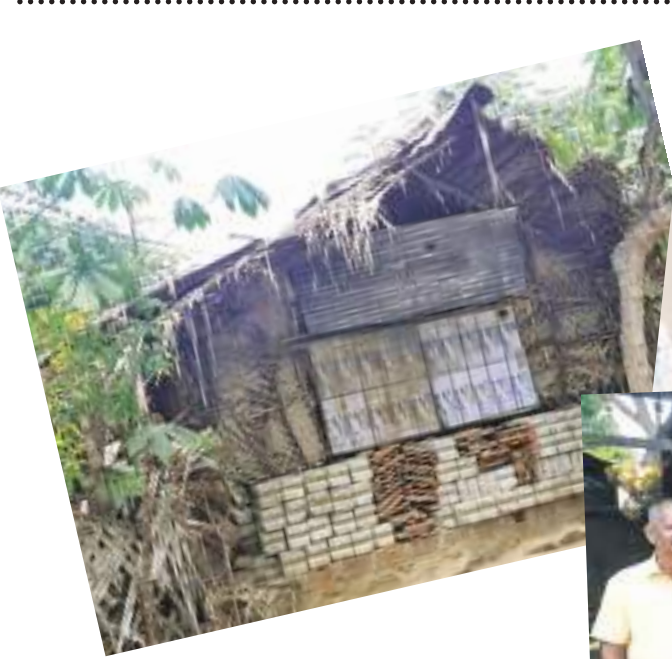
අනුරඳේව් බණ්ඩාර රණවිරාණ මාධ්‍ය ලේකම් - කර්මාන්ත අමාත්‍යාංශය

ඉංජිනේරු උපාධිය ලබාගත්තේ ය. 2016 වර්ෂයේ එංගලන්තයේ නොට්හැම් ප්‍රෙන්ට්ස් විශ්වවිද්‍යාලය මගින් නව පර්යේෂණ සම්බන්ධ පශ්චාත් උපාධිය ලබා ගත්තේය. රැකියා දහස් ගණනක් සහ සුවිශාල විදේශ විනිමයක් ශ්‍රී ලංකාව තුළට ගෙන ආ හැකි මෙම නව තාක්ෂණය ශ්‍රී ලංකාවේ ස්ථාපිත කිරීමට උත්සාහ දරන මේ අපේ විද්‍යාඥයා සහයෝගය ලබා දීමට මේ වන විට කර්මාන්ත අමාත්‍ය විමල් වීරවංශ මහතා කටයුතු යොදා තිබේ.