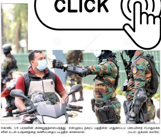
கொவிட் 19 பரவலைக் கட்டுப்படுத்தும் பொருட்டாக நகரப் பகுதியில் பாதுகாப்புப் படைகள் வலுப்படுத்தப்படும். (டபிள்: குகும் மகமட்)