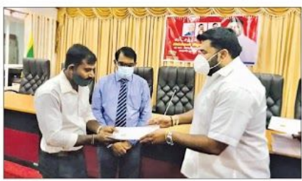
வறுமை போட்டித் திட்டம் கிடைக்காத ஒரு திட்டம் கொண்டுவரப்படும் வரையில் சேவைத் திட்டத்தில் மாற்றம் காட்டக்கூடிய ஒன்று செய்யப்படும். 101 பதினாறு சூகம் தெற்று நிபுணர் கூடுதல் மாற்றம் காட்டும். ஒத்திசைப்புக் குழு கிடைக்காத வரையில் அரசாங்கம் கிராமத்தினரை வழங்கி வைக்கப்படும் போது...