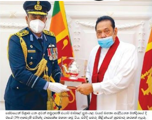
සන්නිධාන කටයුතු සඳහා නිකුත්වීමට රටේ (29) වට පේරා පුලික නීතීය සභාව සඳහාත් සේ.

මිනුවන්ගොඩ පැලියගොඩ කොවිඩ් පොකුර 6145ට හේ සන්නිධාන කටයුතු සඳහා නිකුත්වීමට පිට 06