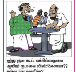
ஐந்து ரூபா கூட வக்கிள்ளாதவை ஆயிரம் ரூபாவை விமரிசிக்கலாமா?? என்ன சொல்லுறீங்கள்?