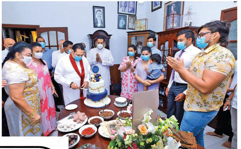
முன்னிட்டு குடும்பத்தினர் சகிதம் கேக் வெட்டி கொண்டாடிய போது பிடிக்கப்பட்ட படம்.

பிரதான எதிர்நிர்ப்பாக இருக்க து குறுகிய காலப்பகுதியில் அதனை நாம் நிறைவேற்றியுள்ளோம் என்றும் அவர் தெரிவித்தார். கோட்டாபய ராஜபக்ஷ பதவியேற்று ஒரு வருட முத்தியையெட்டி தேற்றியும் தினம் தொலைக்கூடிக் ஊடக அவர் நாட்டு மக்களுக்கு உரையாற்றும் போதே இவ்வாறு தெரிவித்தார். நாட்டின் அரசியலமைப்புக்கு