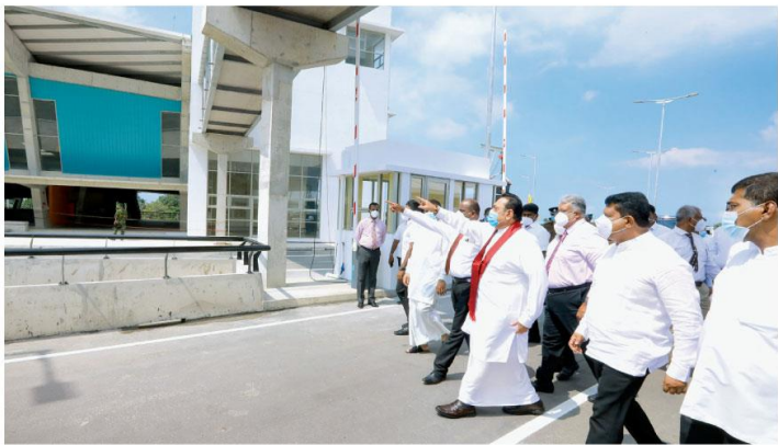
පහසුකම් රැසකින් සමන්විත පැලියගොඩ නව මැතිං වෙලෙඳ සංකීර්ණය ජනතා අධිකාරී පත් කිරීම අමතරව මහින්ද රාජපක්ෂ මහතාගේ ප්‍රධානත්වයෙන් රජයේ (20) ජනතා අධිකාරී පත් කෙරුණි. අනතුරුව, එම වෙලෙඳ සංකීර්ණය අමතරව රජයේ නිරීක්ෂණයට ලක්වූ අයුරු.

1999 වසරේ මහලේ මහලේ ප්‍රදේශයේදී සිදු වූ මිනිස් කොටු වහාම එන්නත් ලක්ෂ 42ක් ශ්‍රී ලංකාවට සංවිධානය වන තරම් පළ කර තිබේ. සංස්ථාවේ සහායක, ස්නායු ශාඛා දැනට සිටින මහතා දී