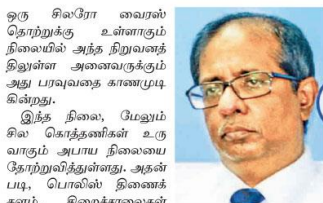
கொத்தலாவல இராணுவ ஆய்வுத்திரி மியும் உருவாக்கப்பட்டுள்ளன. மற்றும் நாளுக்கு பல்கலைக்கழகங்களிலும் பிரிசூர் 06