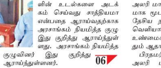
குழுவினர் இது குறித்து ஆராய்ந்துள்ளனர். 06

கொரோனா வைரஸ்ால் உயிரிழந்தவர்களின் உடல்களை தகனம் செய்வதே ஒரேயொரு சாத்தியமான வழி என அரசு சங்கம் நியமித்துள்ள நிபுணர்கள் குழு தெரிவித்துள்ளது. கொரோனாவால் உயிரிழந்தவர்க 06