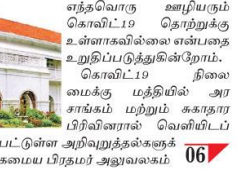
எத்தவொரு ஊழியரும் கொவிட்-19 தொற்றுக்கு உள்ளாகவில்லை என்பதை உறுதிப்படுத்துகின்றனர். கொவிட்-19 நிலைமைக்கு மத்தியில் அரசு சங்கம் மற்றும் ககநார பிரிவினரால் வெளியிடப்பட்டிருள்ள அறிவுறுத்தல்களுக்கு கமைய மருதமர் அலுவலகம் 06

கொவிட்-19 தொற்று நிலைமை காரணமாக அலரி மாளிகை தற்காலிகமாக மூடப்பட்டுள்ளதாக தேசிய நாளிதழொன்றில் வெளியாகியுள்ள செய்தி உண்மைக்கு புறம்பானது. மருதமர் அலுவலகம் மற்றும் அலரி மாளிகையில் பணியாற்றும் 06