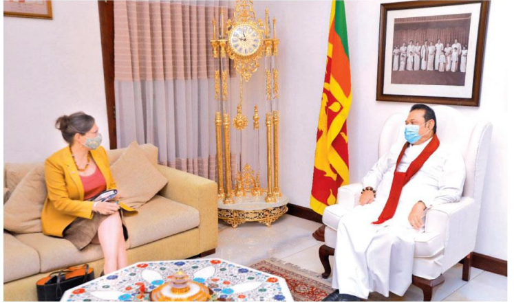
சுமரீக்க துறவுருக்கும், பிரதமர் மஹிந்த ராஜபக்ஷேவிடம் இடையினை சந்திப்பானு நேற்று இடம்பெற்றபோது பிடிக்கப்பட்ட படம்.