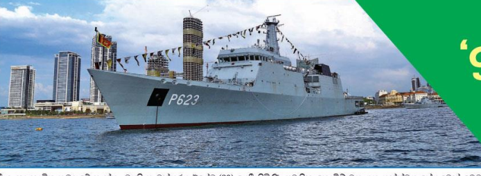
ශ්‍රී ලංකා නාවික හමුදාවේ හැන්තා වැනි සංවිධාන රටේ (09) යෙදී තිබේ. පවතින කොවිඩ් වසංගත තත්වය හේතුවෙන් මෙවර එ නිමිත්තෙන් සැමරුම් උළෙලක් සංවිධාන කර නොතිබුණු අතර, නොහොඳුන්ගේ පමණක් හඳුනා ගැනීමට පියවර ගත්හ. රටේ (09) පැවැත්වේ. එහිදී රටේ සංවර්ධනය ද පෙන්නුම් කෙරෙන පරිදි මුහුදේ සිට ගනු ලැබූ ජාත්‍යන්තර මාර්ගයන් ගිණුම් ගිණුම්