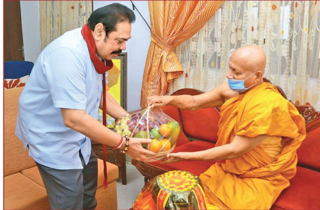
අගමැති මහින්ද රාජපක්ෂ මහතා බෙල්ලන්වල රාජමහා විහාරස්ථානය රිදේ (11) වැදගුරු ගත්තේය. ආගමික ව්‍යවස්ථාප නිරෝධායන නීතියට පටිපාටිව ක්‍රියා කළ හොත් මවුන්ට එරෙහිව අධිකරණයේ නඩු පවරා වසර තුනක සිර දඬුවමකට හා දඩයකට ලක් කිරීමේ හැකියාව පවතින බැවින් නිරෝධායන නීති රීති පිළිපදවීමෙන් නිවෙසේ රැකියා සිටින්නන්ගේ මාධ්‍ය ප්‍රකාශන නීතියේ රෝගී මහතා මාධ්‍යයට රිදේ (11) ප්‍රකාශ

අසේල කුරුමා මාවත ප්‍රධාන ධනාත්ත වන්නේ ඉහළ කොටසේ පිහිටි කොට්ඨාස සන්තාර ලණුවේ එල්ලි සෙල්ලම් කරමින් සිටි අව නැවිලි පාසල් පිහිටුවීම එම ලණුවට හෙල සිර වී මරණයට පත්ව ඇත. 80 06