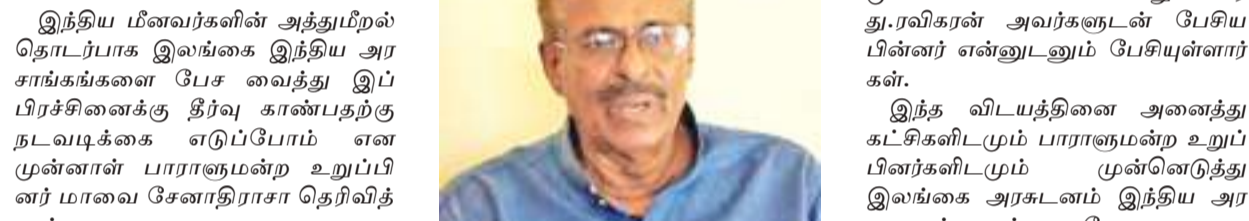
போதே அவர் இவ்வாறு குறிப்பிட்டார். மேலும் கூறுகையில், மீனவர்கள் பிரச்சினை தொடர்பில் இந்திய தரப்பில் இருந்து அதிகார