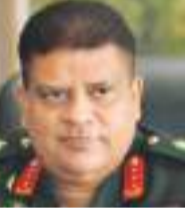
மேலும் ஒரு வாரம் உள்ளதால் அவசரப்படத் தேவையில்லை