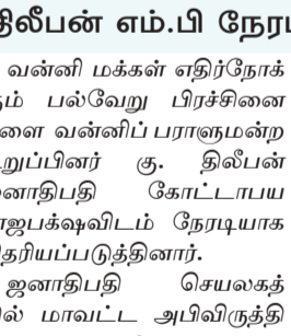
திடீபன் எம்.பி நேரடியாக எடுத்துக் கூறியமைக்கு பலன்