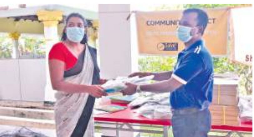
வேலணை குறுப் நிடுபர்

SOLVE நிறுவனம், தேசிய முன்பள்ளி ஆசிரியர் சங்கம் மற்றும் சர்வோதயம் ஆகியோர் இணைந்து முன்பள்ளி மாணவர்கள் மற்றும் ஆசிரியர்களுக்கான முகக்கவசங்களை வழங்கினர். நிகழ்வில் யாழ்ப்பாணம் கிளிநொச்சி மாவட்ட ஆசிரியர்கள் இணைந்து கொண்ட தமது முன்பள்ளிகளுக்கு தேவையான அளவிலான முகக்கவசங்களை பெற்றுக்கொண்டனர். மேலும் முகக்கவசங்களை