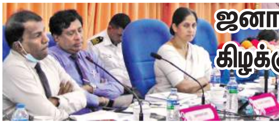
மட்டக்களப்பு சுழற்சி நிருபர்

ஜனாதிபதி கோட்டாபய ராஜபக்ஷவின் சுபீட்சத்தின் நோக்கு கொள்கை திட்டத்திற்கையமை நிலைபேறான அபிவிருத்தி திட்டங்களை கிழக்கு மாகாணத்தில் அமுல் நடத்துவதற்கு கிழக்கு மாகாண சபை நடவடிக்கை எடுத்திருக்கின்றது.