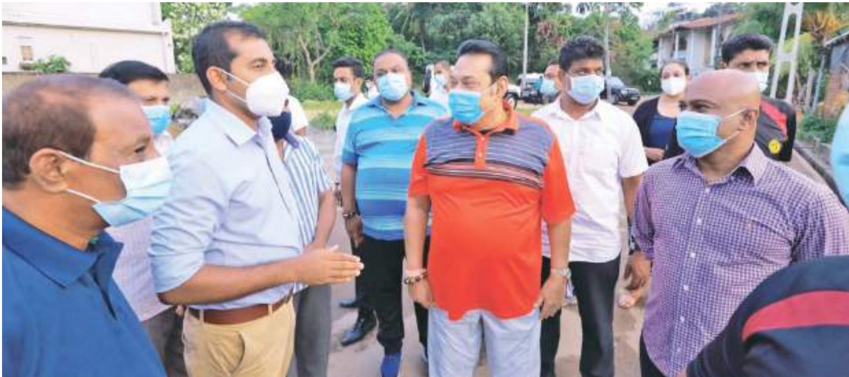
அங்கம்பிடிய, 9வது ஒழுங்கை மற்றும் பாடசாலை வீதியை இணைக்கும் வகையில் நிர்மாணிக்கப்படும் மேம்பாலத்தின் கட்டுமானப் பணிகளை (15) பிற்பகல் பிரதமர் மஹிந்த ராஜபக்சு பார்வையிட்டபோது.

ஜம்மு மற்றும் காஷ்மீரில் இருந்து ஆப்பிள் ஏற்றுமதியை அதிகரிப்பதற்கு இதன்போது இணக்கம் எட்டப்பட்டது.