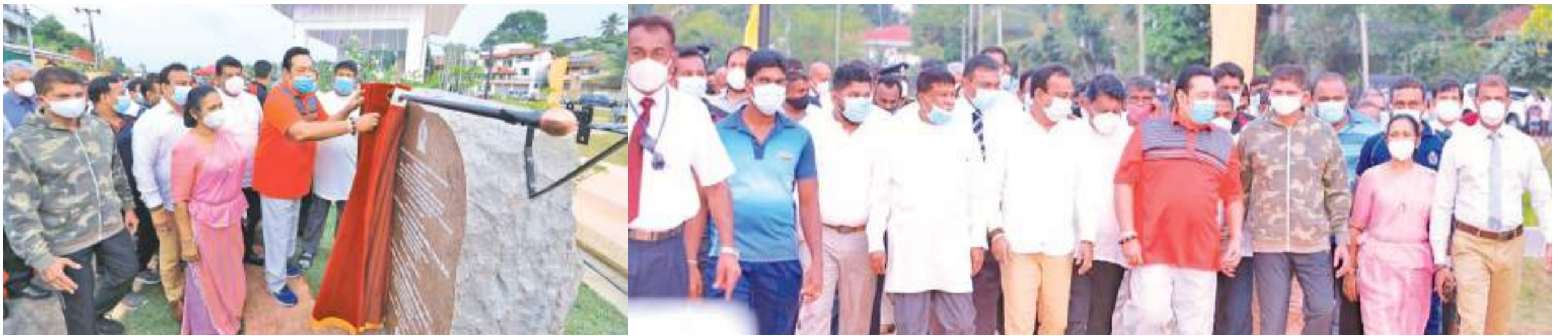
மாதிவலை மேற்கு நகர விவசாய மற்றும் சுற்றுச்சூழல் மேம்பாட்டுத் திட்டம் பிரதமர் மஹிந்த ராஜபக்சுவினால் (15) பிற்பகல் மக்கள் பாவனைக்காக கையளிக்கப்பட்டபோது...