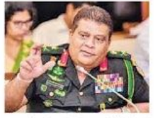
கொரோனா வைரஸ் அச்சுறுத்தல் ஆழிவகையில் சமர்த்திற் கொண்டு மேல் மாகாணத்திலிருந்து வெளியேறும் அனைவருக்கும் என்ரிஜன் பரிசோதனைகளை மேற்கொள்ள தீர்மானம் செய்துள்ளதாக மேல் மாகாண சபையின் தலைவர் இராணுவத் தளபதி சவேந்திர சிவ்வா தெரிவித்துள்ளார்.