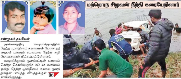
மற்றொரு சிறுவன் நீந்தி கரையேறினார்