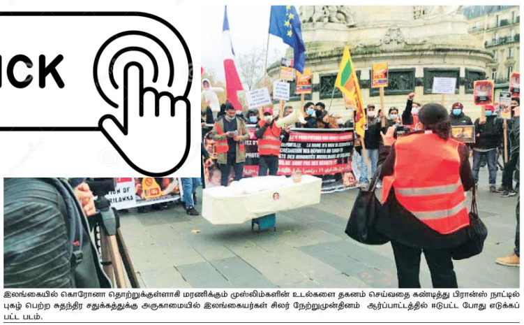
இலங்கையில் கொரோனா தொற்றுக்குள்ளாகி மரணிக்கும் முஸ்லிம்களின் உடல்களை தகனம் செய்வதை கண்டித்து பிரான்ஸ் நாட்டில் புகழ் பெற்ற சுதந்திர சதுக்கத்துக்கு அருகாமையில் இலங்கையர்கள் சிலர் நேற்றுமுன்தினம் ஆர்ப்பாட்டத்தில் ஈடுபட்ட போது எடுக்கப்பட்ட படம்.

கடற்றொழிலாளர்களின் பிரச்சினை பெற்றுக்கொடுக்க முடியாது போகுமிடத்து கடற்றொழிலாளர் அமைச்சர் பதவியை தூக்கி எறியவும் தயக்க மாட்டேன் என்று அமைச்சர் டக்ளஸ் தேவானந்தா தெரிவித்துள்ளார். இந்திய எல்லை தாண்டிய சட்டவிரோத செயற்பாடுகளுக்கு எதிராக முல்லைத்தீவு மாவட்ட கடற்றொழிலாளர்கள் கவனவிரிப்பு போராட்டத்தினை மேற்கொண்டு வருகின்ற நிலையில் நேற்று அங்கு சென்ற அமைச்சர் டக்ளஸ் மேற்கண்டவாறு 06