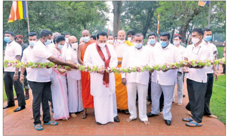
புளையாட்டில் அனுராதபுரம் ஜேதன தொல்பொருள் அருங்காட்சியகம் மற்றும் உள்ளக சாலை அமைப்பு என்பன புத்தாண்டு சமய மற்றும் கலாசார அனுபவங்கள் அமைச்சரவை, பிரதமருமள மஹிந்த ராஜபக்ஷினால் நேற்று (21) திறந்துவைக்கப்பட்ட போது...