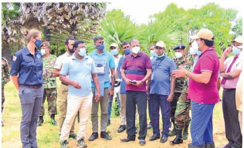
முகாமலை மற்றும் சிளாவி பகுதிகளில் புதைக்கப்பட்டுள்ள கண்ணிவெடிகள் அகற்றும் கிள்களுக்கு நேற்று நேரில் சென்ற இராணுவ அமைச்சர் இத்திக்க அனுருத்த அங்கு இடம்பெறுகின்ற மனிதநிய கண்ணிவெடிக் அகற்றும் பணியினை பார்வையிட்ட போது...

தீவிர சடலங்களை அனுப்புவது தொடர்பில் எந்த வித உத்தியோகபூர்வ கோரிக்கையையும் மேற்கொள்ளவில்லை