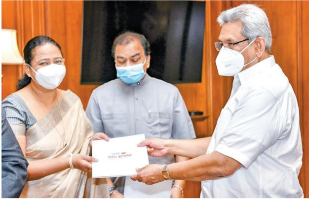
'விடு அபிமன்' கொவிட் 19 காய்ப்புட்டுக் கொள்கையின் கீரண்டம் கட்டத்தை அங்குராப்பணம் செய்து வைக்கும் நிகழ்வில் காய்ப்புட்டுக் கொள்கை அடங்கிய ஆவணத்தை ஜனாதிபதி கோட்டாபய ராஜபக்ஷவுக்கு சுகாதார அமைச்சர் பவித்ரா வன்னியாராச்சி நேற்று (22) ஜனாதிபதி செயலகத்தில் வைத்து கையளித்தபோது...

நாட்டில் கொரோனா வைரஸ் தொற்று நோயாளிகளின் எண்ணிக்கை 37 ஆயிரத்து 891 ஆக அதிகரித்துள்ளதாக சுகாதார அமைச்சு தெரிவித்துள்ளது. நேற்று நேரம் வைரஸ் தொற்று நோயாளிகள் 280 பேர் பதிதாக இனம் கணக்கிடப்பட்டுள்ள நிலையில் நாட்டின் மொத்த வைரஸ் தொற்று நோயாளிகளின் எண்ணிக்கை 37 ஆயிரத்து 891 ஆக அதிகரித்துள்ளதாக 06