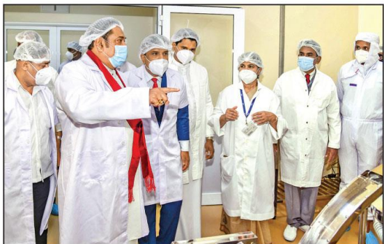
රාජ්‍ය ඖෂධ නිෂ්පාදන නීතිගත සංස්ථාව අලුතින් නිෂ්පාදනය කළ පෙනිසිලින් ප්‍රතිජීවක ඖෂධයක් වන ෆ්ලොක්සැසිලින් (Flucloxacillin Capsules BP 500 mg) ඖෂධය මෙරටට හඳුන්වාදීම අනමැති මහින්ද රාජපක්ෂ මහතාගේ ප්‍රධානත්වයෙන් රජයේ (23) එම සංස්ථා පරිශ්‍රයේදී සිදු කෙරිණි. එම නිෂ්පාදනාගාරය අනමැතිවරයාගේ නිරීක්ෂණයට ලක් වූ අයුරු.

බිලියන 43ක විකිණු සැකකරුවන්ගේ විකිණුම් කටයුතු මහජන සේවකරුවන්ගේ විකිණුම් කටයුතු මෙන්ම ප්‍රදේශයේ පසුගිය 21 වැනිදා අත්අඩංගුවට ගත් සැකකරු මොරටුව මහේස්ත්‍රාත් අධිකරණයට ඉදිරිපත් කිරීමෙන් පසු රු.500 ක් දෙක බැගින් වූ මරණ දඬුවම් හා දඩ දැරූ නොන්දේසි මත එදිනමි රාත්‍රියේදී මුදා හැර තිබේ. පිට 06