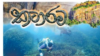
සවරණානුමයේ අතීතාවලෝකනය අද පත්‍රය සමඟ

ශ්‍රී ලුංකා 2564ක් වූ උදවස් පුර දසවන ලක් අය දින | කාණ්ඩය 112 | පත්‍රය 07 | පිටු 36 | මල රු.30 | web: www.dinamina.lk | ශ්‍රී ලංකාවේ ලියාපදිංචි කළ පුවත් පතකි | 2020 දෙසැම්බර් 24 බ්‍රහස්පතින්දා