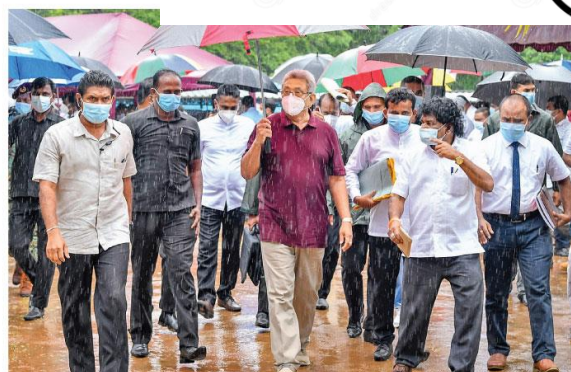
ජනපති නේවාසික රාජකාරී මහතා මහලැයි මැද ආකුලදී ගම සමඟ පිළිගැනීමට එක් වෙමින්.

ආසක්‍ර දා ප්‍රහාරකයන්ට ආධාර දුන්නැයි ශ්‍රී ලාංකිකයන් 3කට අමෙරිකාවෙන් අඩි වෝදනා