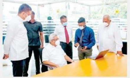
புல சேவையின் மீதும் தேர்தல் (15) ஆய்விக்கப்பட்டது. ஆதல்களின் எண்ணிக்கைக் குறைப பயணிகளை ஏற்றிச் செல்ல சேவையின் மீதும் தேர்தல் (15) ஆய்விக்கப்பட்டது. கார் மற்றும் மோட்டார் வாகனங்கள் மூலமாக வரவிருக்கும் வரவிருக்கும் பஸ் பஸ் போக்குவரத்து மத்திய நிலையம்

பஸ் கட்டடத்தை விட இருமடங்கடாகும். குறிப்பிட்ட பஸ் நினைவகத்தில் குறைந்த எண்ணிக்கையிலான பயணிகள் குறுகிய நேரத்தில் குறிப்பிட்ட இடத்தை சென்றடைதல், மரீகாசை நம்பி மத்தும் கவரக்கூடியவை போக்குவரத்து வழங்குதல் ஆகியவை இக்க கட்டடத்தில் அடங்கும். பயணிகள் தங்கள் வாகனங்களை