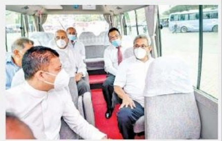
பல்புக மத்திய நிலையத்திற்கு சென்ற மூலம் வாகன தரிப்பிடத்தில் இலவசமாக நிறுத்தப்படும். நிபந்தனையில் முன்பேறிக்கூடிய அழகான நகர்ப்பகுதி மத்திய நிலையம் மீதும் தேர்தல் (15) ஆய்விக்கப்பட்டது. காலம் 06.00 மணி முதல் 08.00 மணி வரையும், மாணவர்களுக்கு மத்திய நிலையம் வரையில் ஒவ்வொரு 15 நிமிடங்களுக்கு ஒரு முறை பஸ்கள் இயக்கப்படும். காலம் 08.00 மணி முதல் மாணவர்களுக்கு மத்திய நிலையம் வரையில் ஒவ்வொரு 15 நிமிடங்களுக்கு ஒரு முறை பஸ்கள் இயக்கப்படும். தலைமுறைப்படுத்தப்படும். 06