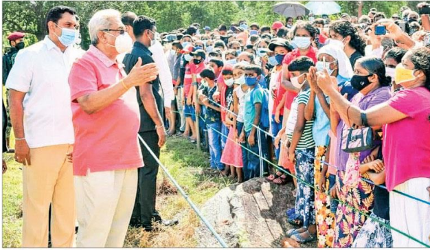
“சிராமத்துடன் உரையாடல்” நிகழ்ச்சியில் பங்கேற்க தமன்வில்லக்குச் சென்ற ஜனாதிபதி கோட்டாபய ராஜ பகஷ், கொட்டாவெறு மன்கூட மகா வித்தியாய வளாகத்தில் கூடியிருந்த பாடசாலை மாணவர்கள் மற்றும் சிராமவாசிகளுடன் கலந்துரையாய் போது....