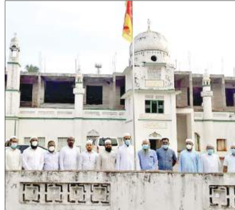
பறகஹதெயிய பெரிய ஜம்ஆப் பள்ளிவாசலின் ஏற்பாட்டில் 73 வது சுதந்திர தின நிகழ்வு பள்ளிவாசல் முன்றலில் இடம்பெற்றது. நிகழ்வில் பள்ளிவாசல் நிர்வாகத்தினர் ஞாபகார்த்த மரக்கன்று நடுவதையும் கலந்து கொண்ட நிர்வாகத்தினரையும் காணலாம்.

வது. மோட்டார் சைக்கிளில் ரம்பாவ வைத்தியசாலைக்கு கடமைக்கு சென்று கொண்டிருக்கும் போது பஸ் வண்டியொன்று மோட்டார் சைக்கிளில் மோதியதில் இவ்விபத்து இடம்பெற்றுள்ளது. விபத்தில் பலத்த காயங்களுக்குள்ளான தாதியை சிகிச்சைக்காக அநுராதபுரம் போதணா வைத்தியசாலையில் அனுமதிக்கும் போது அவர் உயிரிழந்துள்ளார் என்பது மேலும் தெரியவந்துள்ளது. விபத்துச் சம்பவத்துடன் தொடர்புடைய ரஜரட்ட பஸ்கலைக்கழக பஸ் வண்டியின் சாரதியை பொலிசார் கைது செய்துள்ளனர். சம்பவம் தொடர்பான மேலதிக விசாரணைகளை அநுராதபுரம் பொலிஸ் நிலைய போக்குவரத்து பிரிவு பொலிசார் மேற்கொண்டு வருகின்றனர் என்பது குறிப்பிடத்தக்கதாகும்.