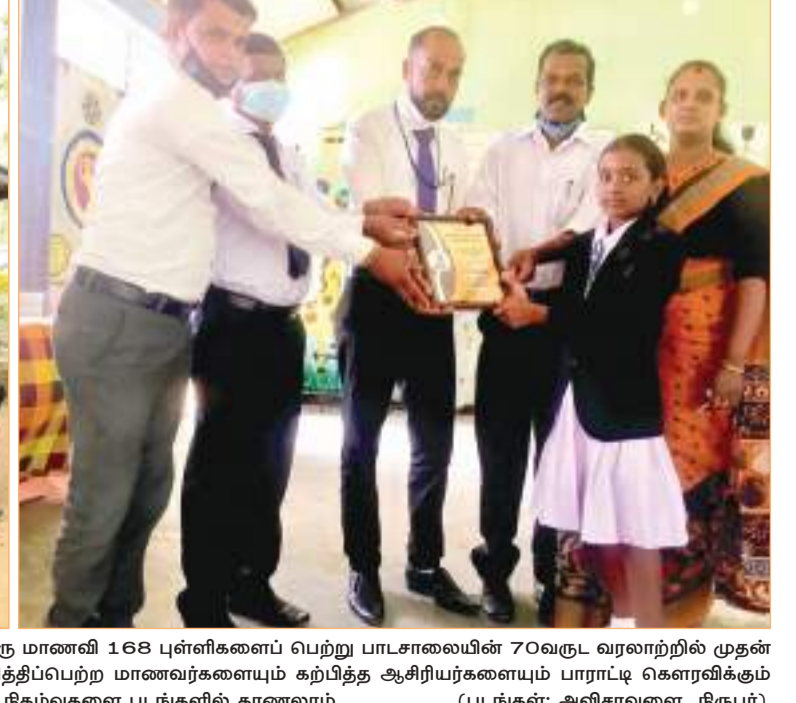
தெனியோட்டி கல்வி வலயத்துக்குட்பட்ட மாணவ தழிப்பு வித்தியாலயத்தில் பரிசேசுக்கு தொற்று நான்கு மாணவர்களில் ஒரு மாணவி 168 புள்ளிகளைப் பெற்று பாடசாலையின் 70வது வருடாந்திர முதல் முறையாக சித்தியடைந்துள்ளார். அத்துடன் ஏனைய மாணவர்களும் 128ற்கு மேல் புள்ளிகள் பெற்றுள்ளனர். இவ்வாறு சித்திப்பெற்ற மாணவர்களையும் கற்பித்த ஆசிரியர்களையும் பாராட்டி கௌரவிக்கும் நிகழ்வு அண்மையில் (05.02.2021) மாணவ தோட்ட இளைஞர்களாலும் பெற்றோர்களாலும் ஏற்பாடு செய்யப்பட்டிருந்தது. நிகழ்வுகளை படங்களில் காணலாம்.