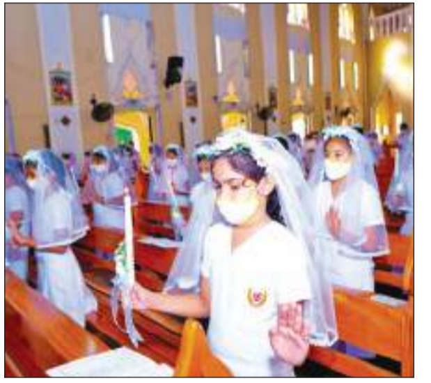
கொழும்பு, வெள்ளத்தை புனித லோரன்ஸ் தேவாலய பங்கீள் சிறுவர்களுக்கான முதல் நன்மை திருப்பலி அண்மையில் நடைபெற்றது. முதல் நன்மை பெற்றுக் கொண்ட சிறுவர்களையும் மறையாசிரியர்கள் மற்றும் அருட்சகோதரிகளையும் சிறுவன் ஒருவருக்கு அருட்தந்தை முதல் நன்மை வழங்குவதையும் படங்களில் காணலாம்.