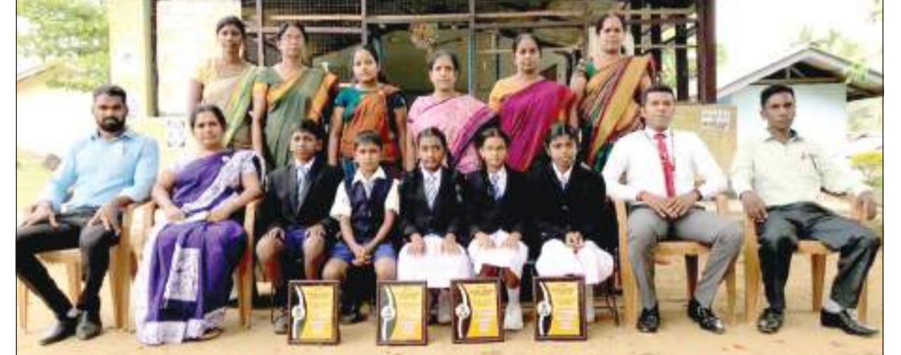
கடந்த வருட தரம் ஐந்து புலமைப் பரிசில் பரிடசையில் வெறுயோவிட கல்வி வலயத்திற்கு உட்பட்ட மாஹு தமிழ் வித்தியாலயத்தில் பரிடசைக்கு தோற்றிய நான்கு மாணவர்களில் ஒரு மாணவி 168 புள்ளிகளைப் பெற்று பாடசாலைவின் 70 வருட வரலாற்றில் முதன்முறையாக சித்தியடைந்துள்ளார். அத்துடன் ஏனைய மாணவர்களும் 128ஐக் மேல் புள்ளிகள் பெற்று பாடசாலைக்கு பெருமை சேர்த்துள்ளனர்.