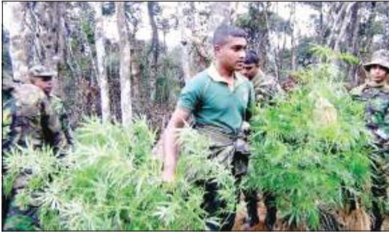
(ஹற்றன் சுழற்சி நிருபர்)

நுவரெலியா மாவட்டத்திலுள்ள நாலுயா எடின்புரோ தோட்டத்திற்கு மேற்பகுதியில் உள்ள அரசாங்க வனப்பகுதியில் மிகவும் சூட்சுமமான முறையில் கஞ்சா செடிகள் வளர்க்கப்பட்டுள்ளது. இதனையடுத்து அப்பகுதியில் நுவரெலியா பொலிஸ் விசேட அதிரடிப்படை யினர் நேற்றுமுன்தினம் (07.02.2021) மாலை சுற்றி வளைத்துள்ளனர். கஞ்சா சேனையில் 3