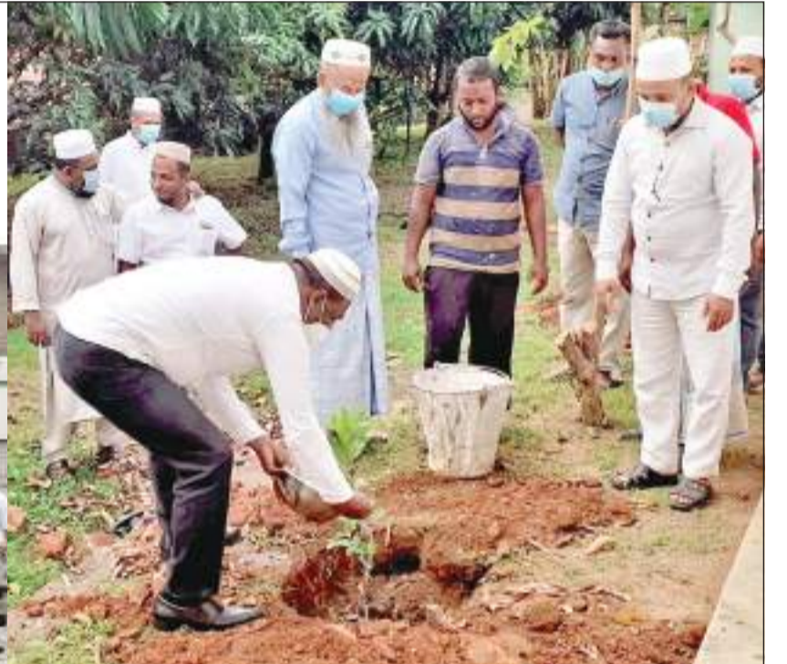
பறகஹதெயிய பெரிய ஜம்ஆப் பள்ளிவாசலின் ஏற்பாட்டில் 73 வது சுதந்திர தின நிகழ்வு பள்ளிவாசல் முன்றலில் இடம்பெற்றது. நிகழ்வில் பள்ளிவாசல் நிர்வாகத்தினர் ஞாபகார்த்த மரக்கன்று நடுவதையும் கலந்து கொண்ட நிர்வாகத்தினரையும் காணலாம்.