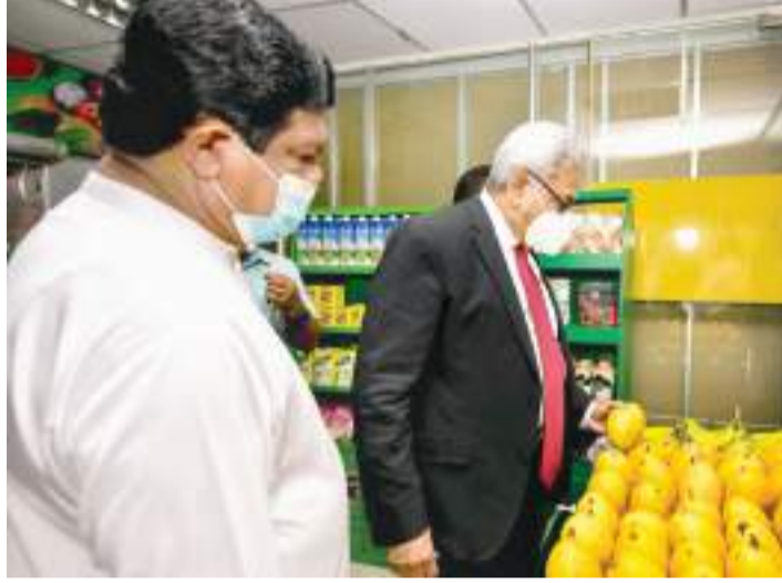
වෙළෙඳ මධ්‍යස්ථාන ඇති කිරීම සිය බලාපොරොත්තුව බවද සඳහන් කළේය.

අනුර ප්‍රේමලාල් "සෞභාග්‍යයේ දැක්ම" ප්‍රතිපත්ති ප්‍රකාශය ප්‍රකාර රාජ්‍ය ව්‍යවසායයන්ගේ හා දේශීය නිෂ්පාදකයන්ගේ ඉන්තර්මිඩියරි භාණ්ඩ හා සේවා එක වශයෙන් යටිතල සපයා ගැනීමට පාර්ශ්විකයාට අවස්ථාව උදා කිරීම මෙම ව්‍යාපෘතියේ අරමුණ බව වෙළෙඳ අමාත්‍ය ආචාර්ය ධනදුල ගුණවර්ධන මහතා ප්‍රකාශ කරයි. එමගින් මේ බව සඳහන් කළ පෙරේදා (11) ශ්‍රී ලංකා රාජ්‍ය වාණිජ (විවිධ) නීතිගත සංස්ථාවේ පුද්ගලිකාර්ය පුළුල් කර "රජ-වාස" වෙළෙඳ සංකීර්ණය විවෘත කිරීමේ අවස්ථාවට එක්වෙමින්ය. නාගරාගේපිටි ආර්ථික මධ්‍යස්ථාන භූමියේ ස්ථාපිත "State Trust Centre" (රජවාස) වෙළෙඳ සංකීර්ණය ජනාධිපති ගෝඨාභය රාජපක්ෂ මහතාගේ ප්‍රධානත්වයේ විවෘත කෙරුණි. එය රාජ්‍ය සහ පොදුගිව්‍ය වෙළෙඳ ආයතන 78කින් සමන්විතය. දේශීය නිෂ්පාදකයන් දිරි ගැන්වීම සඳහා ඔවුන්ගේ නිෂ්පාදන භාණ්ඩ වෙළෙඳසල්වලට සැපයීමේ