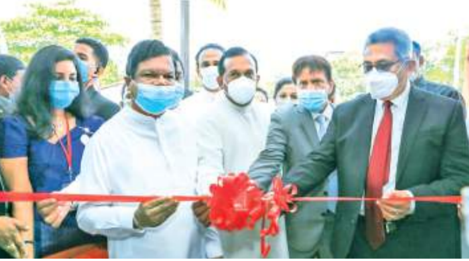
වෙළෙඳ මධ්‍යස්ථාන විවෘත කිරීමේ අවස්ථාවට සමගාමීව වෙළෙඳ අමාත්‍ය ආචාර්ය ධනදුල ගුණවර්ධන මහතා විවෘත කිරීමට මේ ඔස්සේ පාර්ශ්වික ජනතාවට අවස්ථාව උදා වන අතර නිෂ්පාදකයන්ටද සිය නිෂ්පාදන සාප්පුව අලෙවි කිරීමට මේ ඔස්සේ අවස්ථාව උදා වේ.