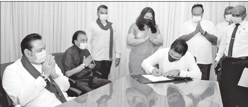
மாகாண சபைகள் மற்றும் உள்ளூராட்சி விவகாரங்கள் இராஜாங்க அமைச்சராக ரொஷான் ரணசிங்க பிரதமர் மலிந்த ராஜபக்ஷ முன்னிலையில் நேற்று (02) முற்பகல் கடமை