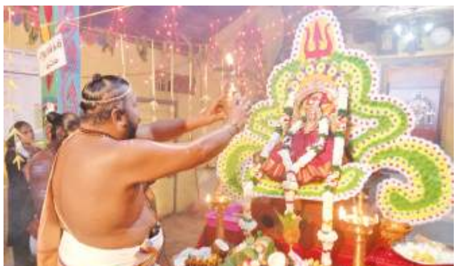
தெனியாய அருள்மிகு ஸ்ரீ முத்துமாரியம்மன் ஆலயத்தின் வருடாந்த வருஷாபிஷேக திருவிழா கடந்த சனிக்கிழமை இடம்பெற்றது. இதன்போது எடுக்கப்பட்ட படத்தை இங்கு காணலாம். (படம்: தெனியாய தினகரன் நிருபர்)

கொவிட் தொற்றினால் உயிரிழக்கும் சடலங்களை நல்லடக்கம் செய்வதற்கான வர்த்தமானி அறிவித்தல் மூலம் அனுமதி கிடைத்துள்ள போதிலும் இதற்கான வழிகாட்டல் சுற்று நிருபம் வெளியாவாமையால் வைத்தியசாலை நிர்வாகம் இந்த மனித நேயத் தீர்மானத்தை மேற்கொண்டுள்ளது. இரண்டு தினங்களுக்கு முன் இரத்தினபுரி போதனா வைத்தியசாலையில் அனுமதிக்கப்பட்ட இவர் உயிரிழந்ததையடுத்து இவரது சடலத்தை முஸ்லிம் சமய முறைகளுக்கு அமைய நல்லடக்கம் செய்ய அனுமதி தருமாறு இவரது குடும்பத்தினர் வேண்டியதை அடுத்து இத்தீர்மானம் மேற்கொள்ளப்பட்டுள்ளது.