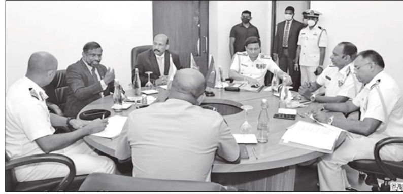
பாதுகாப்பு செயலாளரும் தேசிய பாதுகாப்பு மற்றும் அனர்த்த முகாமெத்துவ இராஜாங்க அமைச்சின் செயலாளருமான ஜெனரல் கமல் குணரட்ண (ஒய்வு), வெளிவிவகார அமைச்சின் செயலாளர் அட்மிரல் பேராசிரியர் ஜயநாத் கொலம்பகே (ஒய்வு), கடற்படை தளபதி வைல்

இந்தியா, இலங்கை மற்றும் மாலைதீவு ஆகிய நாடுகளுக்கிடையிலான கடல்சார் பாதுகாப்பு ஒத்துழைப்புக்கான தேசிய பாதுகாப்பு ஆலோசகர் மட்ட முத்தரப்பு செயலகம் கொழும்பில் ஸ்தாபிக்கப்பட்டுள்ளது. இந்தியா மற்றும் மாலைதீவுகளுடன் கடல்சார் பாதுகாப்பு ஒத்துழைப்புக்கான தேசிய பாதுகாப்பு ஆலோசகர் மட்டத்திலான முத்தரப்பு கூட்டங்களில் நடைபெற்ற கலந்துரையாடல்களுக்கிணங்க, கடல்சார் பாதுகாப்பு ஒத்துழைப்புக்கான முத்தரப்பு தேசிய செயலகம் ஆலோசகர்களுக்கான செயலகம் (01) கொழும்பிலுள்ள, இலங்கை கடற்படை தலைமையகத்தில் ஸ்தாபிக்கப்பட்டது. இந்த அங்குராப்பண நிகழ்வில்