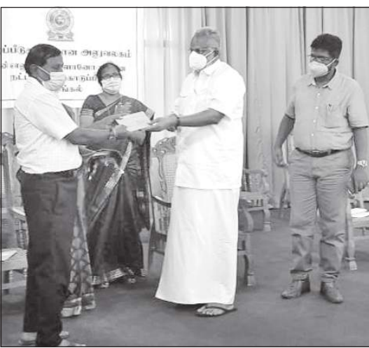
இதனைத் தெரிவித்தார். அங்கு அவர் தொடர்ந்தும் உரையாற்றுகையில், தேசிய நல்வினக்கத்தின் ஊடாக இருப்பதை பாதுகாத்து முன்