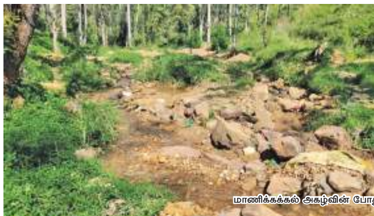
மாணிக்கக்கல் அகழ்வின் போது தோண்டப்பட்டு கைவிடப்பட்ட குழிகள்

கழுவப்பட்டு காசல் ரீ நிர்த்தேக்கத்திற்குள் வந்தடைவதால் நீர்த்தேக்கத்தில் சேற்று மண் நிறைந்து நோட்டன் விமலசுரேந்திர நீர் மின் நிலையத்தின் நீர்மின் உற்பத்திக்கு பாதிப்பை ஏற்படுத்துகின்றது. இதனால் நோட்டன் விமலசுரேந்திர நீர் மின் நிலையத்தில் மின் உற்பத்திக்காக சேமிக்கப்படும் நீரின் அளவினை குறைகின்றது. மேலும் நன்றி மீன் வளர்ப்பு திட்டத்தினூடாக தமது நாளாந்த வாழ்வாதாரத்தை கொண்டு செல்லும்