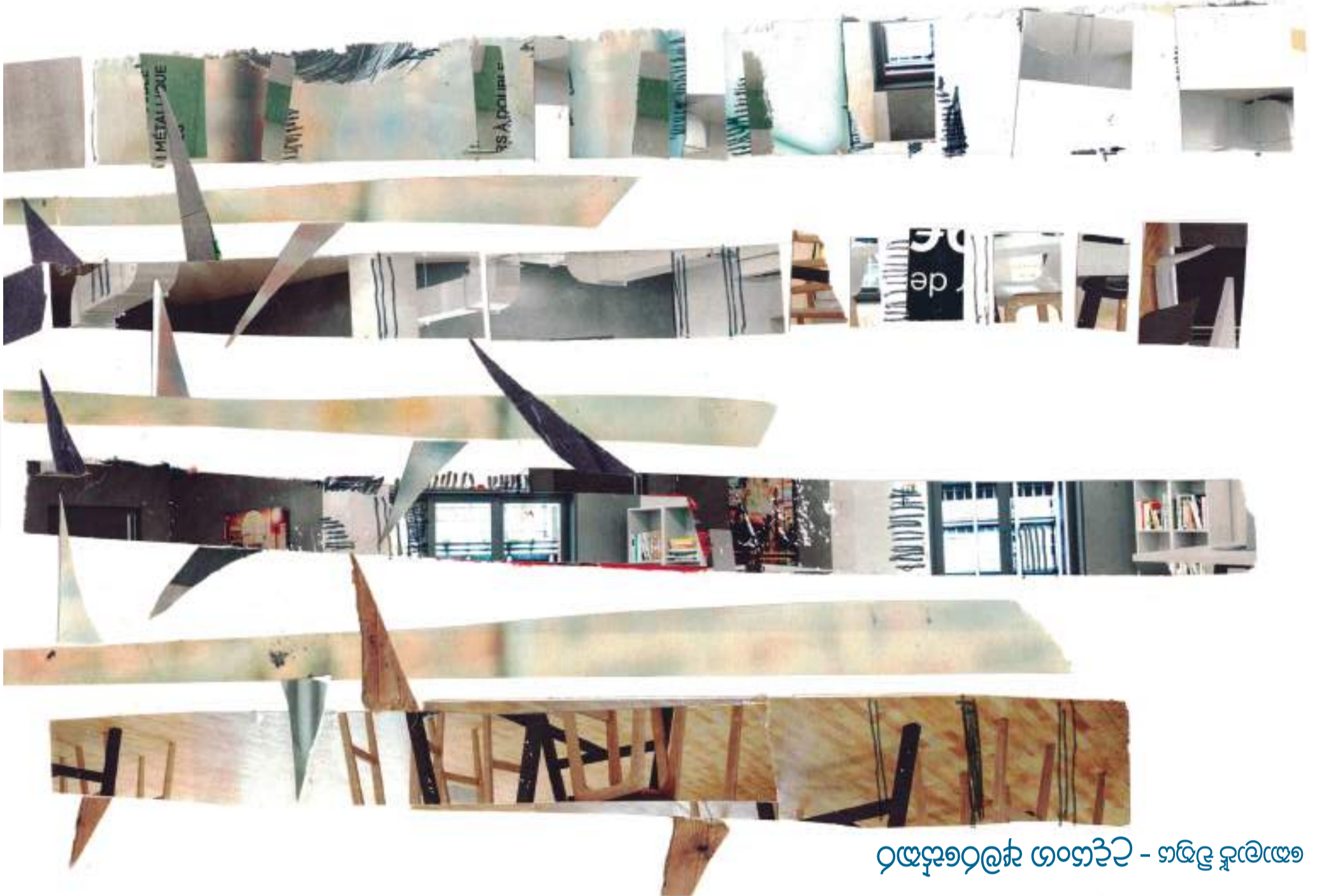
රඤ්ජනරක්ෂා ගංගාටිට - හඳිලි කුමාරයා