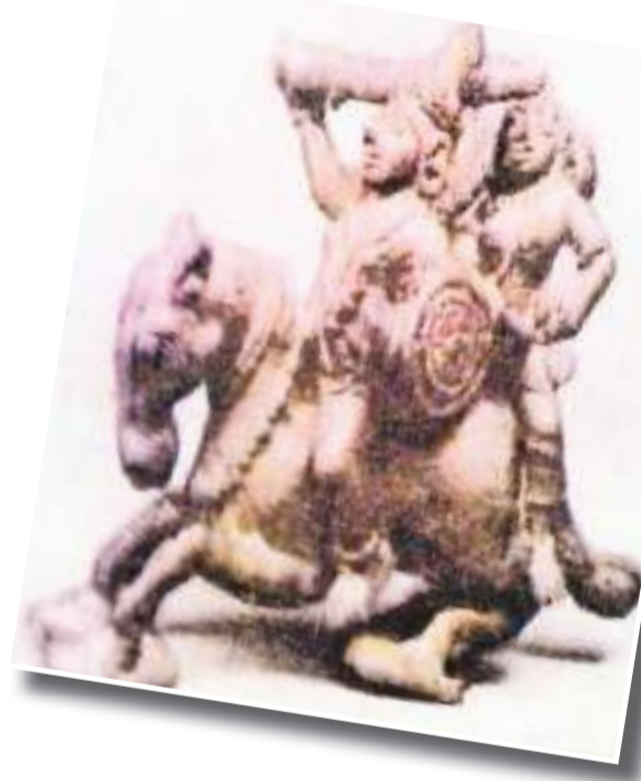
ධාතු ගර්භයේ තිබූ ලෝකඩ මුර්තියක් සහ විෂ්ණු, ශිව හා බුද්ධත්වය නිරූපිත සිතුවම්

බුදුපිළිම, ධාතු කරඬු, ලෝහමය පහන්, තඹ කළස්, තුන් පා දරුණු මහ කැපු සංඛ, පැරැණි කාසි, ආභරණ සහ මැණික් යනාදිය මෙරට පැරණි නිමවුම් ක්ෂේත්‍රයේ තාක්ෂණික පාර්ශ්වය කෙබඳු දැයි හෙළි කරන්නකි.