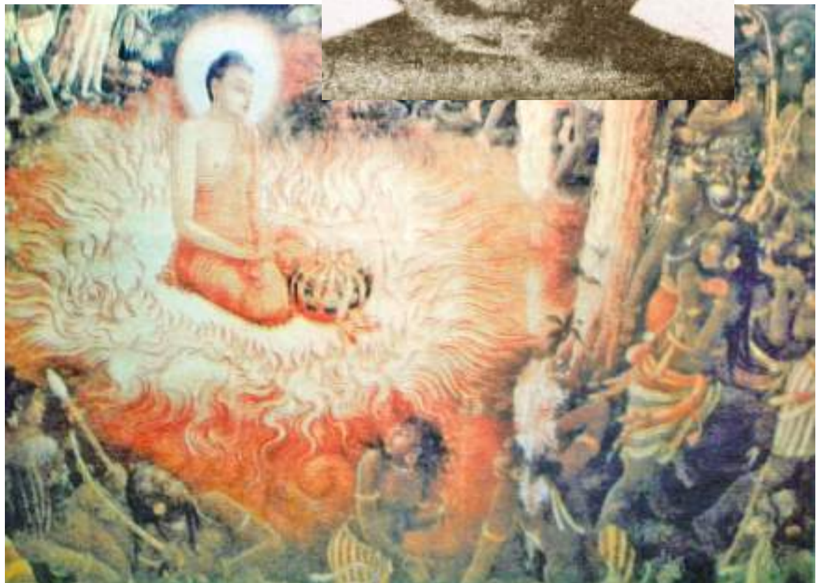
යක්ෂ දමනය සිතුවමක්.

දෙවන පැනිස් රජුගේ සහෝදර උද්වුලාභය කුමරු මහියංගණ ප්‍රදේශය පාලනය කළ අවදියේදී මහියංගණ දාගැබ දෙකිස් රියනක් උසට බඳවන ලදී. ගැමුණු කුමරු රුහුණේ සිට පැමිණ මහියංගණයේ කඳවුරු බඳ සිටි අවස්ථාවේ මේ දාගැබ සුසැට හෝ අසූ රියන් කොට බඳවන ලද බවත් සඳහන් වේ.