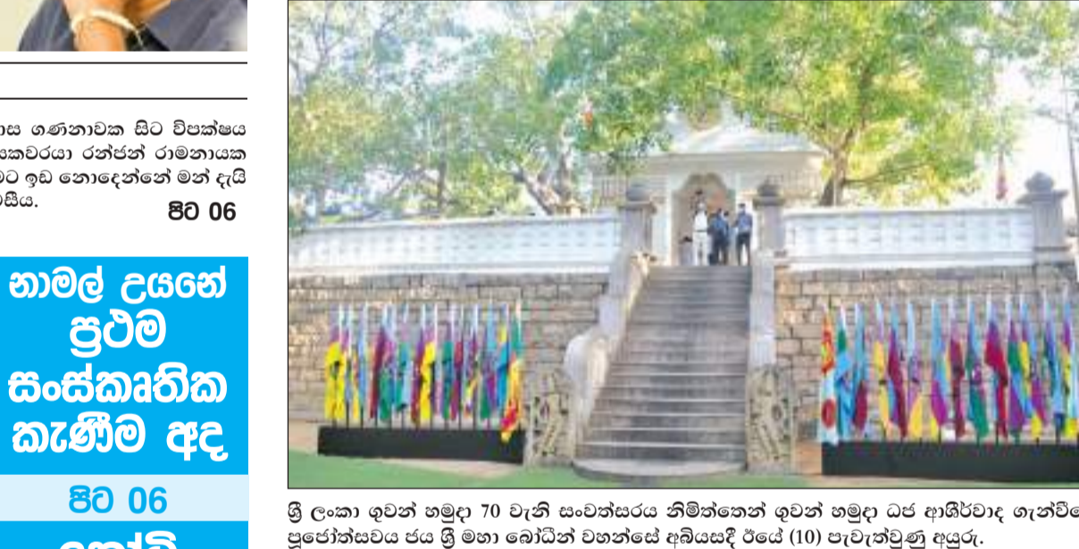
ශ්‍රී ලංකා අවන් හමුදා 70 වැනි සංවත්සරය නිමිත්තෙන් අවන් හමුදා ධජ ආශීර්වාද ගැන්වීමේ ප්‍රදර්ශන සවය ජය ශ්‍රී මහා බෝධීන් වහන්සේ අබයසේදී රජයේ (10) පැවැත්වුණු අයුරු.

රක්ෂණ ප්‍රියන්ත සහ සුභාමිණී සේනානායක රු. මිලදි කොට් 80කට ආසන්න වටිනාකමින් යුතු හෙරොයින් කිලෝ 75ක් සමඟ මහා පරිමාණයෙන් මත්ද්‍රව්‍ය ජවාරමේ යෙදෙන සැකකරුවකු සහ සැකකාරියක මාතර කොට්ඨාස අපරාධ විමර්ශන අංශයේ නීලධාරීන්ට ලද තොරතුරක් මත දෙයියන්දර පොලිස් වසමේ දෙනගම ප්‍රදේශයේදී රජයේ (10) අත්අඩංගුවට ගෙන තිබේ. 80 06