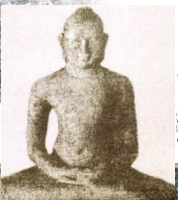
සැරවෙහි 5෧ ඊ මිටි උසක පැරණි බුදු පිළිමය