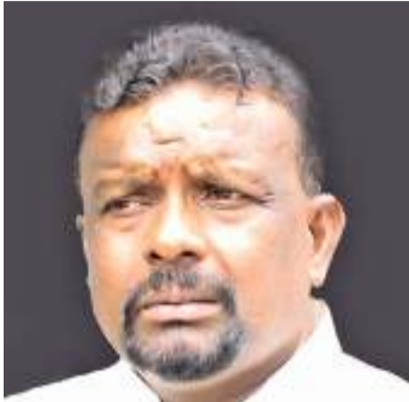
ඉඩම් ඇමැති එස්. එම්. චන්ද්‍රසේන

මේ වසරේ පමණක් ඉඩම් ඔප්පු එක් ලක්ෂ පනස්දහස්කට වැඩිවීමක් සිදුවන බව චන්ද්‍රසේන මහතා පවසා ඇත. 2021 දෙසැම්බර් මාසයේ 31 වැනිදා වන විට එක් ලක්ෂ පනස්දහස්කට ඔප්පු දෙන්න බලාපොරොත්තු වෙනවා.