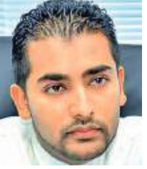
පිළිබඳ වගකීම භාර ගන්නවා කියා එදා මා පොරොන්දු වුණා. ඒ කිව්වා වගේම අද

එහිදී වැඩිදුරටත් අදහස් දැක්වූ රාජ්‍ය ඇමැතිවරයා මෙසේ ද කීය.