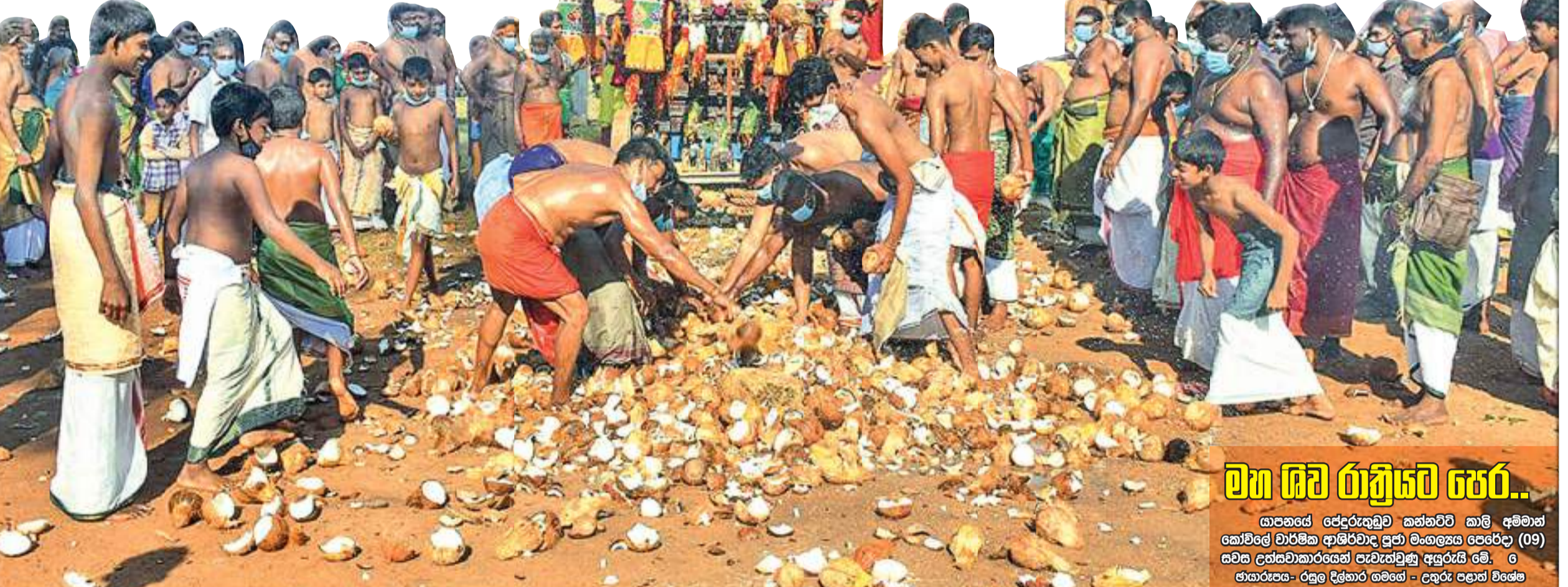
මහ ශිව රාත්‍රියට පෙර... ආසනයේ පේදුරුකුඩු කන්හවි කාලි අම්මන් කෝවිලේ වාර්ෂික ආශීර්වාද සුව මංගල්‍යය පෙරේලා (09) සවස උත්සවකාරයන් පැවැත්වූ අයුරු වේ. ශ්‍රී ජායාරාජය - රජු දිග්ගාර ගමගේ - උතුරු පළාත් විශේෂ

දැඩි ලෙස අලාභනානි වී එක් පුද්ගලයකු බරපතල තුවාල ලබා බදුල්ල මහ රෝහලට ඇතුළත් කළ බව බදුල්ල පොලීසිය පවසයි. පැවති වර්ෂාවන් සමඟ එක් වරම මෙම විශාල වැල්බෝධිය කඩා වැටීමෙන් මාර්ගයේ රථවාහන ධාවනය ඇතහිට තිබූ අතර නගරයේ විදුලි රහත් පද්ධතිය කඩා වැටීමෙන් නගරයේ විදුලි බලයද ඇතහිට තිබිණ. මෙහි තිබූ වෘද්ධ ප්‍රතිඵල වනන්සේට අලාභනානි වී නොමැත.