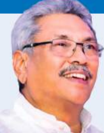
ශ්‍රී දළදා මාළිගාවේ ඇසළ පෙරහර මංගල්‍යය ඇතුළු සෛෂ්‍ය ජෛනිකාධික පෙරහර මංගල්‍යය සඳහා අවශ්‍ය හිලෑ

න්නැයි ජනාධිපතිවරයා මෙහිදී අදාළ නිලධාරීන්ට උපදෙස් දුන්නේය. හිලෑ අලි ඇතුන්ගේ හිගය නිසා පෙරහර මංගල්‍ය පැවැත්වීමේ දී මතු ව ඇති ගැටලු පිළිබඳ මෙහිදී ජනාධිපතිවරයාගේ අවධානයට යොමු විය. මෙම ගැටලුව විසඳීමට කෙටි කාලීන හා දීර්ඝ කාලීන වැඩපිළිවෙළක් අවශ්‍ය බව ද මහා සංසර්ගය මෙහිදී අවධාරණය කළහ. පෙරහර මංගල්‍යය අනිකුත් සිට පැවත එන දේශීය ආගමික හා සංස්කෘතික උරුමයකි. බෞද්ධ සංස්කෘතිකාංග සුරැකීමට මහා සංසර්ගය සේම ආණ්ඩුව ද බැඳී සිටින බව ද උන්වහන්සේලා පෙන්වා දුන්හ.