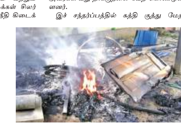
கவில்லை என்றும் பொலிஸார் போதுமான நடவடிக்கை மேற்கொள்ளவில்லை என்று தெரிவித்து பொலிஸாருடன் தர்க்கத்தில்