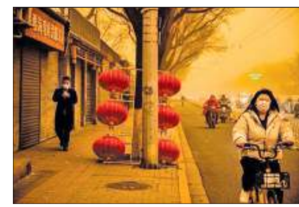
சீனத் தலைநகர் பீஜிங்கில் நேற்றுக் காலை மணல் புயல் வீசியதில் காற்றில் அடர்ந்த துகள்கள் படிந்துள்ளன. மங்கோலியாவில் இருந்தும் சீனாவின் வடமேற்குப் பகுதி

ஹெபெய் ஆகிய பகுதிகள் மோசமாக பாதிக்கப்பட்டன. சீனாவின் வானிலை ஆய்வுத்துறை நிர்வாகம் நேற்றுக் காலையில் அங்கு மஞ்சள் நிற எச்சரிக்கையை விடுத்துள்ளது. பீஜிங்கில் காற்றுத் தூய்மைக் கேடு அதிகப்பட்ச நிலையான 500 ஐ எட்டியது. சில பகுதிகளில் ஒரு கன மீற்றருக்குச் சுமார் 2,000 மைக்ரோகிராம் அளவான பீ.எம்10 துகள்கள் இருந்தன. நுரையீரலுக்குள் நுழையக்கூடிய பீ.எம்2.5 துகள்கள் கன மீற்றருக்கு 300 மைக்ரோகிராம் அளவில் இருந்தன. சீனாவின் வடபகுதியில் காடுகள் அழிக்கப்பட்டுள்ளதால், அதன்