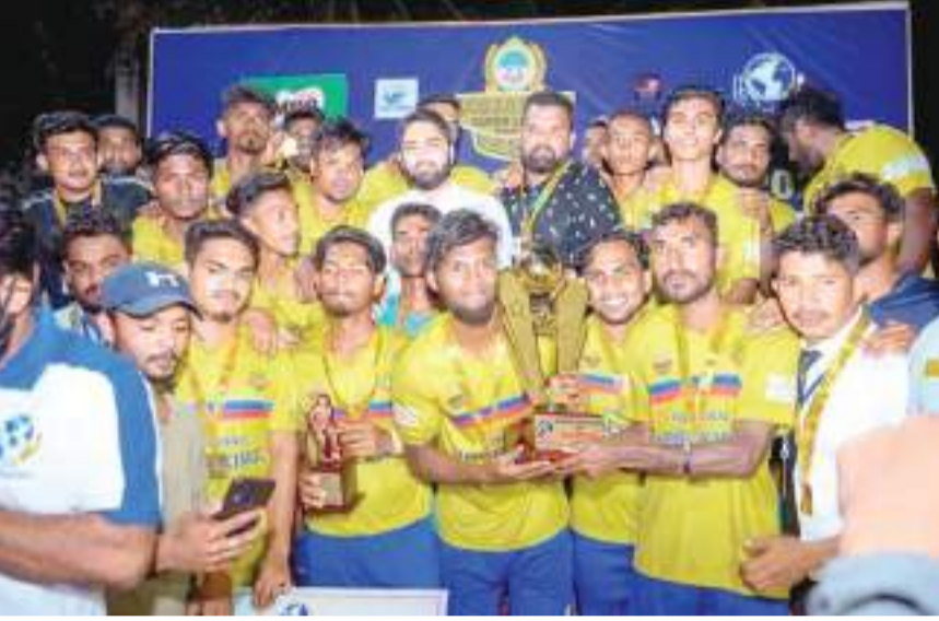
கிண்ணியா மத்திய நிருபர்

கிண்ணியா அக்செரியன் சுப்பர் லீக் உதைபந்தாட்ட சுற்றுத் தொடரை வெற்றி கொண்டு, 2021 ஆண்டின் சம்பியன் கிண்ணத்தை சுப்பர் கிங் அணி சுரீகரித்துக் கொண்டது. எட்டு அணிகள் பங்கு கொண்ட இந்த தொடரின் இறுதிப் போட்டி நேற்று (14) கிண்ணியா எழிலரங்கு மைதானத்தில் நடைபெற்றது. யூ என் வி நிறுவனத்தின் பிரதான அனுசரணையோடு நடைபெற்ற இந்த தொடரின் முதல் அரையிறுதி ஆட்டத்தில் சுப்பர் கிங் மற்றும் ஜூபிடர் ஆகிய அணிகள் மோதின. இதில் 3:1 என்ற கோல் அடிப்படையில் ஜூபிடர் அணியை வெற்றி