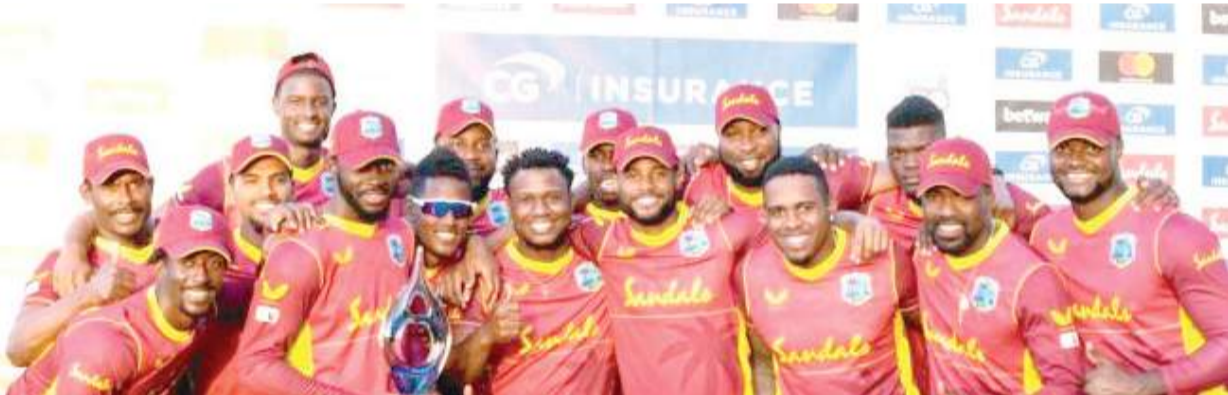
இலங்கை அணிக்கு எதிரான