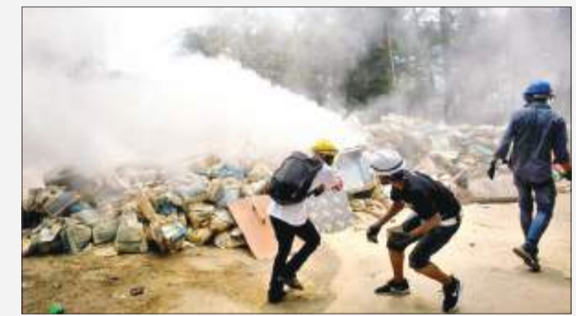
சோடிக்கப்பட்டவை என்று சூச்சி மின் ஆதரவாளர்கள் தெரிவித்துள்ளனர். இராணுவ சதிப்புரட்சியை

நாட்டில் இடம்பெறும் ஜனநாயக ஆதரவு ஆர்ப்பாட்டங்களில் ஜனநாயகத்திற்கான தேசிய லீக்கின் தலைவர் சூச்சியை விடுவிக்கும் படி கோரிக்கை விடுக்கப்படுகிறது. அவரது கட்சி கடந்த நவம்பர் மாதம் நடைபெற்ற தேர்தலில் அமோக வெற்றியீட்டியது. இராணுவம் ஆட்சியை கைப்பற்றிய கடந்த பெப்ரவரி 1 ஆம் திகதி தொடக்கம் சூச்சி அடையாளம் தெரியாத இடத்தில் தடுத்து வைக்கப்பட்டுள்ளார். அவர் மீது பல குற்றச்சாட்டுகள் சுமத்தப்பட்டபோதும் அவை