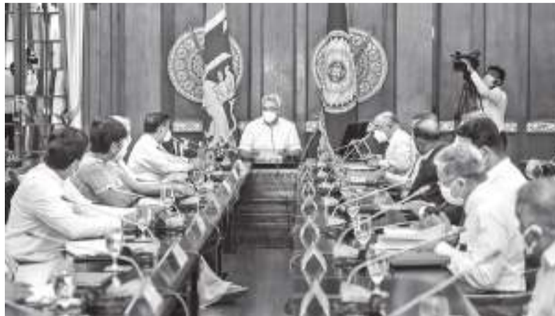
அமெரிக்க டொலர்களாகும். எதிர்பார்க்கப்படும் இலக்கை அடைந்து கொள்வதற்கு அர்ப்பணிப்புடன் செயற்படுவதாக வந்ததற்கு இதைப்போது ஜனாதிபதியிடம் உறுதியளித்தார்கள். சுகாதார நடைமுறைகள் காரணமாக இத்தொழிற்சாலைகளின் முன்னேற்ற பயணத்திற்கு ஏற்பட்டுள்ள சவால்கள் குறித்தும் வந்ததற்கு தெளிவுபடுத்தினர். நாட்டின் பொதுச் சுகாதார நிலைமை களுக்கு பாதிப்பு ஏற்படாத வகையில் ஆடைக் கைத்தொழிற்சாலைகளுக்கு சில சுகாதார பரிந்துரைகளை தளர்த்துவதற்கான வாய்ப்புகள் குறித்து ஆராய்வதற்கும் முன்மொழியப்பட்டது. இத்தொழிற்சாலையின் மனித வள பற்றாக்குறை குறித்து கவனம் செலுத்தப்பட்டதுடன், தரம் மற்றும் பாதுகாப்பான தொழில் வாய்ப்புகளை ஏற்படுத்துவதன் மூலம் இத்தொழிற்சாலைகளுக்கு இளைஞர், யுவதிகளை ஈர்க்க முடியும் என்றும் ஜனாதிபதி சுட்டிக்காட்டினார்.

இலங்கையின் ஏற்றுமதியை இலக்காகக் கொண்ட கைத்தொழிற்சாலைகளுக்கு மத்தியில் ஆடைக் கைத்தொழிற்சாலை முக்கிய இடம் வகிக்கின்றது. இலங்கையை உயர் தரம் வாய்ந்த ஆடைகளுக்கான உலகளவில் போற்றப்படும் தரச் சின்னமாக மாற்றும் வாய்ப்பும் கிடைக்கப்பெற்றுள்ளது. உள்நாட்டு ஆடைகள் தொழிற்சாலையில் புதிய தொரு எழுச்சியை ஏற்படுத்தி பாரிய அந்நியச் செலாவணியை ஈட்ட முடியும் என்றும் ஜனாதிபதி சுட்டிக்காட்டினார். இந்த இலக்கை அடைந்துகொள்வதற்காக அரசாங்கம் மிகுந்த ஈடுபாட்டுடன் செயற்பட்டு வருவதுடன், இதன்மூலம் இவ்வருடம் எதிர்பார்க்கப்படும் இலக்கு 5.1 பில்லியன்