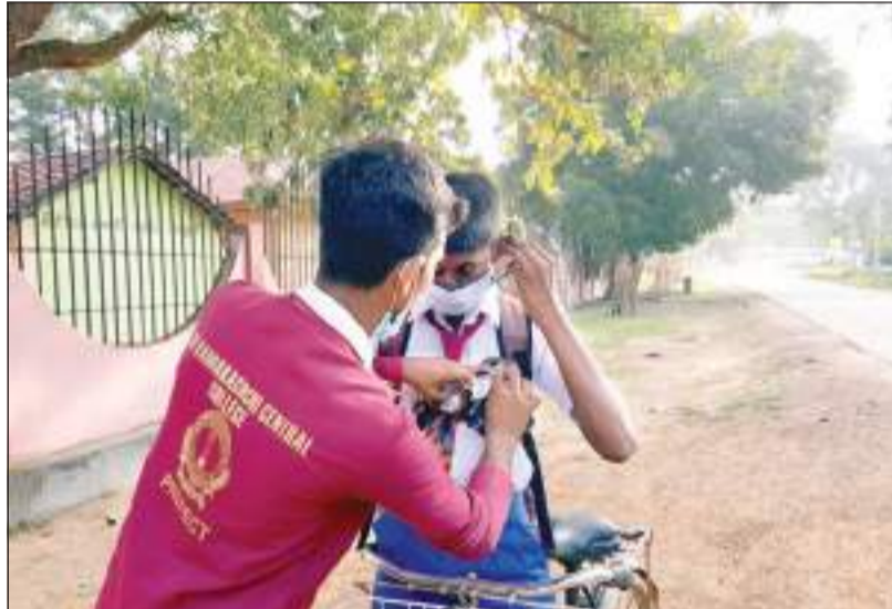
கிளிநொச்சி வட்டக்கச்சி மத்திய கல்லூரி மாணவர்கள் தங்களது பிரதேசத்தில் அதிகரித்துள்ள போதைப்பொருள் பரணைக்கு எதிர்ப்புத் தெரிவித்து நேற்று (15) விழிப்புணர்வு நடவடிக்கையில் ஈடுபட்ட போது...

அவரது சடலம் மீட்கப்பட்டுள்ளது. குறித்த நபர் பிள்ளைகள் திருமணம் செய்த நிலையில் வெளிநாடு மற்றும் வேறு பிரதேசத்தில் வசித்து வரும் நிலையில் தனித்து வாழ்ந்து வந்தவர் எனத் தெரிவிக்கப்படுகிறது. மரணம் தொடர்பான மேலதிக விசாரணைகளை சாவகச்சேரி பொலிஸார் முன்னெடுத்து வருகின்றனர். உயிரிழந்தவரது சடலம் பிரதேச பரிசோதனை மற்றும் மரண விசாரணைகளுக்காக யாழ்ப்பாண வைத்தியசாலைக்கு அனுப்பி வைக்கப்பட்டிருப்பதாகத் தெரிவிக்கப்படுகிறது.