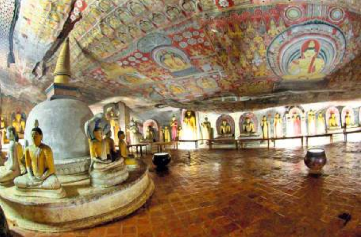
දැමූල්ලේ නළ වියනේ සිතුවම