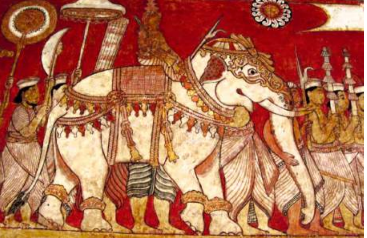
දෙවරගමිපල සිල්වත්තනා ඇඳ ඇතැයි සැලකෙන සිතුවමක්