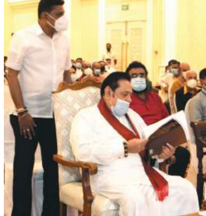
අගමැතිවරයා 'ප්‍රේක්ෂා' රක්ෂණ ඔප්පුවක් කියවමින්