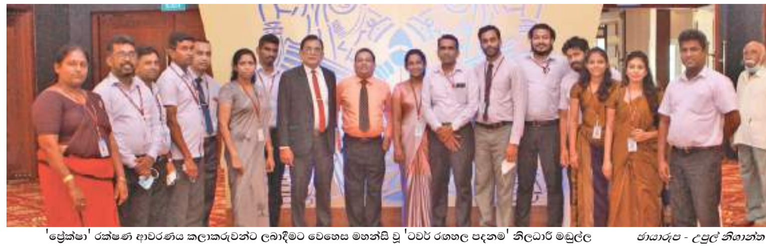
'ප්‍රේක්ෂා' රක්ෂණ ආවරණය කලාකරුවන්ට ලබාදීමට වෛශ්‍ය මහන්සි වූ 'ටවර හෝල් පදනම' නිලධාරී මධුලේ