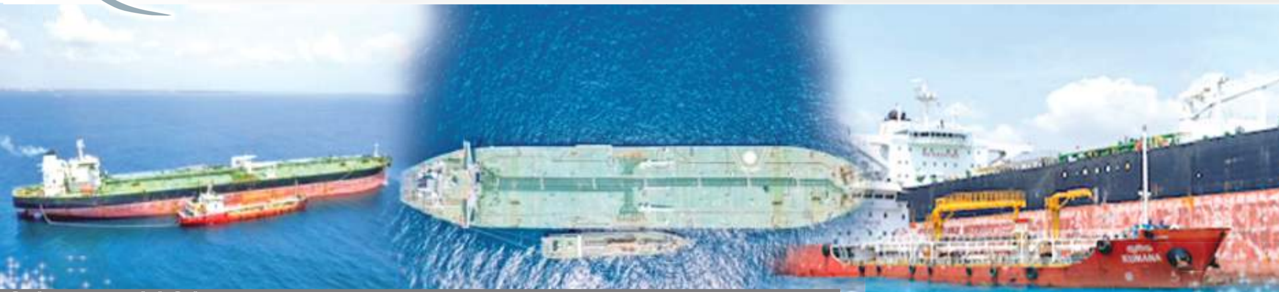
ඩී. එස්. ඉණතිලක උපව වෙල්ලස්ස විශේෂ