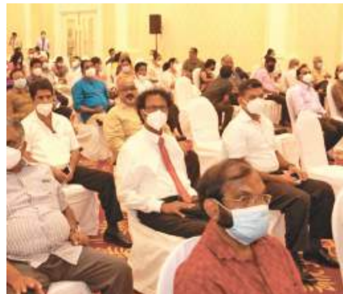
උලෙළට පැමිණි කලාකරුවෝ