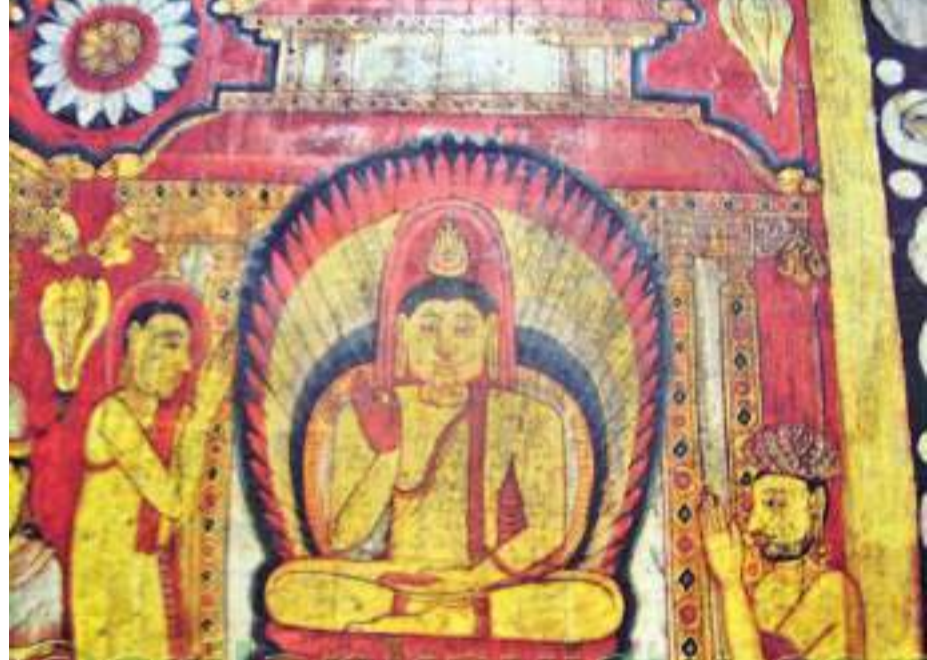
රිදී විහාරයේ සිතුවමක්

මහනුවර සම්ප්‍රදායේ සිතුවම් කලාව ව්‍යාප්ත කළ සිත්තර පරම්පරා ගණනාවක් හඳුනාගත හැකිය. ඒ අතරින් භිලවල, හිලගම, උල්ලපිටිය, කාමෝලගලල හා දේවිභ්‍රම ඉලාවාරි ආදී පරම්පරා කැපී පෙනේ. මෙම යුගයේ දී විහාර බිම තෙලිඳුරෙන් දැක්වූ පෘථිවි ගිනිගින් පමණක්ම කොටේ. උඩරටින් ඇරැඹි ආගමික ප්‍රවේශයන්, පහතරින් ඇරැඹි ආගමික පරිණාමයන් හමුවේ යුගයේ අවශ්‍යතාව මතම වටහාගත් හිතැතිව ව්‍යාප්ත වූ උඩරට දේශනාවෙන් පමණක් නොව තමන්ගේ නිර්මාණශීලී හැකියාවෙන් ද පෘථිගජන ජනයාට දහම සමීප කරවීමට උත්සුක වූහ. එසේ තෙලිඳුරෙන් ධර්මය ප්‍රචාරය කළ පෘථිවි සිත්තරා ගණනාවක්ම හඳුනාගත හැකි වේ.