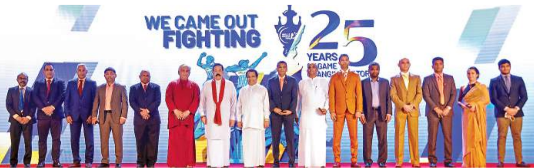
ශ්‍රී ලංකාව ලෝක ක්‍රිකට් කුසලානය දිනා වසර 25ක් ගත වීම නිමිත්තෙන් එම ක්‍රිකට් ඉරියව්වට උපහාර පිදීමේ උත්සවයක් රියේ (17) අරලියගහ මන්දිරයේදී පැවැත්විණි. එහිදී 1996 වසරේ විජයග්‍රාහී ක්‍රිකට් කණ්ඩායමේ සාමාජිකයන් අගමැති මහින්ද රාජපක්ෂ මහතා සමඟ ඡායාරූපයකට පෙනී සිටි අයුරු.