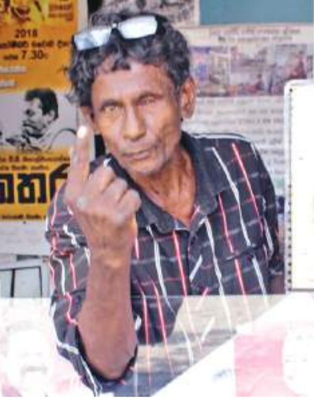
මුලින්ම මට පැරුවුණේ මිනිමරු අස්සයක් මෙල්ල කරන් උඩ දුටුවන්නයි. මං අමාරුවෙන් ඒ වැඩේ කළා. ඒකට ඒ රට පුරු වුණා. මං ඒ රටේ අයට අස්ස රේස් පුරුදු කරවන්නයි ගියේ. ඒ සතුටට එයාලා මට පොරොන්දු වුණු රුපියල් 20,000 පඩිය 30,000 ක් කරලා ගෙවිවා. අද වනතුරු මං මගේ තාත්තා දුන්න උපදෙස් සිහි කරනවා. මං පෙවීමට එකේ ඉදන් ඉන්නවා දැකලා තාත්තා මට 'පුතේ උම බපාර් එකේ බිම ඉදගන්නට කමක් නැ. හැබැයි හැදෙන්න උම දැන ගනින්න. මට ඒ ගැන අතීන් මිනිහට දොස් කියන්න බැහැ' කියලායි කිවුවේ. මං කට්ටවත් කාගේවත් දෙයක් අසාධාරණ විදියට කඩා වඩාගෙන නැහැ.

ඉස්සරේම මගේ ඉහට ගහලා තිබුණේ පොතියෝ පිස්සුව. කොමපක්කේ විදියේ සැරපුත්ත ඉස්සෝලෙට මං දෙකේ පන්නියේදී ආසුබෝ කිව්වා. එදා ඉදන් ඉලන්දාර් කාලේ පොතියෝ එක්කමයි මං ඔට්ටු වුණේ. මං නුවරඑළියේ මුලින්ම අස්ස රේස් පැද්ද කීප දෙනාගෙන් කෙනෙක්.