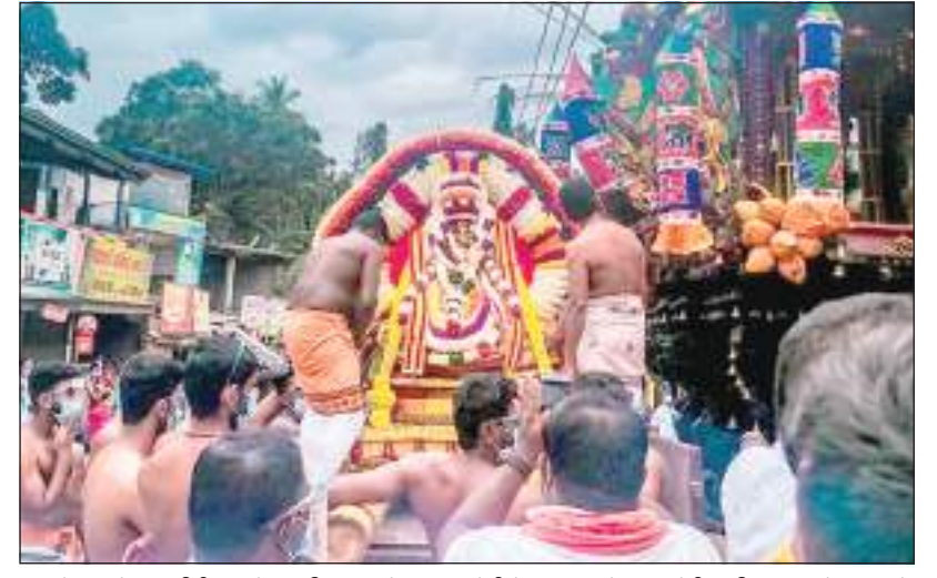
ஊர்த்தோட்டை பிரி எல்வ விநாயகர் ஆலயத்தின் வருடாந்த தேர்திருவிழா நேற்று முன்தினம் நடைபெற்ற போது எடுக்கப்பட்ட படம்.

நல்லாட்சி அரசாங்கத்தால் உட்கட்டமைப்பு வசதிகள் ஏற்படுத்திக்கொடுக்கப்படவில்லை. இன்றளவிலும் அம்மக்கள் பல்வேறு இன்னல்களுக்கு மத்தியிலேயே வாழ்கின்றனர். எனவே, இராஜாங்க அமைச்சர் ஜீவன் தொண்டமான் தமக்கு தீர்வை பெற்றுக்கொடுக்க வேண்டும் என