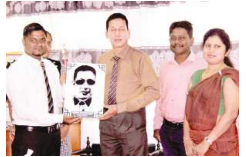
(ரொட்டவெல குரூப் நிருபர்)