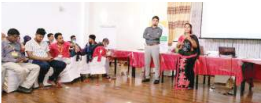
திருமலை மாவட்ட விசேட நிருபர்

திருக்கோணமலையில் இளைஞர், யுவதிகளுக்கான பாஸ் நிலை சமத்துவம் மற்றும் மொழி உரிமை தொடர்பான இரு நாள் பயிற்சி பட்டறை கடந்த 27,28 ஆகிய தினங்களில் இடம் பெற்றது. இப் பயிற்சி பட்டறையில் சமூக மட்டத்தில் காணப்படுகின்ற மொழி முரண்பாடுகளை குறைப்பதற்கான இளைஞர்களின் வகிபாகம், பன்மைத்துவ தலையீடு ஊடான இளைஞர் மேம்பாடு, அரசு பொறிமுறை தொடர்பிலான முன்னெடுப்பு, இரண்டாம் மொழி உள்ளிட்ட பல விடயங்கள் விரிவுரைகளாக வழங்கப்பட்டன. இச் செயலமர்வுக்கான வளவாளர்களாக இச் செயலமர்வுக்கான வளவாளர்களாக