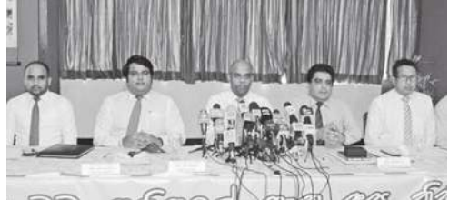
நிறுவன உயரதிகாரிகள் கலந்து கொண்டனர்.

இதன் அறிமுக நிகழ்வு வெள்ளத்தை சபையர் ஹோட்டலில் அண்மையில் நடைபெற்றது. இந்நிகழ்வில் தெங்கு உற்பத்தியாளர் சங்கம் மற்றும் செலின்கோ காப்புறுதி