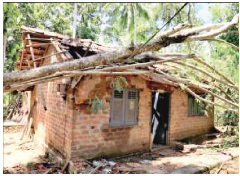
கிராஜாங்களை யாய 06 மற்றும் 07 பிரதேசங்களில் நேற்று முன்தினம் (28) இரவு ஏழு மணிளவில் கடும் காற்று வீசியது. இதில் சேதமடைந்த வீடு ஒன்றை படத்தில் காணலாம்.