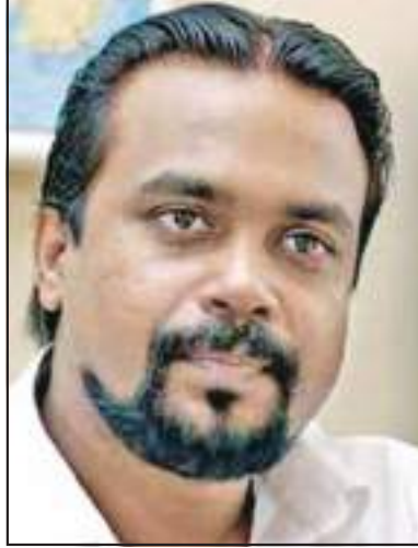
(ஹம்பந்தோட்டை குறாப் நிருபர்)

திஸ்ஸமகாராமை, கிரிந்தை கனிய மணலை அரசாங்க நிறுவனம் ஒன்றிடம் ஒப்படைப்பதற்கு நடவடிக்கை எடுப்பதாக கைத்தொழில் அமைச்சர் விமல் வீரவன்ச தெரிவித்தார். தில்லமகாராமை, கிரிந்தை பிரதேசத்தில் உள்ள கனிய மணலை அகழ்தல் தொடர்பாக பிரதேசவாசிகளுடன் நடைபெற்ற கலந்துரையாடலிலே அமைச்சர் இதனைத் தெரிவித்தார். தில்லமகாராமை கிரிந்தை யால சந்தியில் உள்ள சரசமுகநிலையத்தில் இக்கலந்துரையாடல் நடைபெற்றது. இதில் உரையாற்றிய அமைச்சர்