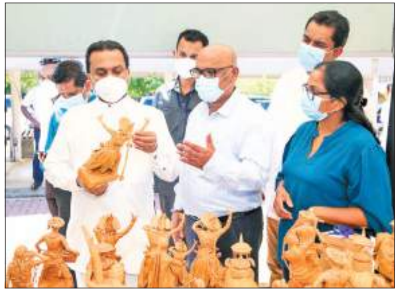
உள்நாட்டு இளம் தொழில்முயற்சியாளர்களின் புதிய உற்பத்திகளை சந்தைக்கு அறிமுகப்படுத்தும் விற்பனை கண்காட்சி, தியதயனவில் நடைபெற்றது. கைத்தொழில் அமைச்சர் விமல் வீரவன்ச கண்காட்சியை பார்வையிடுவதை காணலாம்.