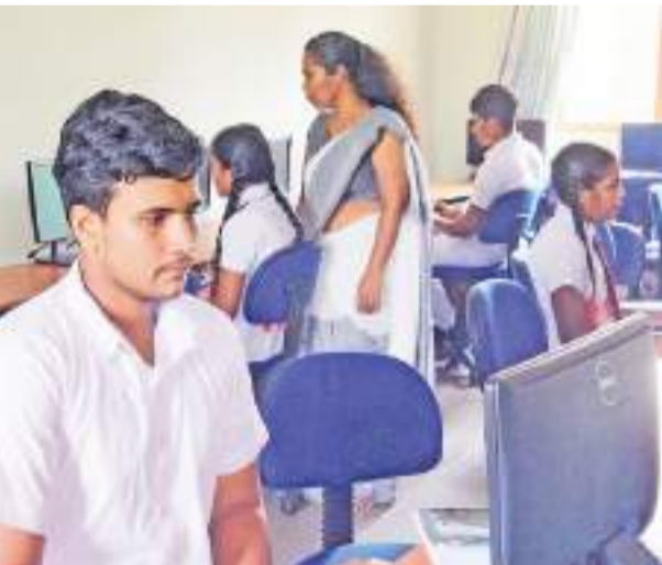
මහින්දාදේවිය තාක්ෂණික විද්‍යාගාරයේ පරිගණක අධ්‍යාපනය ලබන සිසුන් පිරිස