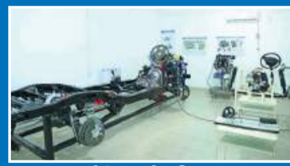
මෝටර් රථ කාන්තෘ විද්‍යාගාරය