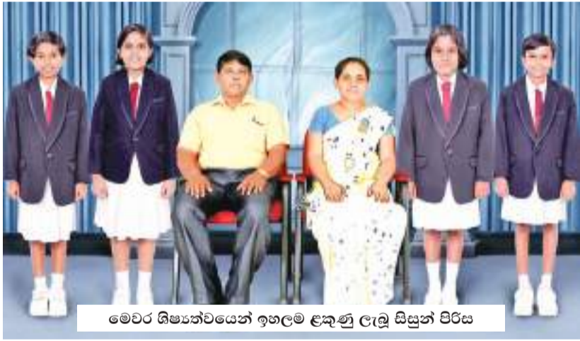
මෙවර ශිෂ්‍යත්වයෙන් ඉහලම ළඟු ළඟු සිසුන් පිරිස