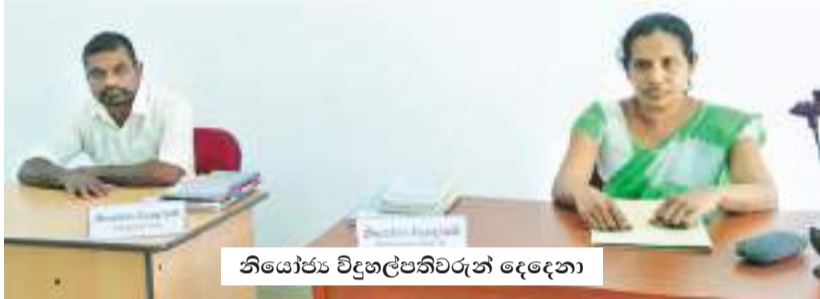
නියෝජ්‍ය විදුහල්පතිවරුන් දෙදෙනා