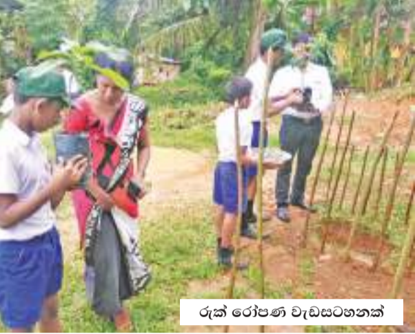
රූක් රෝපණ වැඩසටහනක්