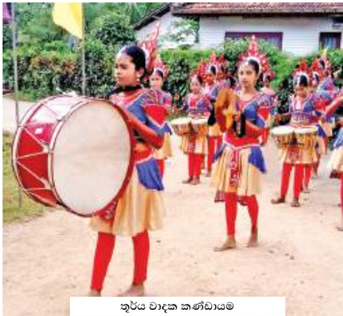
තුර්ව වාදක කණ්ඩායම