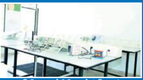
විදුලි හා ඉලෙක්ට්‍රොනික කාන්තෘ විද්‍යාගාරය