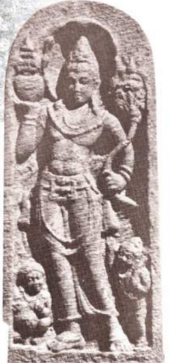
ගිරිහඬු සෑයේ මුරලත

බුදු හිමියන් සත් ගොවි සමවර්ග හැඟී සිටි දිනයේ අරුණොදයේ දඹදිව උක්කලා නුවර සිට මධ්‍ය දේශයට වෙළෙඳාමේ යමින් සිටි තපස්සු - හල්ලුක දෙසොහොසුරන්ට බුදුන් වහන්සේ දක්වන ලදී ඇතැයි පවසාගත් සඳහන් වේ. ඔවුන් සතුව තිබූ විලද හා මී පැණි බුදුන් වහන්සේට පිළිගැන්වූ ධවත් පළමුවරට තොරවත් සරණ ගිය උපාසකයන් ධවට පත්වූ ඔවුන්ගේ ගුල්ලිම මත බුදුන් වහන්සේ සිරස පිරිමැද කෙස ධාතු මිටක් ඔවුන්ට දුන් ධවත් සඳහන් වේ.