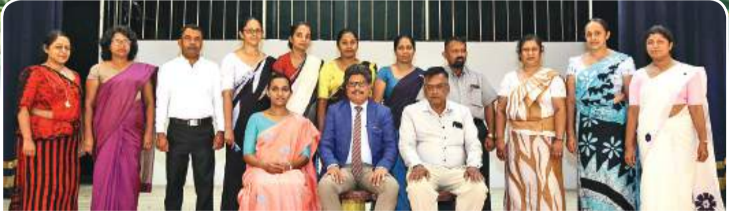
විදුහල්පතිතුමා, නියෝජ්‍ය විදුහල්පතිවරු සහ සහකාර විදුහල්පතිවරු