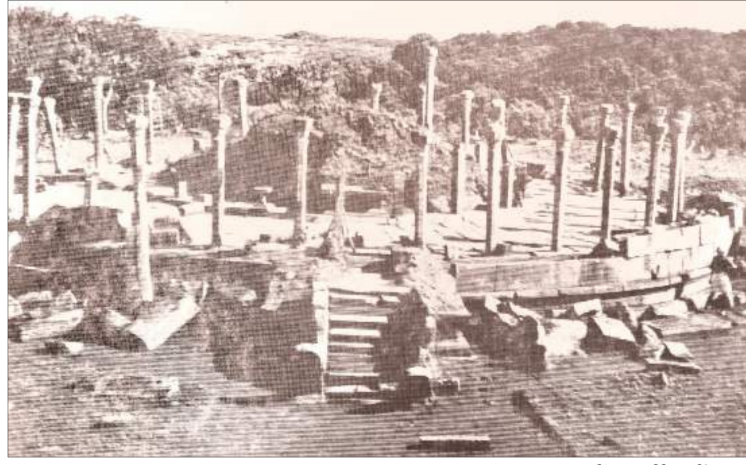
ගිරිහඬු සෑය පිළිසකර කිරීමට පෙර

තපස්සු - හල්ලුක වෙළෙඳ දෙබෑයන් එදා වෙළෙඳ සංචාරයේ යෙදේදී ලක්දිව නැගෙනහිර වෙරළට ගොඩ බැස 'ගිරිකණ්ඩ' පෙදෙසේ උස් බිමක කේශ ධාතු සහිත කරඬුව තැන්පත් කර අනතුරුව ඉන් කේශ ධාතු ස්වල්පයක් රැගෙන බුරුම රටට ගෙන ගියා වන්නට ද පුළුවන. ඒ අනුව බුරුමයේ ස්වේදගොන් වෙහෙරයේ කේශ ධාතු 8ක් තැන්පත් කළායැයි සිතන්නට ද පුළුවන.