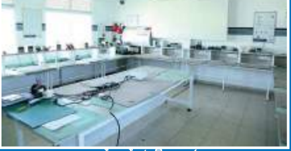
උසස් කාන්තෘ විද්‍යාගාරය

1995 වසරේදී ගෘහස්ථ බැඩ්මින්ටන් ක්‍රීඩාගාරයකින් ඇරඹුණු ගම්පහ තරුණ සංවර්ධන මධ්‍යස්ථානය වර්තමානය වන විට එවැනි බැඩ්මින්ටන් ක්‍රීඩා පිටි 7කින් සමන්විත තරුණ තරුණියන්ගේ හැකියා මෙන්ම ආකල්ප වර්ධනය කරන මධ්‍යස්ථානයක් බවට පත් වී අවසන්ය. ගම්පහ තරුණ සංවර්ධන මධ්‍යස්ථානයේ නිව්මාතෘ විශේෂයෙන් වෛද්‍ය විල්ලුඩී විජේසිංහ මහතා, නවලොක සමූහ ව්‍යාපාරයේ අධිපති දේශබන්දු දේශමානස එච්. කේ. ධර්මදාස මහතා සමඟ එක්ව එවකට ගම්පහ ප්‍රදේශයට අඩු-පාඩුවක්ම පැවති පිහිනුම් තටාකයක අවශ්‍යතාව ද සපුරන ලදී. ඉන් අනතුරුව 1997 වසරේදී දරුවන් දස දෙනකුගෙන් ඇරඹී විශාල ජාත්‍යන්තර පෙරපාසල කුඩා දරුවන්ට නැණ පහත් දල්වනා ගම්පහ දිස්ත්‍රික්කයේ ප්‍රමුඛ පෙළේ පෙරපාසලක් බවට කෙටි කාලයකදී පත්වන්නේය.