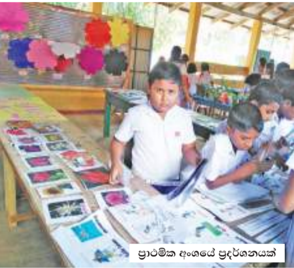
ප්‍රාථමික අංශයේ ප්‍රදර්ශනයක්