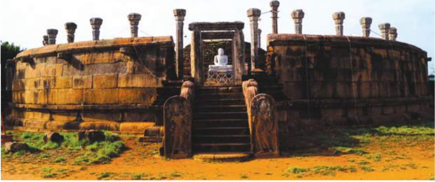
ගිරිහඬු සෑයේ වටඳාගෙය