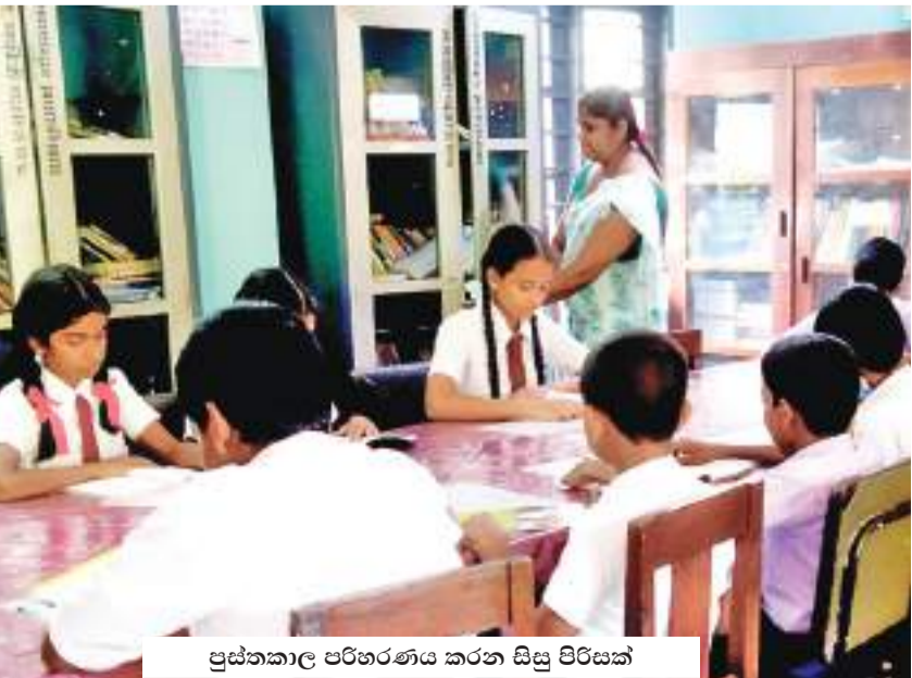
පුස්තකාල පරිහරණය කරන සිසු පිරිසක්