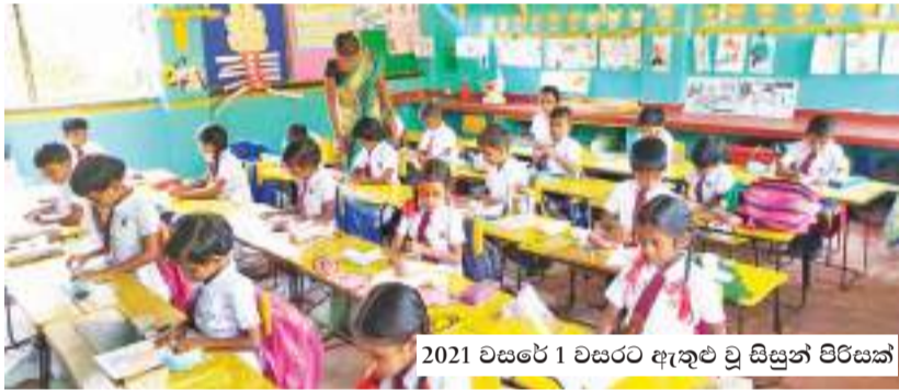
2021 වසරේ 1 වසරට ඇතුළු වූ සිසුන් පිරිසක්