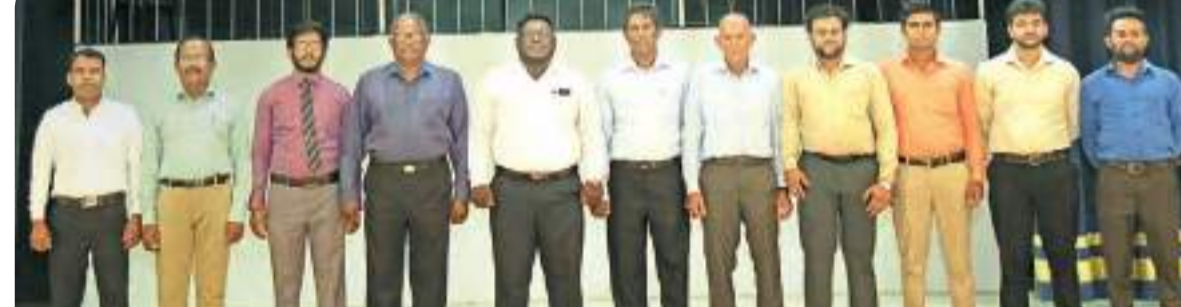
ද්විතියික අංශයේ ගුරු මණ්ඩලය

සහ ගුරුවරුන් නිදෙනු ලබන දුරකථන මගින් විවිධ බාධක, දුෂ්කරතා මැද ආරම්භ කළ සුමේධ විද්‍යාලය වර්තමානයේ ගුරුවරුන් 250කගේ මගපෙන්වීමෙන් දරුවන් 4000කට වැඩි සංඛ්‍යාවකට නව ලොවට අවශ්‍ය පරිපූර්ණ අධ්‍යාපනයක් සපයන පාසලක් බවට පත් වී ඇත.