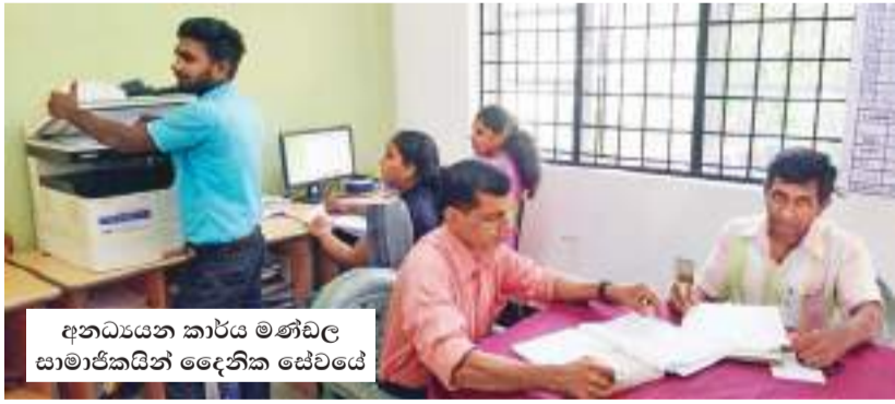
අතධ්‍යයන කාර්ය මණ්ඩල සාමාජිකයින් දෙදෙනික සේවයේ