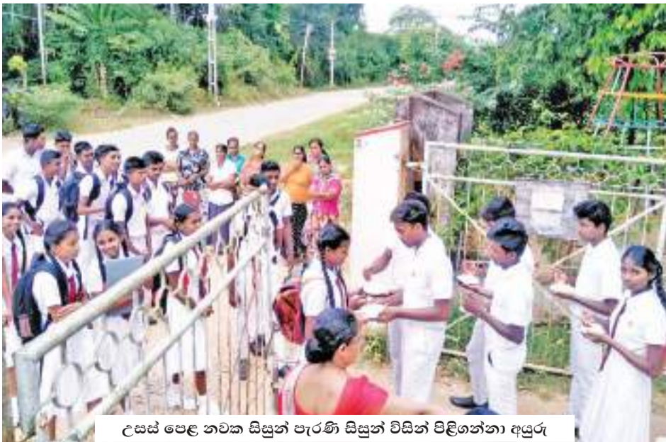
උසස් පෙළ නවක සිසුන් පැරණි සිසුන් විසින් පිළිගන්නා අයුරු