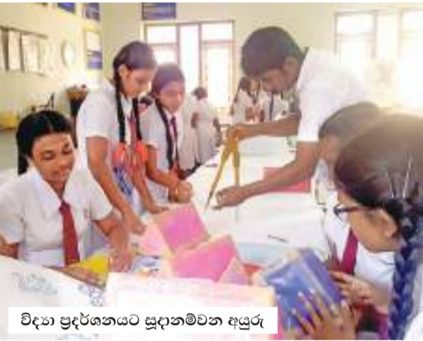
විද්‍යා ප්‍රදර්ශනයට සූදානම්වන අයුරු