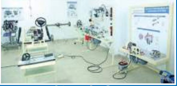
මෝටර් රථ කාන්තෘ විද්‍යාගාරය