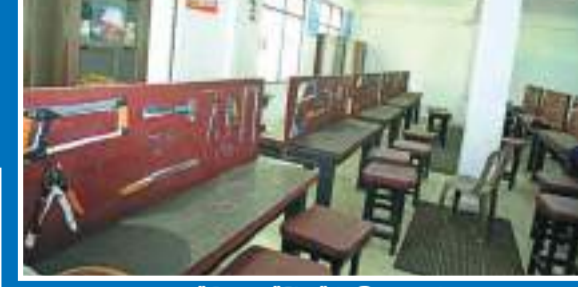
යාන්ත්‍රික ඉන්ජිනේරු විද්‍යාගාරය