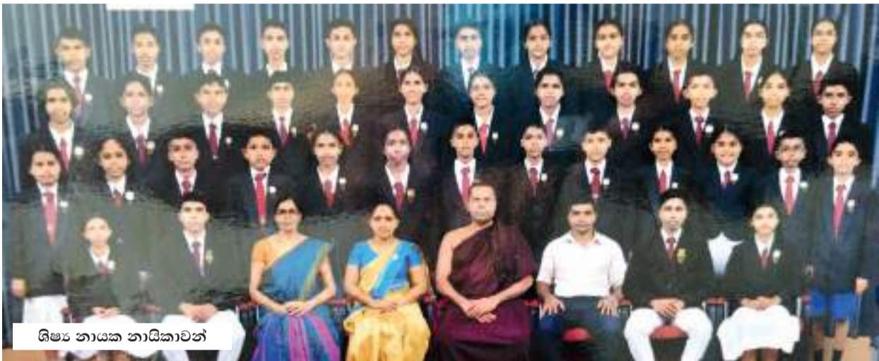
ශිෂ්‍ය නායක නායිකාවන්