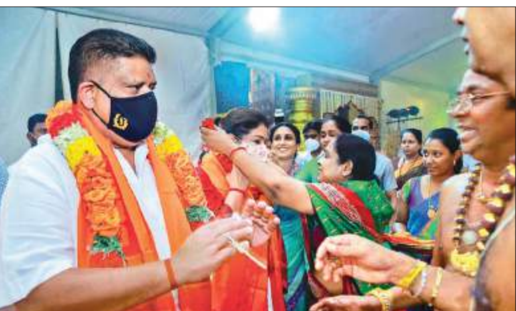
வெள்ளத்தை மயூரபதி ஸ்ரீ பத்திரகாளி அம்பாள் தேவஸ்தான கும்பாபிஷேகம் நாளை ஞாயிறுக்கிழமை நடைபெறுவதை முன்னிட்டு ஆலய வடக்கு கோபுர வாயிலில் அமைக்கப்பட்ட மகாகாளி சிற்பம் இராணுவத் தளபதி சவேந்திர சில்வாவினால் உத்தியோகபூர்வமாக நேற்று முன்தினம் (01) திறந்து வைக்கப்பட்டது.