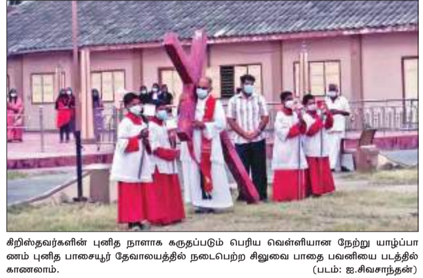
சிறிஸ்தவர்களின் புனித நாளைக் கருதப்படும் பெரிய வெள்ளியான நேற்று யாழ்ப்பாணம் புனித பாஸையூர் தேவாலயத்தில் நடைபெற்ற சிலுவை பாதை பவனியை படத்தில் காணலாம்.