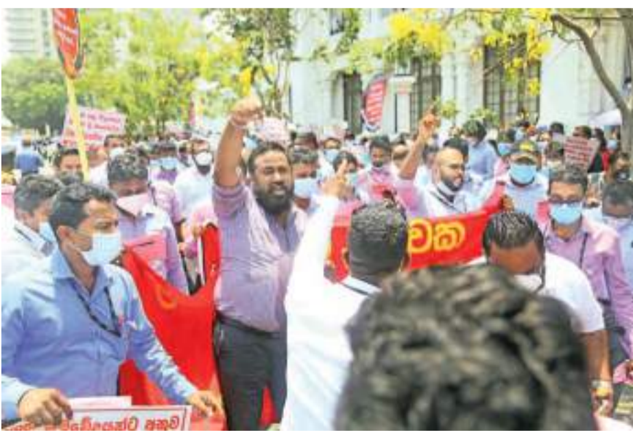
රාජ්‍ය බැංකු සේවකයන් තම විග්‍රාම වැටුප් හා තවත් ඉල්ලීම් කීපයක් ඉල්ලා ඊයේ (8) ලේකම්වලය ආයතනය ඉදිරිපිට උද්ඝෝෂණයක නිරත වූ සුදුරු.

මධ්‍යයේ, අඩු පොලී අනුපාතික ව්‍යුහයක් පවත්වාගෙන යෑම සහ එමඟින් ආර්ථිකය නිරසර ලෙස යථා තත්වයට පත්වීම සඳහා අඩුනිධිව සහාය වීම සහතික කිරීම සඳහා මුදල් මණ්ඩලය කැප වී සිටින බවද මහ බැංකුව කියා සිටී. ප්‍රතිපත්ති උත්තේජක ක්‍රියාමාර්ග සහ කොවිඩ් 19 එන්නත්කරණයේ සහාය මත ගෝලීය ආර්ථිකය අපේක්ෂිත මට්ටමට වඩා වේගයෙන් යථා තත්වයට පත්වනු ඇතැයි ද ශ්‍රී ලංකා මහ බැංකුව අපේක්ෂා කරයි.