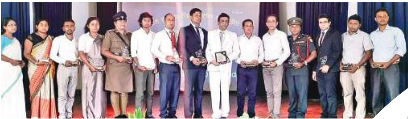
විලයා විදුහලෙන් බිහි වූ පිහිටි ආදි සිසුන් ඇගයීම