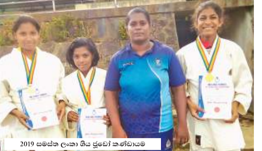
2019 සමස්ත ලංකා ගිය ප්‍රථම කණ්ඩායම