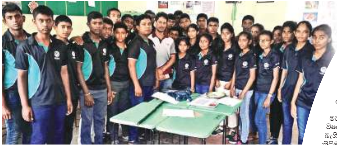
නව නිපැයුම්වලට දක්කම් දක්වූ සිසු දරුවන්.