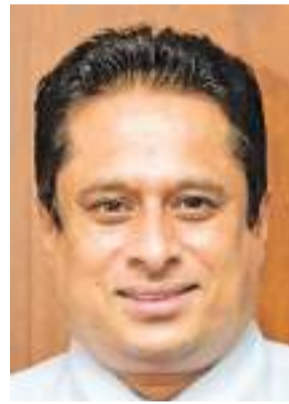
උච්ච පළාත් පාලන කොමසාරිස් මංගල විජේනායක