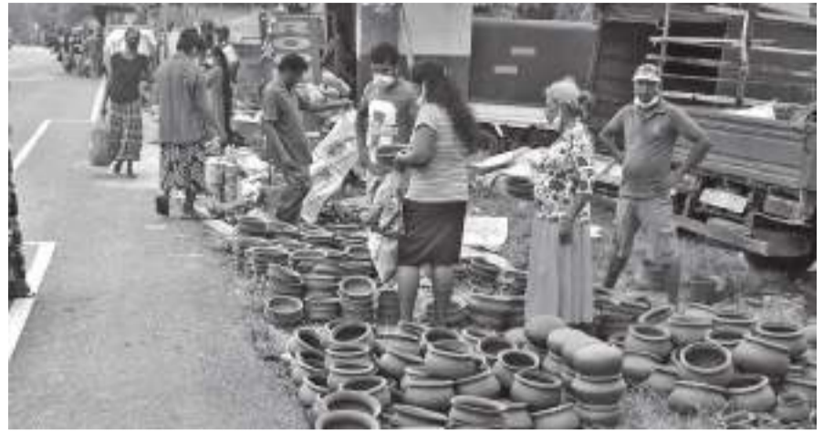
මොන අඩු පාඩුකම් තිබුණත් සිය දරුමල්ලන් සමඟ එක්වී සිංහල අලුත් අවුරුද්ද සැරසීමට හැම දෙනාම පාහේ උත්සාහ කරති. අවුරුද්දට කිරීමක් උයා ගන්නට අලුතින් හැඳි වළන් මිලදී ගැනීම ද අපේ අමතලාගේ පුරුද්දකි. අම්බලන්ගොඩ මාරුමසේ බදාදා පොළට පැමිණි ගෘහණියන් අලුත් හැඳි වළන් මිලදී ගැනීමට අමතක කළේ නැත. මේ එවැනි අවස්ථාවකි.