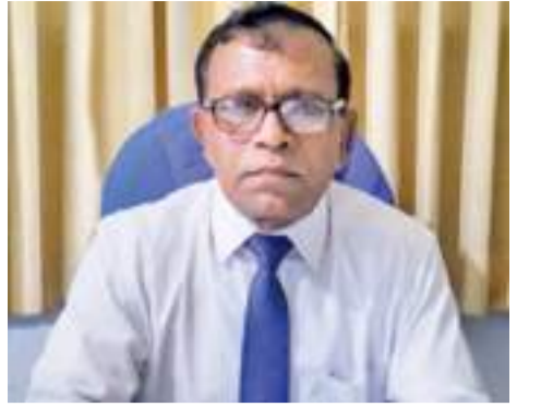
ඌව පළාත් අධ්‍යාපන අධ්‍යක්ෂ