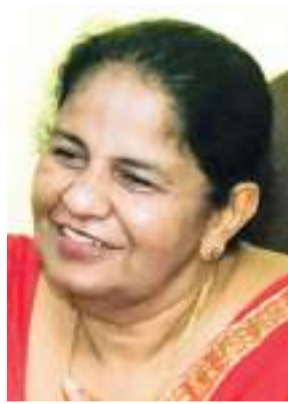
උච්ච පළාත් පාලන ලේකම් සන්ධ්‍යා අඹන්විල