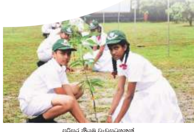
පරිසර නියැලී වැඩසටහනක්