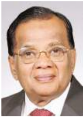
උච්ච පළාත් ආණ්ඩුකාර ඒ.ජේ.එම් මුසම්මිල්