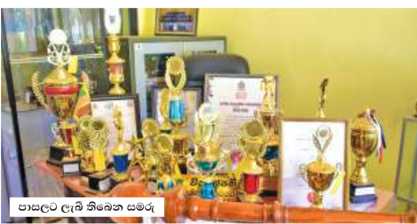
පාසලට ලැබී තිබෙන සමරු