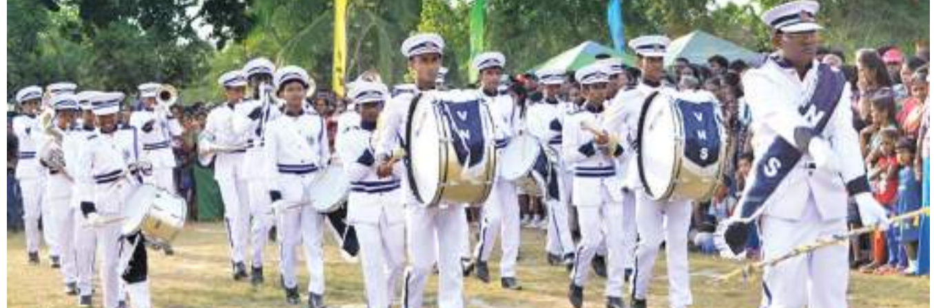
පාසලේ තුර්වවාදක කණ්ඩායමේ සංදර්ශනයක්