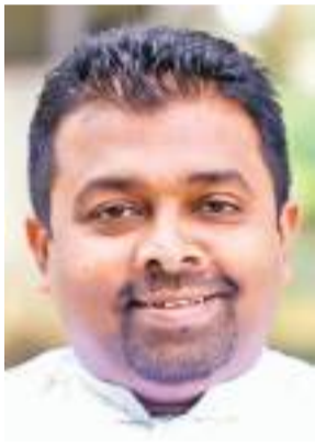
සභාපති වමින්ද පුෂ්පකුමාර