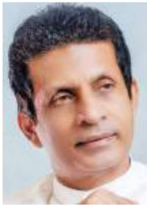
රාජය ඇමැති විජේ බේරුගොඩ