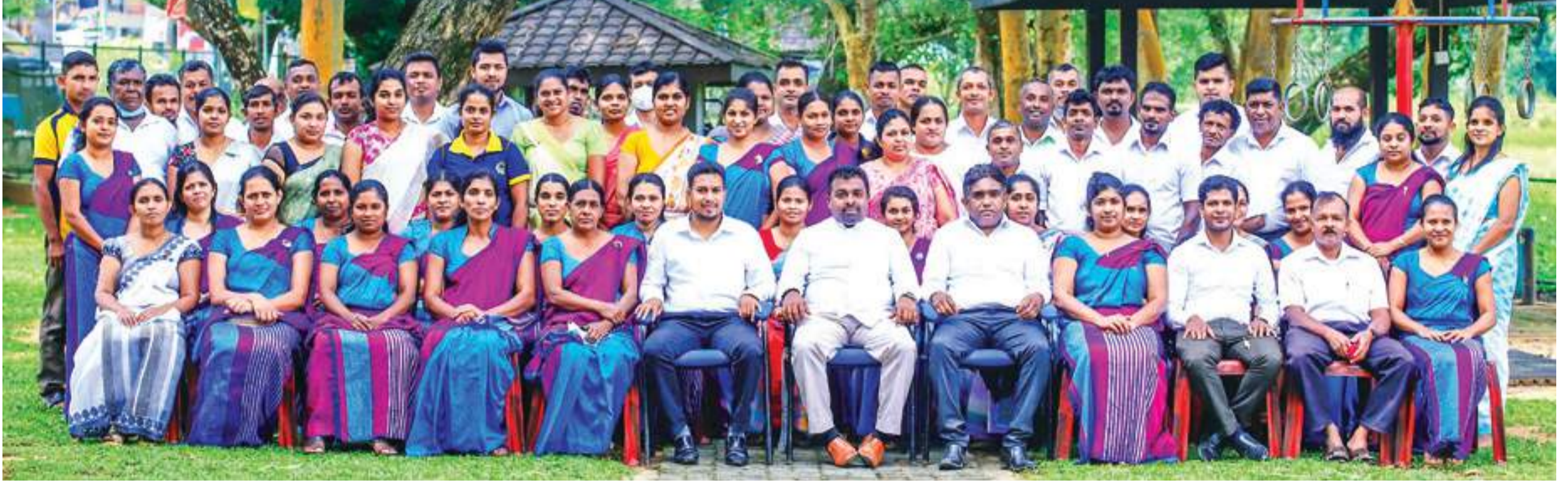
මඩුල්ල ප්‍රාදේශීය සභා නිලධාරීන්