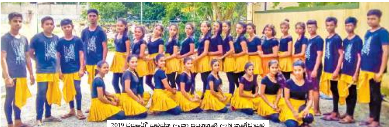
2019 වසරේදී සමස්ත ලංකා ජයග්‍රහණ ලැබූ කණ්ඩායම