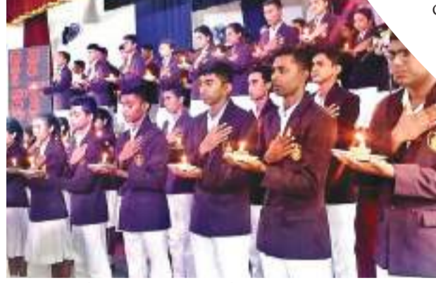
ශිෂ්‍ය නායක මණ්ඩලය දිවුරුම් දුන් මොහොත