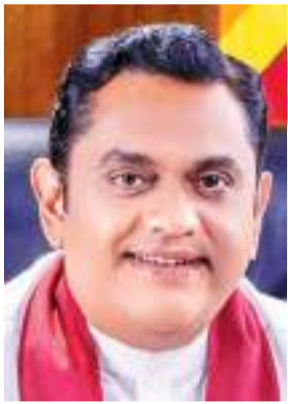
කාමිකර්ම රාජය ඇමැති ශ්‍රී ලංකා රාජපක්ෂ