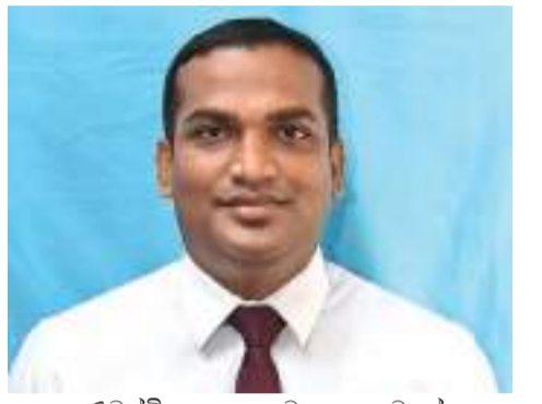
තණමල්විල කලාප අධ්‍යාපන අධ්‍යක්ෂ