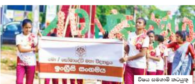
විෂය සමගාමී කටයුතු