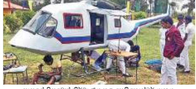
පාසලේ සිසුවෙකු නිර්මාණය කළ හෙලිකොප්ටර් යානය