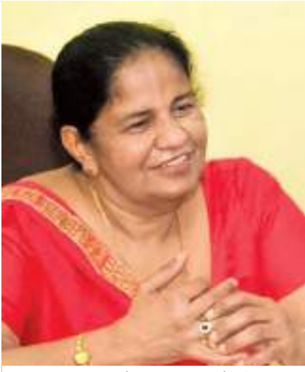
ඌව පළාත් අධ්‍යාපන ලේකම්