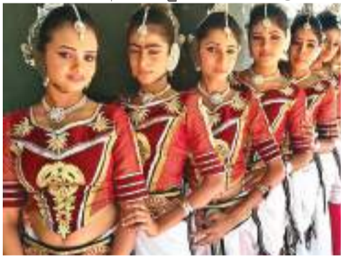
නර්තන අංශයෙන් දක්කම් දක්වන සිසුවියන්