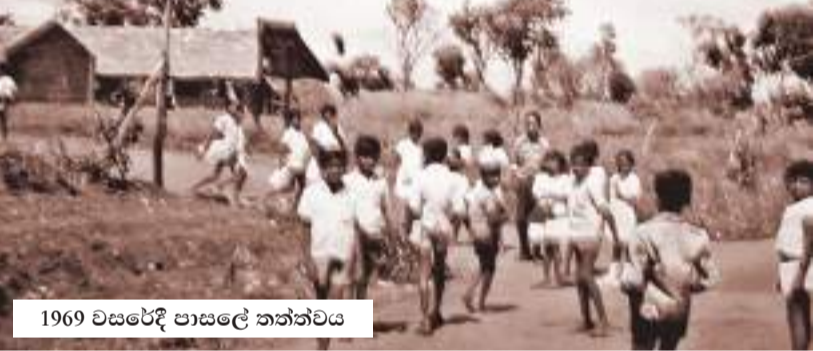
1969 වසරේදී පාසලේ තත්ත්වය