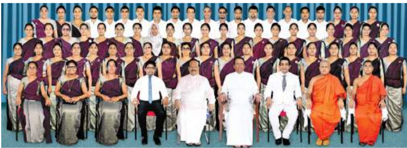
විලයා මැදි විදුහල ජාතික පාසලක් වූ දා හිටපු ජනාධිපතිවරයා සහ පළාත් ආණ්ඩුකාරවරයා සමඟ පාසලේ ඇදුරු මඩුල්ල