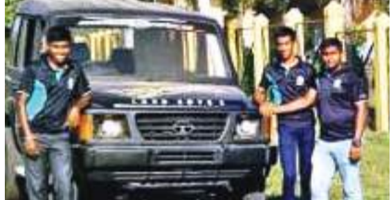
තාක්ෂණික අංශයේ සිසුන් නවකරණය කළ ජප් රථයක්