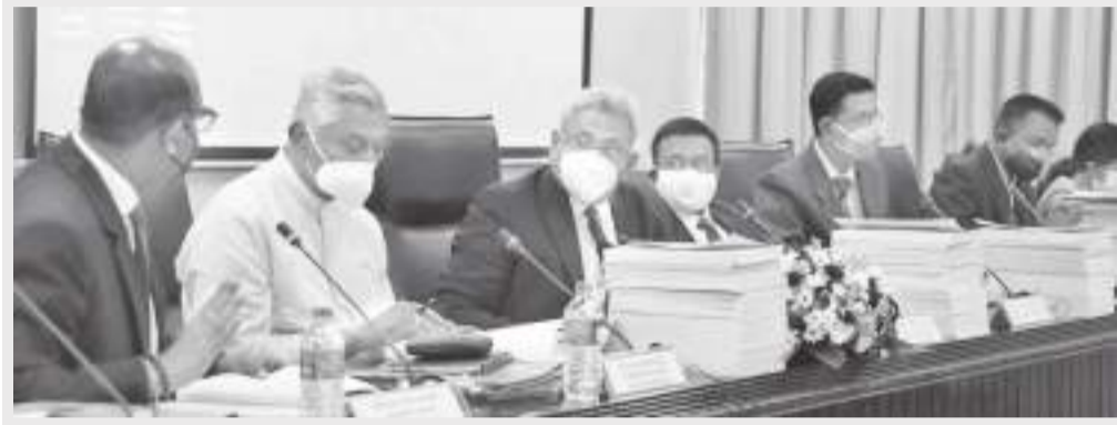
ස්වර්ණ විජේකෝන්, සන්ධ්‍යා කරුණාරත්න ජනාධිපති ගෝඨාභය රාජපක්ෂ මහතා රජයේ (8) දහවල් පාර්ලිමේන්තුව සංකීර්ණය වෙත පැමිණියේය. ආරක්ෂක අමාත්‍යාංශ උපදේශක කාරක සභාවට සහභාගි වීම සඳහා රජයේ දහවල් 2.15 ට පමණ ජනාධිපතිවරයා එලෙස පැමිණියේය. ආරක්ෂක අමාත්‍යාංශ කාරක සභා රැස්වීමේ පැය එකතමාරකට අධික කාලයක් ජනාධිපතිවරයා රැඳී සිටියේය.

ලෙස අනුබල ලැබී තිබෙනවා. පාසික ප්‍රහාරය අවස්ථාවේ කාදිනල්වරයා සාමකාමී ලෙස ක්‍රියා නොකළේ නම් මේ රට ලේ විලක් වෙනවා. ඒ ගැන අපි කාදිනල්තුමාට සිතුවන්න විය යුතුයි.