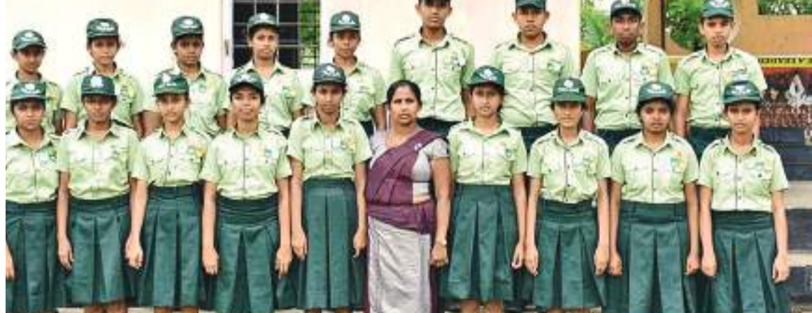
ජනාධිපති සම්මාන අපේක්ෂිත පරිසර නියැලීමට කණ්ඩායම