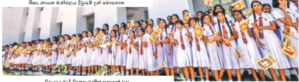
විලයා මැදි විදුහල ජාතික පාසලක් වූදා