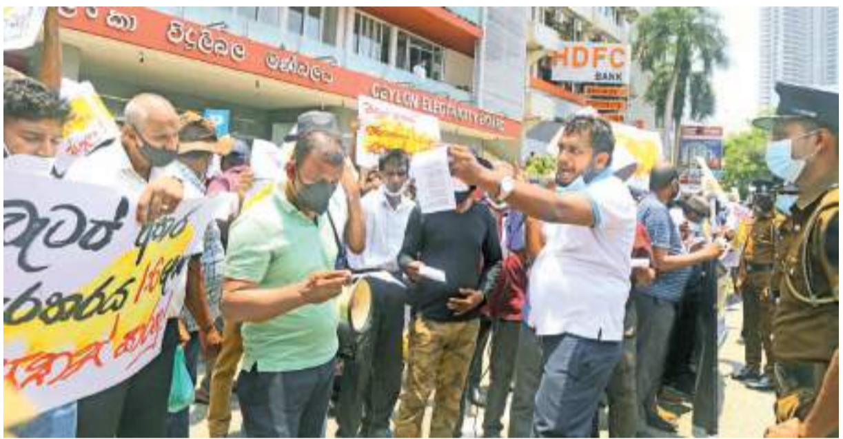
සියයට තිස්හයකින් වැටුප් වැඩිකිරීම, විග්‍රාමකයන්ට සහන සැලසීම, අනතුරුදීමනා ලබාගැනීම ආදී ඉල්ලීම් කීපයක් ඉල්ලා විදුලි සේවකයන් ඊයේ (8) විදුලිබල මණ්ඩලය ඉදිරිපිට උද්ඝෝෂණයක නිරත වූ සුදුරු.

සිට මේ දක්වා එකමුතුව ක්‍රියා කළ සෑම අවස්ථාවකදීම පක්ෂය ජයග්‍රහණය කර තිබෙනවා. බෙදී වෙන් වුණ හැම අවස්ථාවකදීම පරාජයට පත්වුණා. දැන් අප හැමෝමම අවශ්‍ය වී තිබෙන්නේ ජයග්‍රහණය කිරීමටයි. එසේ නම් සියලු පාර්ශ්ව ඒ ගමනට එක්විය යුතුයි. ගැලපෙන නොගැලපෙන අය සිටිය හැකියි. නමුත් ඒ සියලු අය එකමුතුව ක්‍රියා කළ යුතුයි. විශමන් පාලනය නිසා පීඩාවට පත්ව සිටින ජනතාව අද රනිල් වික්‍රමසිංහ මහතා ගැනත් එක්සත් ජාතික පක්ෂය ගැනත් කතා කිරීමට පටන්ගෙන තිබෙනවා. එරාප පාලනයක් තිබුණා නම් රටේ ආර්ථිකය දියුණු වෙනවා. ඉතිහාසයේ එරාප පාලනය තිබුණු සෑම අවස්ථාවකම රටේ ආර්ථිකය දියුණු වුණා. පුළුල් සංවර්ධනයක් රටේ ඇතිවුණා. ජනතාව අතට මුදල් ලැබුණා. ජාත්‍යන්තර සමඟ විශ්වසනීයත්වයෙන් කටයුතු කලා. අද ඒ සියල්ල බිඳ වැටී ශ්‍රී ලංකාව අරාජික රටක් බවට පත් වෙමින් තිබෙනවා.