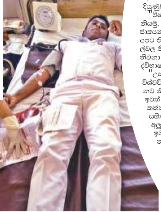
උසස් පෙළ සිසුන්ගේ වාර්ෂික ලේ දන් දීමේ වැඩසටහන