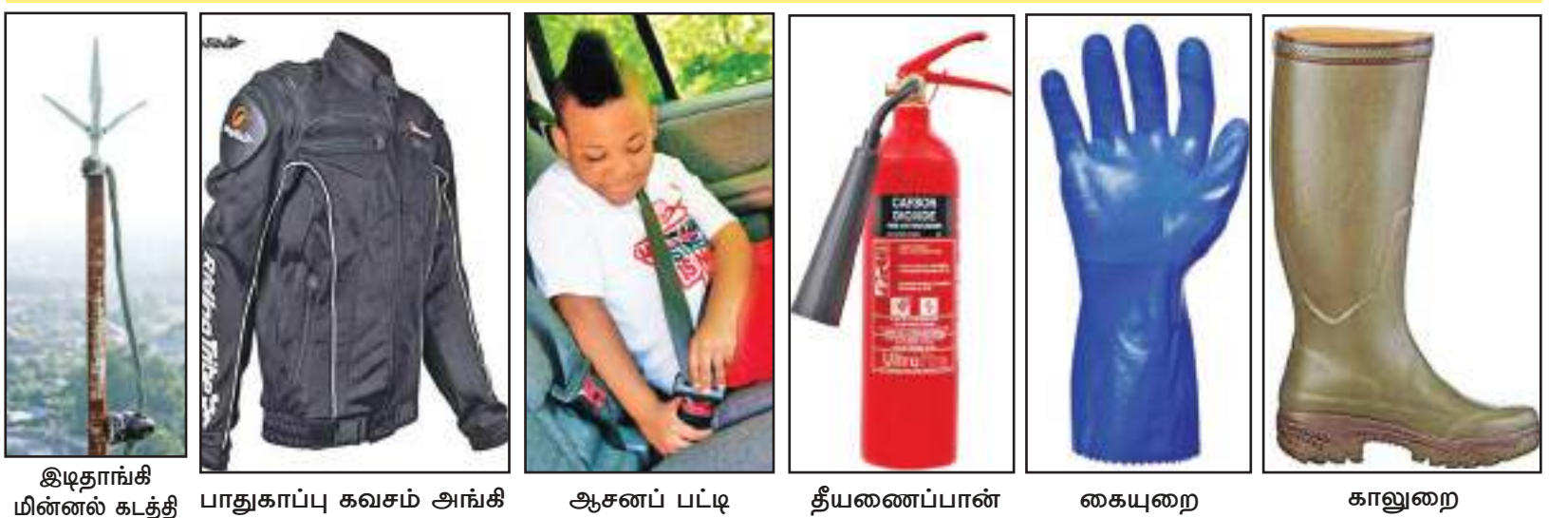
இடிதாங்கி மின்னல் கடத்தி