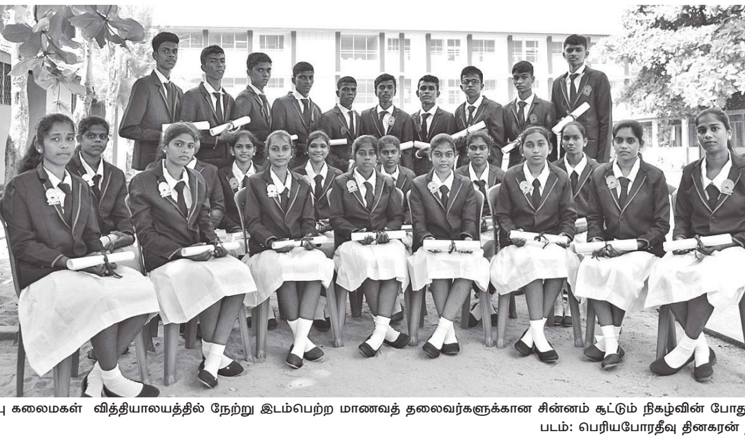
மட்டக்களப்பு கல்வி வலயத்திற்குட்பட்ட ஆறுமுக்கத்தான்குடியிருப்பு கலைமகள் வித்தியாலயத்தில் நேற்று இடம்பெற்ற மாணவத் தலைவர்களுக்கான சின்னம் ஓட்டு நட்சத்தி போது எடுக்கப்பட்ட படத்தை இங்கு காணலாம்.