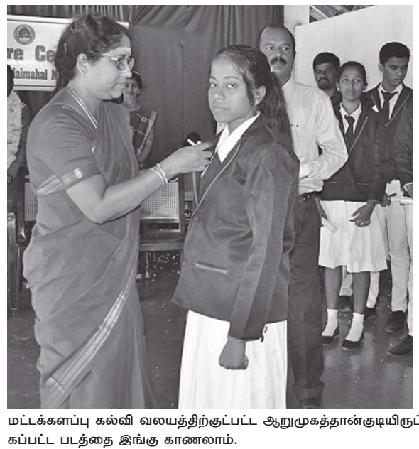
மட்டக்களப்பு கல்வி வலயத்திற்குட்பட்ட ஆறுமுக்கத்தான்குடியிருப்பு கலைமகள் வித்தியாலயத்தில் நேற்று இடம்பெற்ற மாணவத் தலைவர்களுக்கான சின்னம் ஓட்டு நட்சத்தி போது எடுக்கப்பட்ட படத்தை இங்கு காணலாம்.