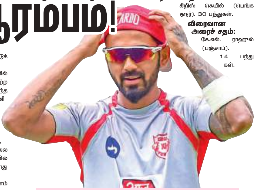
2016ம் ஆண்டு, 17 போட்டிகள், 973 ஓட்டங்கள். விரைவான சதம்: சிறீஸ் கெயில் (பெங்களூர்), 30 பந்துகள். விரைவான அரைச் சதம்: கே.எல். ராஹுல் (பஞ்சாப்), 14 பந்துகள்.